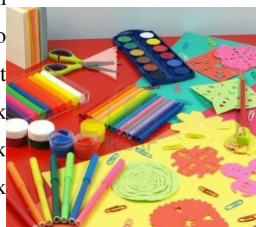
3. irudia. Klasikoak apaintzeko materiala.

Jarduera honetan, talde bakoitzak aurreko jardueretan lortutako informazioa egituratzeari eta idazteari ekingo dio. Ondoren, talde bakoitzak informazio hori hainbat euskarri ezberdinetan idatzi beharko du; hiru taldek horma-irudiak egingo dituzte eta beste hiru taldek liburuentzako "markapaginak". Informazioaz gain, irudiak eta marrazkiak atxikitzeko aukera izango dute.