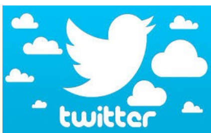
2. irudia. Twitter sare soziala.

Fase berri honetan, talde bakoitzak aukeratutako obra irakurtzeari ekingo dio. Irakurketa banaka izango da, nahiz eta taldean obraren inguruan hitz egiteko aukera izan. Aipatu beharra dago, ez dutela obra osoa irakurriko, baizik ere euren adinera eta interesetara gertuen dauden pasarteak. Pasarte hauek, tutoreak aukeratutakoak izango dira eta moldatuta egongo dira jadanik, hots, euskara batuan idatziak.