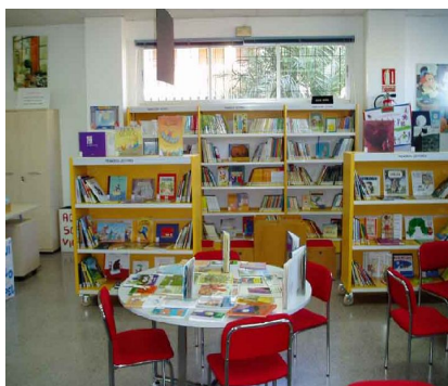
1. irudia. Literatur txoko baten eredu.

Lehenengo jarduera honetan, tutoreak ikasgelan euskal autore zaharren txokoa prestatuta izango du. Txokoa, euskal klasikoen liburuak eskuragai egongo dira, mahai ezberdinetan ikusgai. Irakasleak taldeak osatuko ditu eta talde bakoitzari (4 ikasle) Euskal klasikoen kanon literarioa fitxa 1 banatuko die eta zer egin behar duten azalduko die.