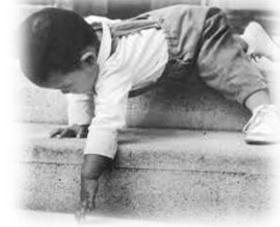
3. Osasun egoera ona

janariaren aldetik, baita inguruari eta eguneroko jardueri begira. Erregulartasunez egiten diren medikuntza-azterketen bidez haurren garapen globala ezagutzeko aukera bikaina dute. Proiektuaren ezaugarri nabarmenetarikoa kanpoaldean aurrera eramandako bitzta dugu, haurrak ahalik eta denbora gehien ematen baitute eraikinaren kanpoaldean. Hezitzaileek haur gaixoa taldearen barnean zaindu egiten dute. Gaixotasunaren ondorioz segurtasunik gabeko egoera batean egonda, taldearen zein hezitzailearen presentzia inoiz baino beharrezkoa dela uste dute eta horregatik eguneroko jarduerak eskaini diezaioketen segurtasunetik aldentzea zentzugabea ikusten dute.