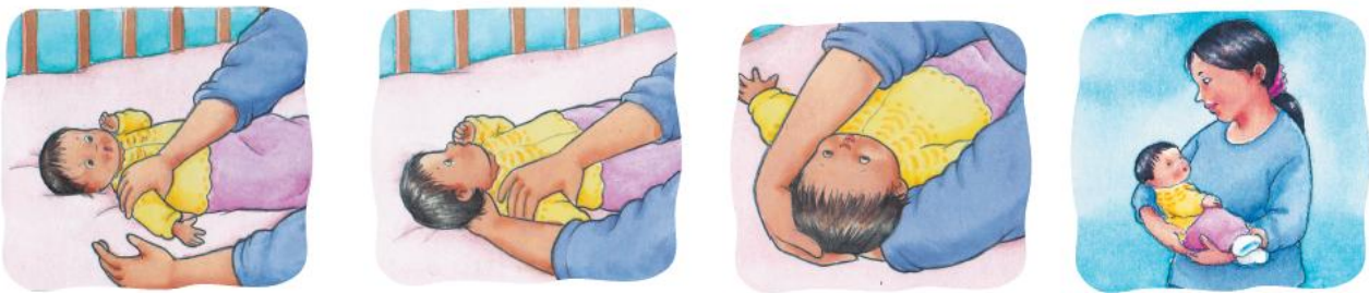
4. Haurra eusteko modu egokia

Hezitzaileak haurra eusteko eta uzteko moduak aurrekoa modu argi batean erakusten du: lehendabizi, haurra bere izenarekin deitzen zaio, beharrezkoa bada buruz-gora jartzen zaio hezitzaileari begira, zeina haren begirada bilatzen du; ondoren, besoa altxatu egiten zaio pixka bat, hezitzaileak haren buruaren azpitik bere eskua sartu ahal izateko eta berau modu egoki batean eusteko; soilik momentu horretan altxatu egiten da haurra.