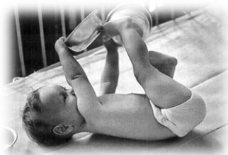
1. Jarduera autonomoa