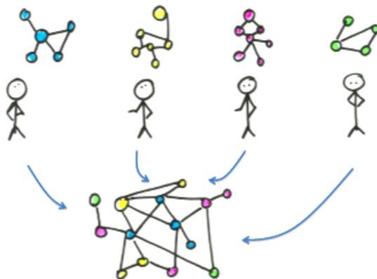
Figura 1: Proceso de implementación participativo del método FCM 11. Los expertos son entrevistados individualmente. Se les pide que trasladen su experiencia y percepción a un mapa de nodos conectados entre sí, cuyas relaciones (positivas o negativas) están ponderadas del 0 al 1. Posteriormente, los mapas individuales son agregados a un modelo final, a través de un proceso de interpretación.

Catorce expertos (agentes) participaron en este proceso. La pregunta clave que guió las entrevistas fue: “Según tu experiencia, ¿cuáles son para ti los factores que más influyen en el uso de la energía en Bilbao y cuáles sus impactos (los del uso de esa energía)?” El ejercicio, basado en entrevistas personales detalladas para la elaboración de los mapas mentales individuales, y el