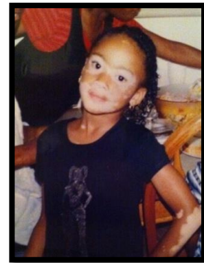
4. irudia. Winnie txikitan

Txikitatik modeloa izatea nahi izan dut. Jende askok pentsatzen zuen ezin izango nuela nire ametsa egi bihurtu nire makulak zirela eta, baina egia esaten badizuet, nire fisikoa inoiz ez da arazo bat izan niretzat. Gauza positibo baten moduan hartu izan dut, besteengandik desberdintzen nintzelako. Gainera, nigan konfiantza izanda, gaur egun modeloa naiz.