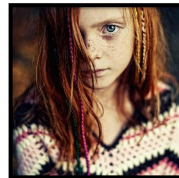
7. irudia. Amale. 2015.

Aitortu nahi dizuet ezezagunekin oso lotsatia naizela, eta beraz, asko kostatzen zaidala nire bizitzari buruz hitz egitea.