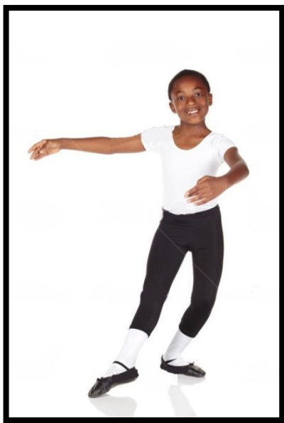
3. irudia. Mikel

Ballet-a asko gustatzen zait eta egia esanda, oso trebea naizela pentsatzen dut. Honetaz gain, betidanik, futboleko aritzea gustukoa izan dut. Honetan ere, jokalaria bikaina kontsideratzen naiz. Eskolan, lagun asko ditut eta izugarri gustatzen zait haiekin jolasten egotea.