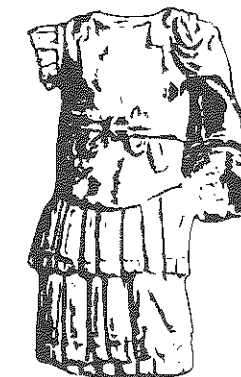
Torso thoracatus hallado en Iruña, Álava, la antigua Veleia