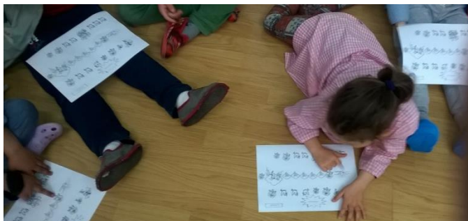
1. irudia: musikograma lantzen.

A. Vivaldi-ren Udaberria pieza musikalaren entzunaldia musikograma baliabidea erabiliz.