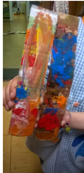
7. irudia: Kaskainetak sortzen.