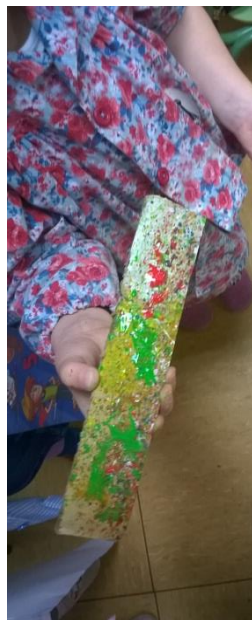
6. irudia: Kaskainetak sortzen.