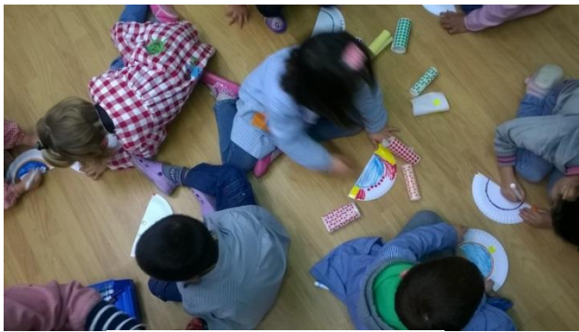
14. irudia: Lepokoak egiten.