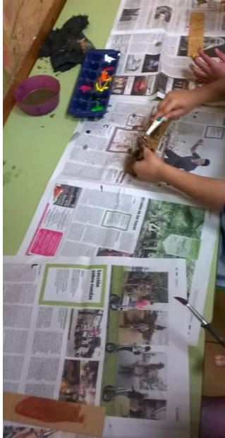
5. irudia: Kaskainetak sortzen.