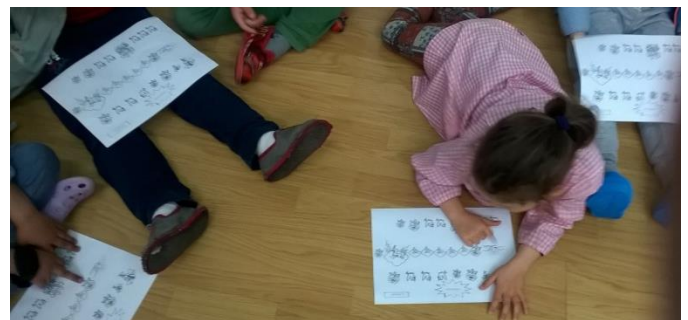
20. irudia: musikograma jarraitzen.