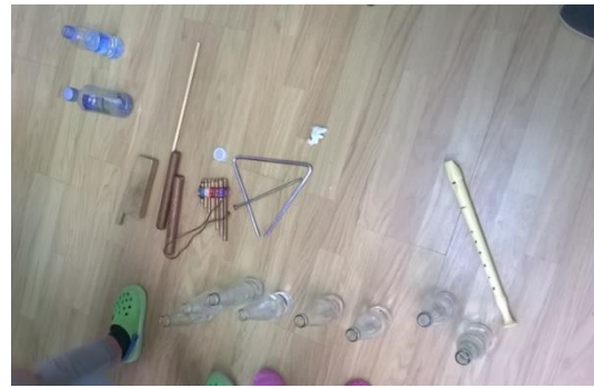
13. irudia: Instrumentuak lantzen.