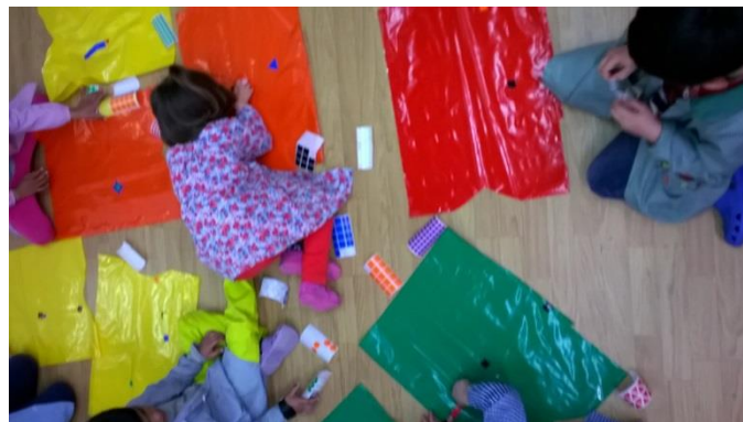
16. irudia: Jantziak egiten.