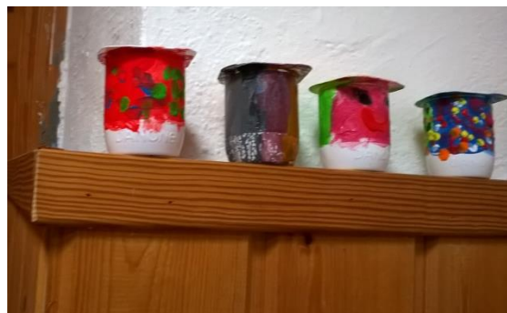
11. irudia: Marakak lehortzen.