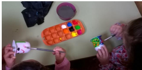
9. irudia: Marakak sortzen.