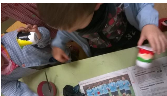
10. irudia: Marakak sortzen.