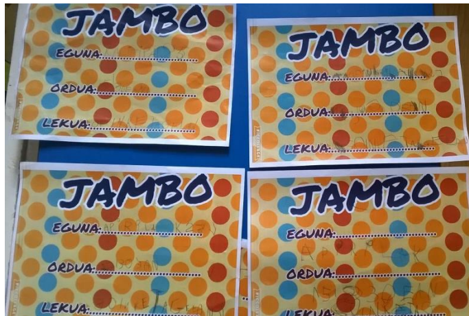
18. irudia: Idatzitako gonbidapenak.