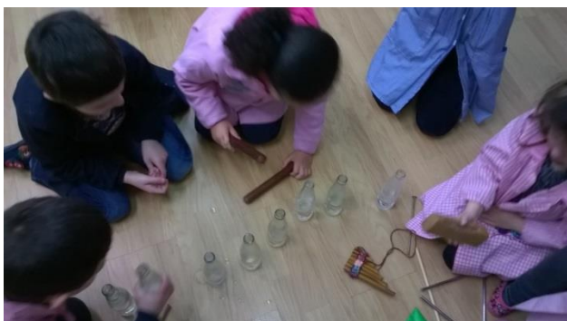
2. irudia: instrumentuak probatzen.

Marko teorikoan esan bezala, aberasgarria da beste instrumentu batzuk ezagutzea eta horretarako, egun bitan, eskura izan diren instrumentuak ekarri dira, hala nola, gitarra, txirula, zampoña, triangelua, klabeak, kutxa txinatarra, tinbala, bongoa, teklatua eta kristalezko botilak.