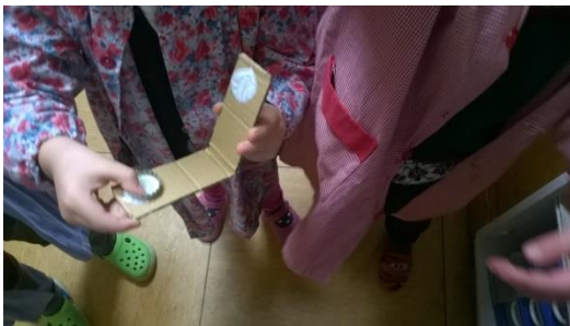
8. irudia: Txapak itsasten.