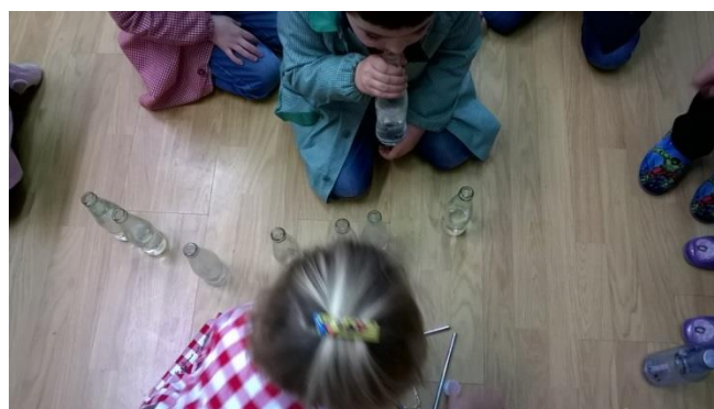
3. irudia: instrumentuak probatzen.