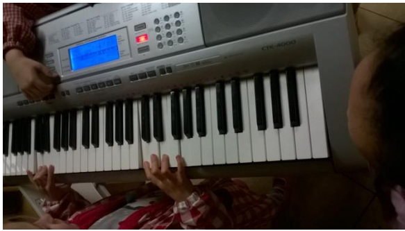
12. irudia: teklatua probatzen.