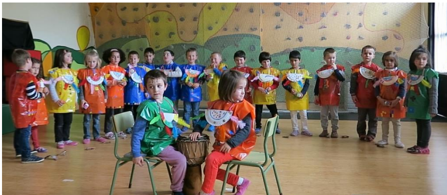
4. irudia: instrumentuak probatzen.

Jarduera gehienak jakintza arloka planteatu badira ere ikuskizuna antolatzerakoan jakintza arlo ezberdinak bateratu eta integratu dira.