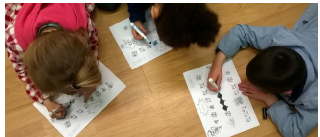
21. irudia: musikograma margotzen.