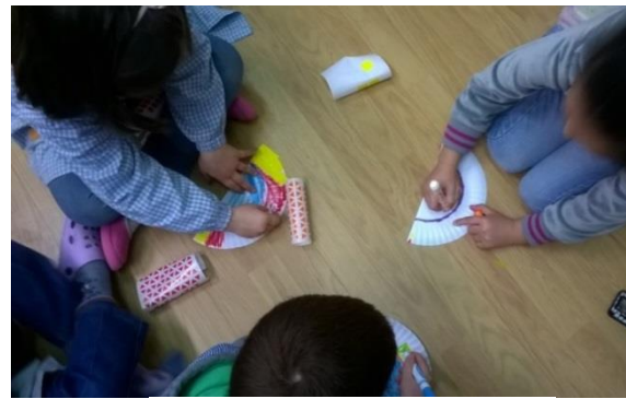
15. irudia: Lepokoak egiten.