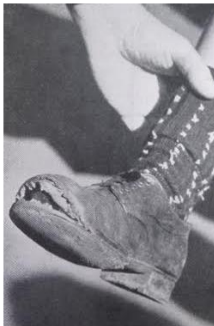
Irudia 16. Alemaniar haurren oinetakoen egoera.

“De vez en cuando intentaban mendigar; un niño de diez años con una sola pierna, que seguramente había perdido la otra durante una noche de bombardeo, salta como un pájaro lisiado en torno a la cantina de los americanos juntando las manos en gesto de súplica. A veces, un soldado blanco o negro se apiada del niño y le lanza algo: un trozo de chocolate mordido sacado de un envoltorio, un bocadillo robado, unos pocos cigarrillos para trapichear; todo ello provoca un revuelo salvaje, en ocasiones una pelea, una enganchada” 55