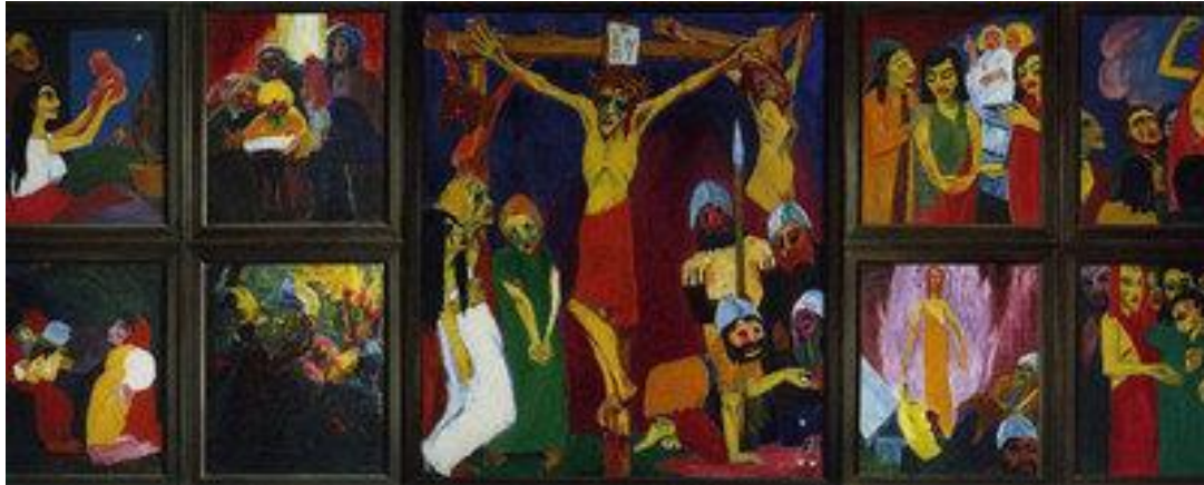
Irudia 18. Emil Nolde-ren pintura gainbeheratua

Arte plastikoak ere traba handiak pairatu zituen, naziek erabilitakoa. Hala ere, naziek maite ez zuten artista bat Nolde izanzen, atzerrira joan egin behar izan zuena naziek haren pintura gainbeheratu zutenean.