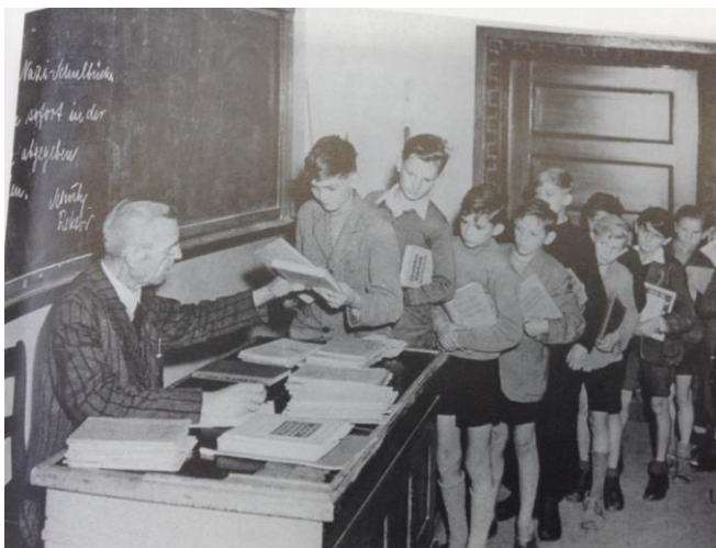
Irudia 21. Alemaniar haurrak eskola doazte Aquisgran-en.

Hiriari dagokionez, suntsitu gelditu zen. Etxe batzuen egitura antzeman daiteke. Enparantzak hutsik gelditu dira, etxeen aurriez eta adreiluzko mendiez inguratua, haien azpian milaka gorpu daudelarik; kale luzeak, aldiz, kotxerik gabe, jende