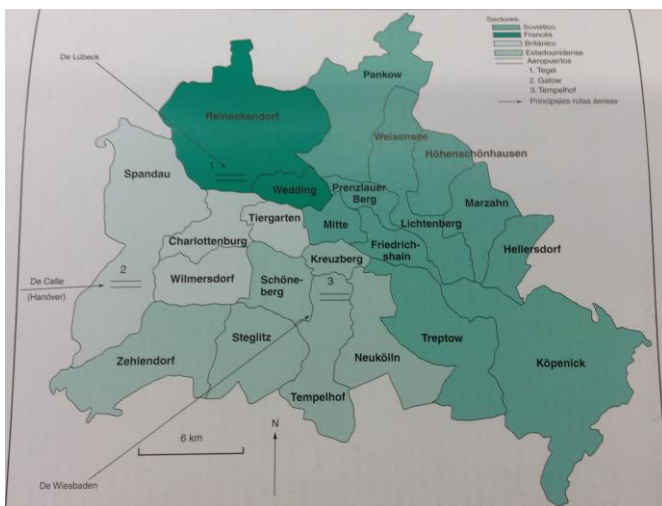
Irudia 2. Berlingo hiriaren lau sektoreen banaketa.