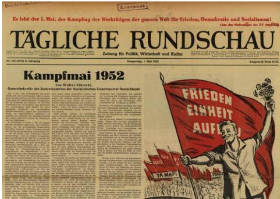
Irudia 19. Tägliche Rundschau egunkaria. Zorrozki aztertzen zen egunkari bat izan zen, errusiarrek zituzten eginkizunen buruz zerbait aipatzen bazuen.

Prentsari dagokionean, azaldu ziren egunkari berriak gerraren ondoren Ejertzito Gorriak argitaratutakoak izan ziren, propaganda eginez. Adibidez, Tägliche Rundschau ,