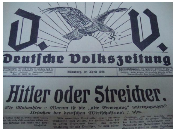
Irudia 20. Deutsche Volkszeitung , Berlingo lehenengo egunkaria.

argitaratu zen lehen egunkaria, 1945eko maiatzaren 15ean. Berlinean argitaratu zen lehenengo egunkaria Deutsche Volkszeitung -a izan zen, moskutar baten esku gelditu zena eta ondoren sozialista baten jarraitu zion Das Volk 68 .