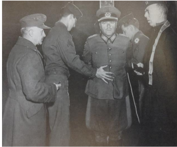
Irudia 3. Italia, nazien general bat hormatzen batean ezarria fusilatua izan aurretik.

Tentsio guzti haien testuinguruan, 1947. urteko Alemaniaren barne eta kanpo politika herrialdearen banaketa politikora zuzentzen ari zen. Estatu Batuetako gobernuak Alemanian mendebaldeko estatu bat sortzea erabaki zuen, inongo ahaleginik egin gabe Sobietar Batasunarekin. Urte horretako urtarrilean, Britainia Handiko eremua eta Estatu Batuek bateratu egin ziren “bizona” bat sortuz. Ondorioz, Sobietar