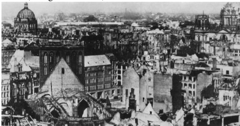
Irudia 4. Berlin 1945.

Berlin izan zen Bigarren Mundu Gerrako hiririk zapalduenetako, hiriak jasan zuen erasoen ondorioz. Hiriaren %80a suntsitua izan zen 30 . Berlin-en eman zen guda oso latza izan zen populazioarentzat. Buruzagi naziek ahalik eta gehien egiten zuten arerioa hiriaren bihotzera ez sartzearen. Albert Speer-ek, alemaniar arkitektoak eta Armagintza eta Bigarren Mundu Gerran Hirugarren Reich-eko Gerra Ministroak 31 , azpiegiturak eta monumentuak gordetzearen esfortzu handia egin zuen, nahiz eta denak kalteak izan zituzten, eta askok konponezinak. Mitte edo Tiergarten bezalako erdialdeko auzoak, oroigarriez beteak, bonbardaketen ondorioz txikituak izan ziren.