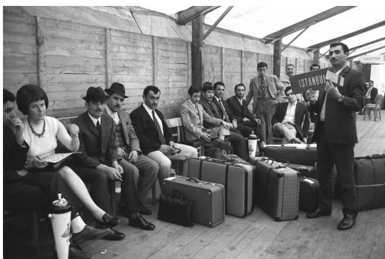
Irudia 13. Gastarbeiter: kanpotik “gonbidatutako langileak” AEF.

horniketa errefuxiatuak ziren, baina Berlingo harresia eraikitzerakoan bukatu egin ziren. Ondorioz, mediterraneoko herrialdetik eskuratzen zuen lan esku hori, batez ere Turkiatik. Langile ez kualifikatuak interesatzen zitzairen, zergak ordaintzen zituztena ongizate estatua mantentzeko, eta lan “zikinak” egiteko erabiltzen zituzten 52 .