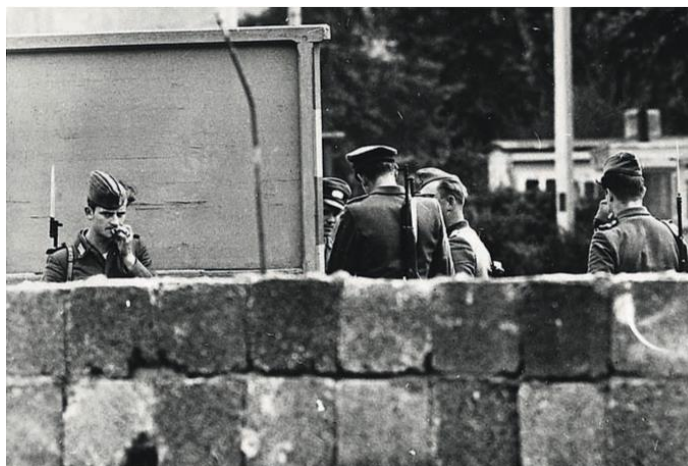
Irudia 23. Izugarrizko kontrola. Ekialdeko Alemaniaren polizia eta ejertzitoaren kideak harresiaren bestaldean

k. Gau erdian, AED-ko polizia eta ejertzitoaren kideek, Berlin hiriaren muga itxi egin zuten. Era berean, hainbat soldadu eta langileek eraikinak suntsitzen zenbiltzan eta hainbat kaleetan zehar ibilgailuak ezin izan zuten ibili. Hortaz gain, alanbrezko hesiak eta oholesiak ezartzen hasi ziren hiria banatzen zuen irudimenezko marrarenluzeran, 43 kilometroetan hain zuzen. Brandenburg atearen aurreko tarte batean izan ezik, non alanbrezko hesia uniforme jantzitako 5 000 gizon armatuengatik ordezkatu zirenak, eta haiek eraikuntza gelditzeko edozein saiakeraren aurrean tirokatzeko agindua zeukaten.