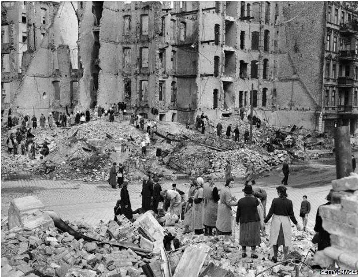
Irudia 12. Berlindar emakume bortxatuak.

http://www.bbc.com/mundo/noticias/2015/05/150505_finde_violaciones_masivas_berlin_egn (2015/05/08 argitaratua)