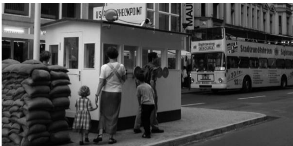
Irudia 24. Checkpoint Charlie, Friedrichstrasse. Bertatik pasa behar zuten derrigorrez Berlingo ekialdera joan nahi zuten ibilgailu guztiak. Irudian mugako etxola ikusi dezakegu Haus am Checkpoint Charlie museoaren parean.