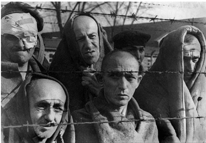
Irudia 17. Auschwitz sarraski esparruko judutarrak 1945ean

Azkenik, 1945eko udaran, judutarrak Alemanian gerrarako berezko unitateak zituzten. Brigadan 35.000 judutarrek eman zuten haien izena. Estatu Batuarren ejertzitoan Britainia Handikoan baino gehiago zeuden. Amerikarrak errefuxiatuei eginkizunak emateko prestutasuna azaltzen zutelako. Judutar askok, interpretatzaile moduan jarduten zuten, eta horretarako, Bruselako eskola berezi batean irasten zitzairen. Hala ere, nahiz eta judutarrak Alemaniara jakin, haien artean utzi egin zuten hizkuntza hori erabiltzeaz, kutsatutako hizkuntza bat iruditzen zitzaielako 58 .