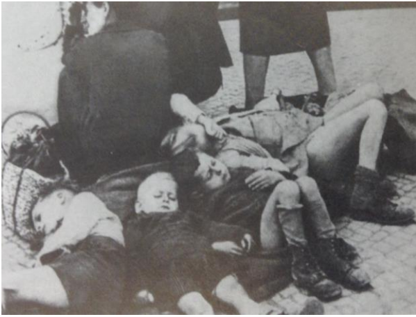
Irudia 7. Berlingo ume errefuxatuak.