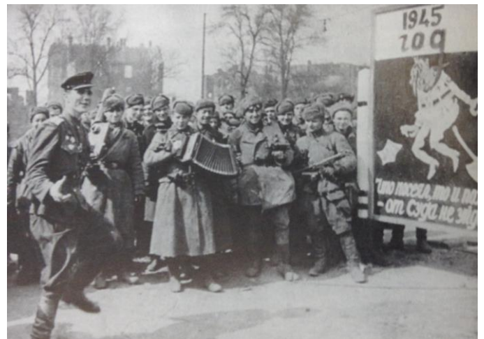
Irudia 10. Berlinen soldadu sobietarrak dantzan.

(...) eran como niños encantados con sus relojes nuevos. Uno de ellos fijaba la