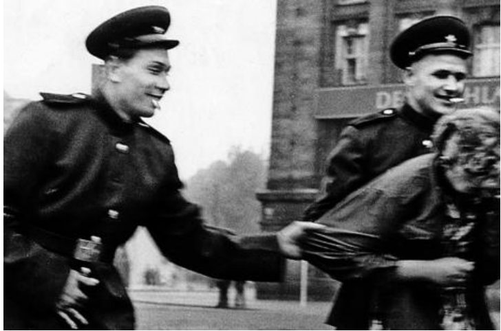
Irudia 11. Errusiar soldaduak alemaniar emakume baten atzetik 1945ean.

Beranduago, errusiarrak berlindarren janari erreserben bila hasi ziren eta bidetik aurkitzen zuten alkoholaz jabetzen ziren. Mozkortuta, eraikuntzei sua ematen zieten, edozer gauza suntsitu edo lapurtzen zuten. Jarraian, bortxaketak eta eraiketak ematen hasi ziren. Nahiz eta gurasoek haien alabak ezkutatu, hoge mila