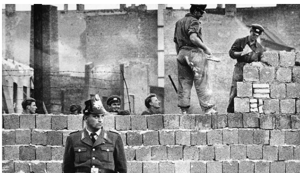
Irudia 22. Berlingo harresiaren eraiketa

Behin Alemaniako bi estatu horiek sorturik, eta herrialdea gobernu desberdinetan banaturik, aurrerakuntza ekonomiko, sozial eta politikoak desberdinak izan ziren. Hiriaren bi sektoreen desberdintasunak egunak joan ahala, handitzen eta tentsioa areagotzen joan zen 75 . Tentsioaren areagotze horrek eta bi sektoreen arteko