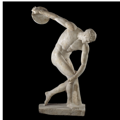
Fig 1: Discolobolo de Miron

Este ensayo pretende explicar el porqué de la relevancia de los atletas y para ello, es necesario un recorrido previo por el mundo de las ideas de Platón y por el término de kaloskagathia . ¿Por qué la kaloskagathia se asocia a lo divino?, ¿Qué es la areté ?, ¿Qué relación hay entre Kaloskagathia y areté ?, ¿Qué supone tener una alta areté ?