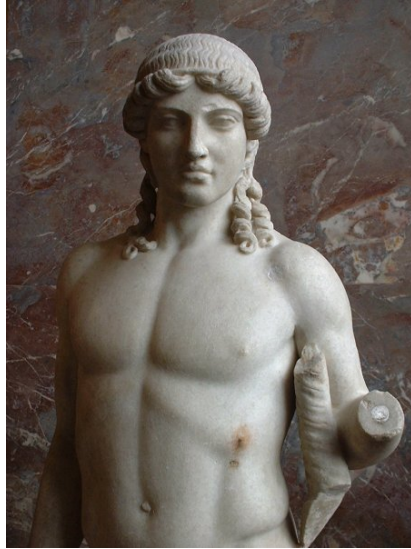
Fig.7: Estatua de Apolo de Mantua. Museo del Louvre. Copia romana de un original griego

Tradicionalmente se asociaba Kaloskagathia con la alta cuna, la belleza divina y rectitud moral en los aristócratas que se consideraban engendrados directamente de los dioses. La concepción de la aristocracia no consiste únicamente en pre-eminencia económica, política y social, sino representa la tendencia inherente de los nobles ( aristoi ) hacia kratein (ser descendiente de) , pero más concretamente to arista legein (elegir lo mejor). Con esto Mooney (2006) quiere decir que además de ser una clase, era un ejemplo para el resto. Eran vistos como moralmente más desarrollados y por supuesto también tenían un aspecto diferente.