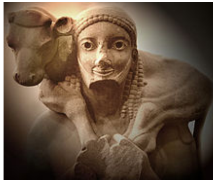
Fig.2: Moscóforo, ca. 570 a. C. Museo de la Acrópolis de Atenas.

Existen muchas interpretaciones sobre este mito tomadas de Platón (2003) en diálogos: Fedro. El hombre nace en el mundo de las ideas, que es a donde pertenece. Tras permanecer un tiempo en dicho mundo, puede observar la naturaleza de este reino. Posteriormente es lanzado desde el mundo de las ideas al mundo terrenal. Al caer en este, el espíritu - que existía previamente - se junta con el cuerpo terrenal. La unión de las partes forma la psique (cuerpo-alma) y nos consideramos una creación cuando nace la psique 9 . Cuando el espíritu da vida al cuerpo, lo llena de luz y lo anima. La sonrisa arcaica muestra el ánimo en el rostro, opuesto a lo inanimado.