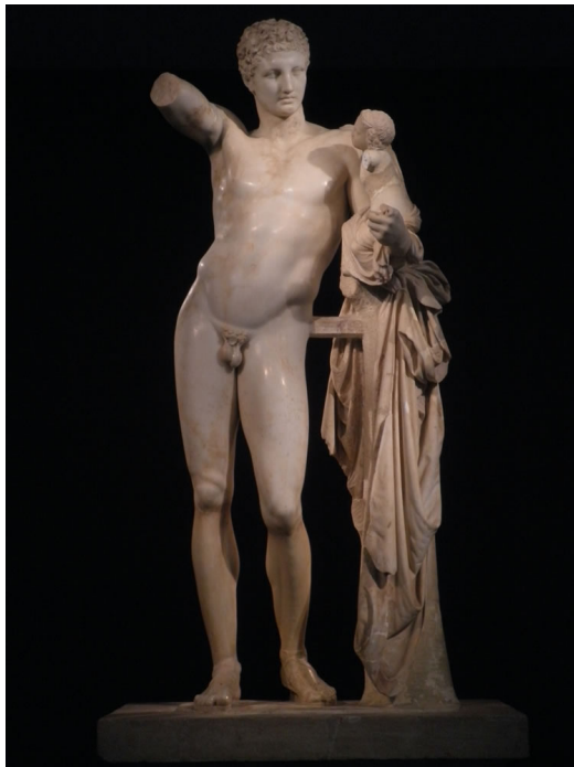
Fig.8 : Praxíteles, Hermes con el pequeño Dionisios, copia romana de Praxíteles, 375-330 a.C, Roma, Museo Romano Nacional.