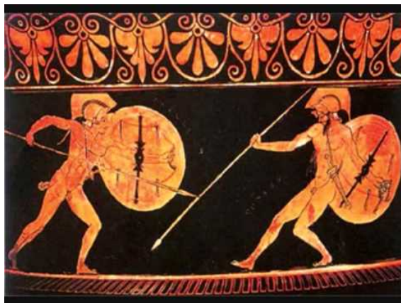
Fig.5: Aquiles contra Héctor

hecho que los héroes son siempre esforzados y hacen todo lo que pueden por sobresalir) como el hecho de que el vencedor cuenta con el beneplácito de los dioses (y por tanto puede llevar al ejército a la victoria – consultar a los dioses mediante la adivinación antes de la batalla era imprescindible; no hacerlo o no atender a sus avisos era castigado por los dioses con la derrota)