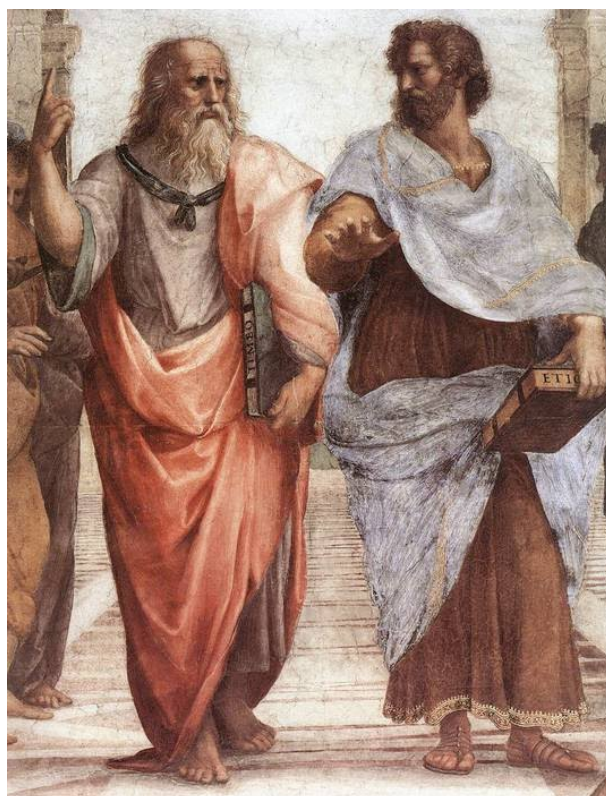
Fig. 8: Platón a la izquierda y Aristóteles a la derecha. The School of Athens (Scuola di Atene) 1509 - 1511 Raphael Rooms (tanze di Raffaello). Platón señalando al mundo de las ideas y Aristóteles el empírico.

He justificado a través de la kaloskagathia, la vinculación del Atleta con la idea central de la Paideia ( cultura) Griega. Un análisis en mayor profundidad de los patrones del gimnasio podría enriquecer el discurso sobre el atleta como persona virtuosa. Este forma de ver al atleta griego enriquece el conocimiento del deporte en la antigua Grecia en general. Principalmente, nos ayuda a entender el fenómeno del olimpismo y tener una mayor comprensión de los Juegos Olímpicos modernos. También nos permite cambiar de paradigma y contribuir al debate de la belleza del cuerpo o del movimiento físico.