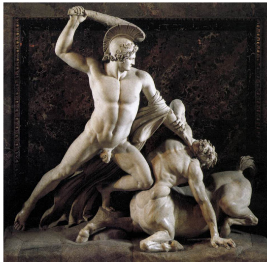
Fig.6 : Teseo y el minotauro de Canova.