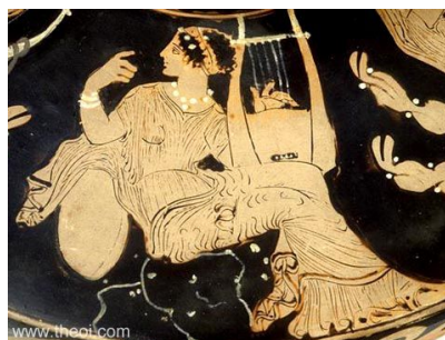
Fig.4: Musa tocando Lira

El guardián debe de entender la verdad en los temas importantes y tiene que ser capaz de interpretarlo a través de las palabras, pero también de sus acciones. (966 b 5-7). Una vez que el guardián haya considerado la forma en la que estos temas se relacionan a la Musa 18 , debe de aplicarlo a sus costumbres y prácticas del carácter.