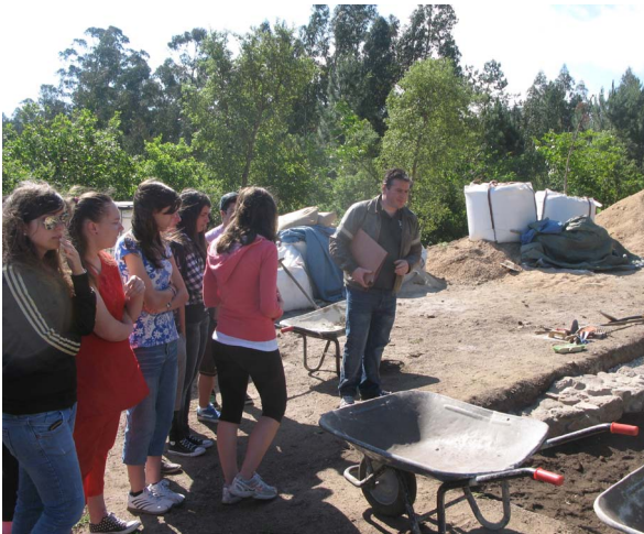
Figura 1. Escolares visitando el Castro de A Lanzada

yecto de los “Parques arqueominerarios de Val di Cornia” (Toscana, Italia).