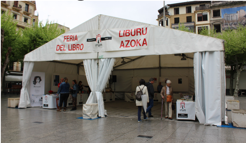
Liburuaren Azoka Irungo Zabaltza Plazan.

Urtero moduan, Irunen liburu tontor amaigabeak izan dira 2018ko apirilaren 23an, Liburuaren Egunean, protagonista. Labetik atera berri diren lanak literatur klasikoekin nahastu ziren erakusmahaietan. Apurka-apurka teknologia kulturaren munduan sartzen ari bada ere, egun honek argi eta garbi utzi zuen oraindik badela paperean irakurtzea gustuko duen jendea.