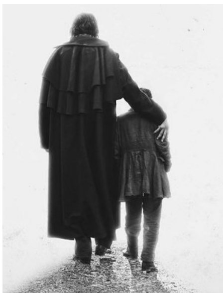
"Handia" pelikulako eszena bat.

Ez, egia esan, jada ez dut gauza horietan pentsatzen. Lanean gogoan jartzen eta gauzak ahalik eta hobekien egiten saiatzen naiz. Editatzen hasi eta