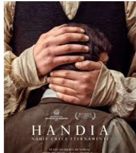
Pelikularen kartela.