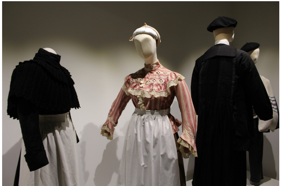
2. solairuko baserritar jantziak.