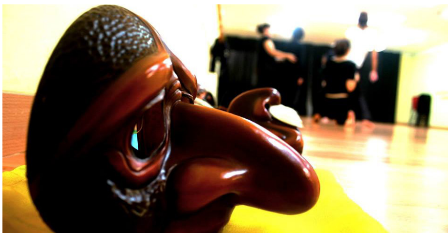
Antzerki Labeako tailerrak.

Miren Alcala Antzerki Labeako irakasleak azaldu du antzerkia pizkunde momentu batean dagoela. Hala ere, gizartean ez dago antzerkia kontsumitzeko kulturarik. Gainera, antzerki konpainiak eta hauek ekoiztako antzezlanak gero eta gehiago diren arren, erakundeek emandako babesa eskasa da oraindik.