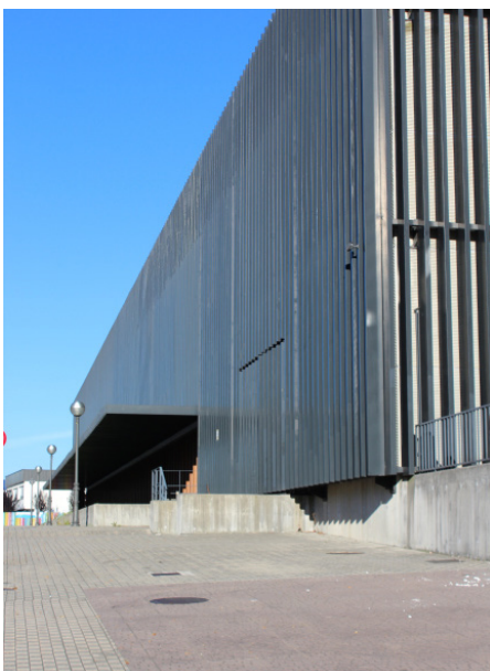
Gordailuaren eraikina Irunen