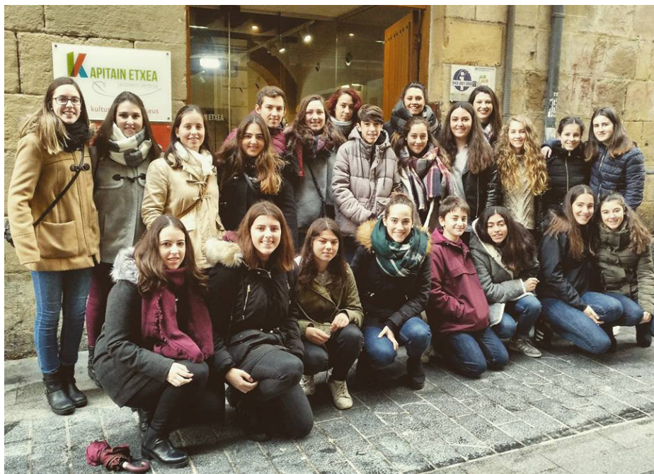
Eraiki Dantza Taldeko dantzariak Jantziaren Zentroan.