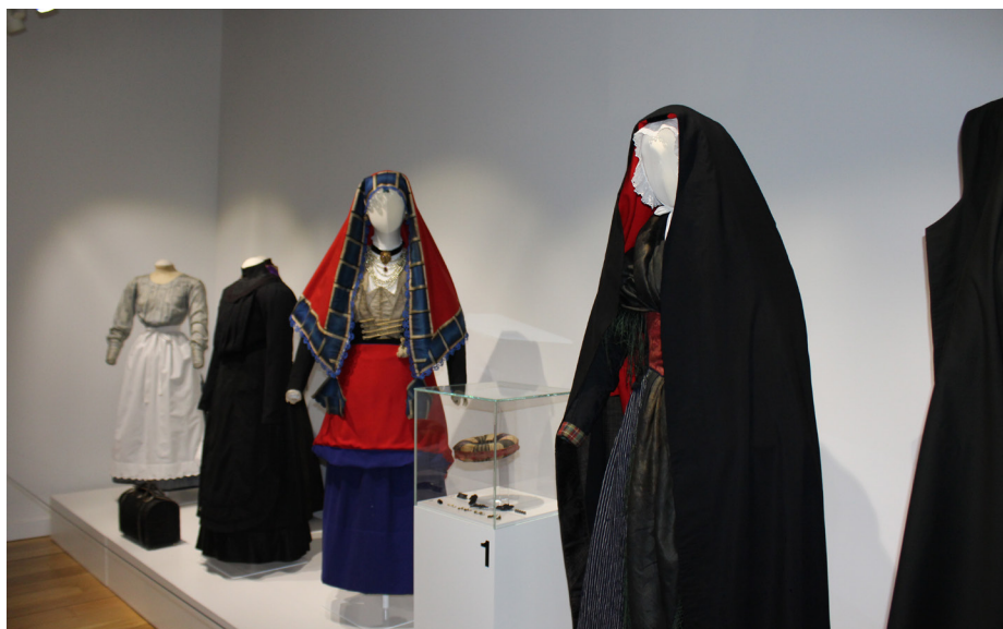
2. solairuko erakusketa.

Garciak jantziak ikertzeko prest zeuden taldekide guztiak bildu zituen lanean hasteko. Honela, boluntarioen laguntzaz euskal hiriburu eta artxibategi nagusiak miatu zituzten, iraganean euskal biztanleak nola jantzen ziren ezagutzeko. Artxibategietan gordertako argazkietatik lorturiko informazioa baliatuz, arropa berria egin zuten dantza taldearentzat. Egun, jantzi horiek Jantziaren Zentroko erakusketak antolatzeko erabiltzen dira.