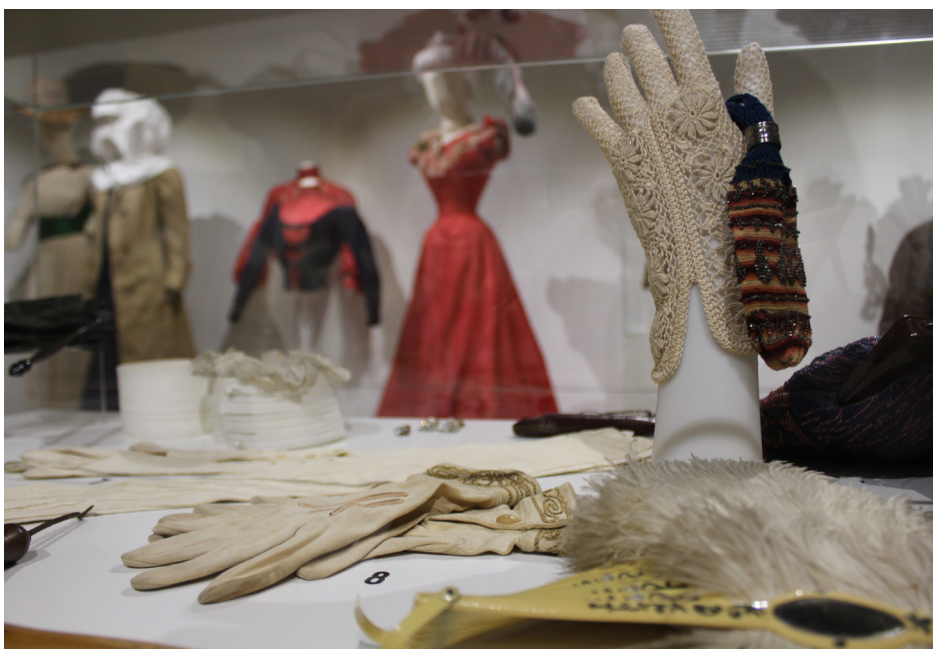
Jantziaren Zentroko 3. solairuko objektu berezien erakusketa