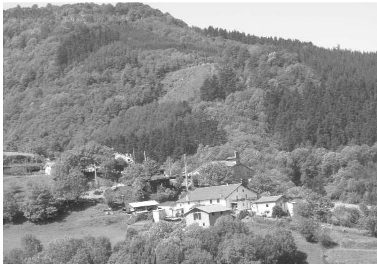
Bedaioko eliz gunea, Santa Maria elizako dorrea bistan dela (Iztueta, 2010)

Bedaioko eliz gunea 400 metroko altueran aurkitzen da, Berastegiko plazaren pare, Aralarko Balerdi mendiaren