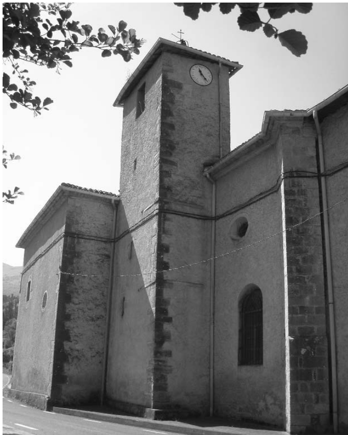
Ugarteko Santa Maria eliza, Bedaiorako bidean eskuin