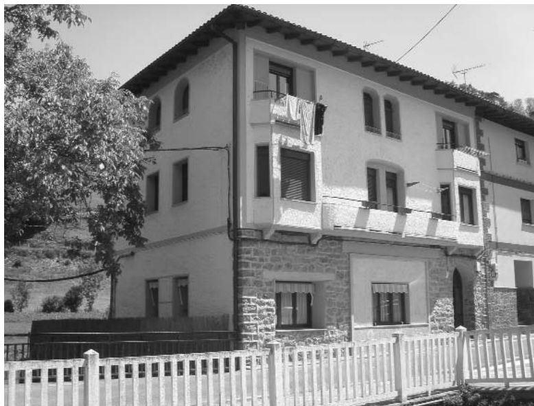
Amezketako Ugarte auzoan, elizatik hurbil eta erreka ondoan, Argañarás eraikina, garai bateko jauregia, arrosa kolorez eraberritua