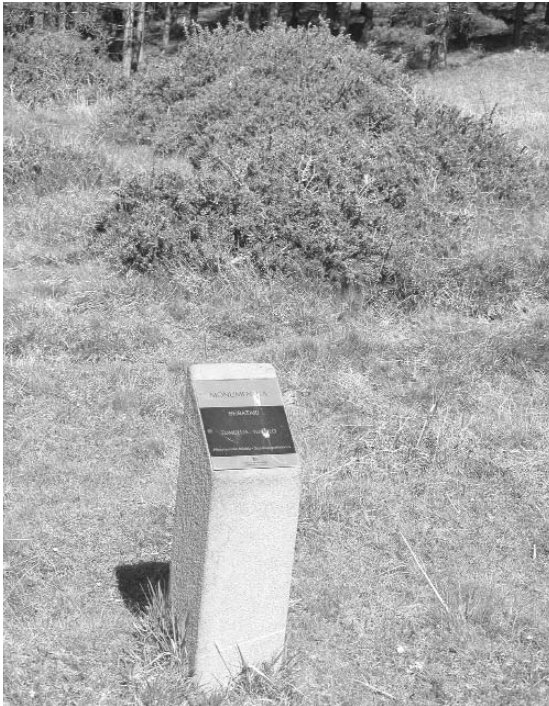
Beibatariko tumulua harriaren atzealdean, sasiartean ostenduta (Iztueta, 2010)

Trikuharri hau ADA taldeak aurkitu zuen 1981ean. Zabaleran 9,80 diametro ditu, altueran 50 zentimetro. Beibatarin ere bada tumulu txiki bat, zabaleran 6 metro eta altueran 50 zentimetrokoa, Neolito-Brontze garaikoa.