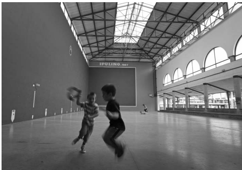
Berastegiko frontoi berria Ikastetxearen aurrez aurre (Lobo Altuna, 2010)

Obrak egiteko aurrekontua 47.000.601 pezetakoa zen, partidak honela banatuta: frontoi estalia 39.871.166; balio anitzeko ataria 3.083.176; inguruaren urbanizazioa 4.126.259.