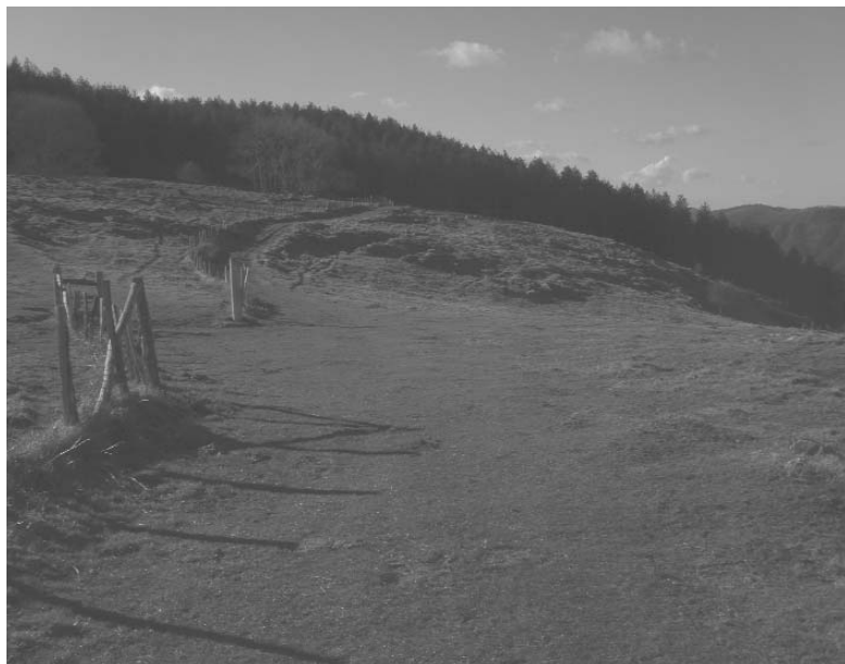
Larteko pilotalekuaren ingurua