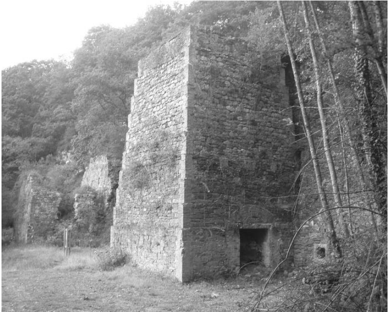
Bizkotxen minerala errausteko hiru labe ziren XX. mende-hasieran. Orain bi baino ez dira geratzen zutik (Iztueta, 2010)

metroko distantziara batetik bestera; altueran 8 metrokoak, eta kanpo-aldeko zabaleran 4,5 metro ingurukoak alde bakoitzetik, eta barne-diametroa 3,75 metrokoa. Minerala labe haietatik atera bezalaxe garraiatzen zen gero.