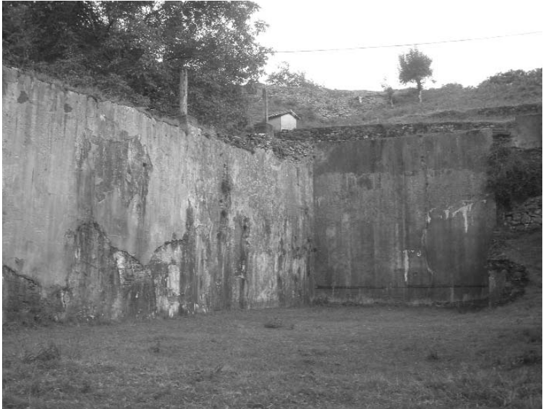
Ameraungo frontoia frontisean bere marra beltzarekin eta lurzorua belarrezko alfonbrarekin (Iztueta, 2010)