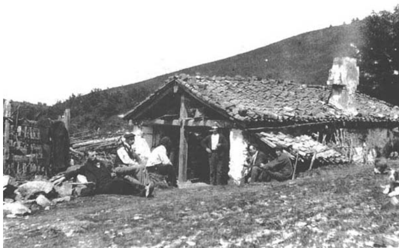
Uliko mikelete-etxe zaharra, hau ere 1898koa (P. Elosegiren bildumatik hartutako argazkia, Recondo, 2010, 310)

Zarate eta Ulin eraiki ziren; errege-bideetan, berriz, Endarlatza, Pagoaga, Illarratzu, Lizarrusti, Etxegarate, Otzaurte eta Urton. Beraz, Berastegin bi mikelete-etxe zeuden eraikiak: errepidekoa Urton eta mendikoa Ulin. Berastegiko mikelete-etxe hauek Tolosako barrutiari zegozkionak ziren eta hango buruzagiaren egiteko nagusia zen mikelete-etxeak hamabost egunez behin bisitatzea, jasotako dirua biltzea, eta soldatak banatzea. Bidaiak zaldiz egiten zituen (Recondo, 2010, 312-314).