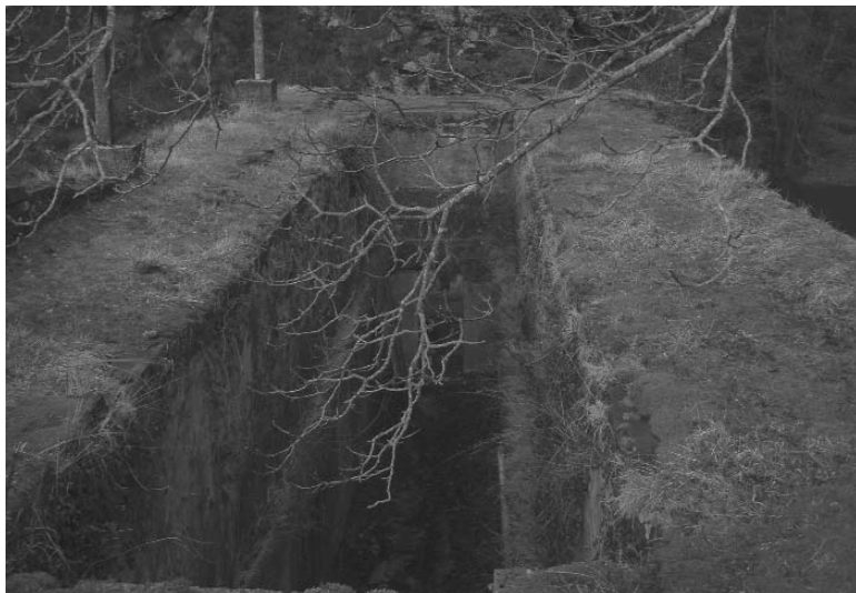
Ameraungo burdinolako anteparak, luzezan 23 metro eta alboetako horma sendoen artean bi metroko tartea (Iztueta, 2010)

daude kanpoko aldetik. Jatorrizko lurzoruak oraingoak baino 1,1 eta 1,3 metro beherago egon behar zuen. Anteparen altuera gutxienik 6,2 metrokoa zen. Horien atzean eta etxebizitzaren artean zahar itxurako horma-hondakin batzuk agertzen dira, burdinolaren garaikoak izan daitezkeenak. Zepen hondakinik ez da ageri, seguru asko, zentrala egiterakoan desagertu zelako. Burdinolaren etxebizitza, baserria, gaindegitxo batean kokatua aurkitzen da eta handik ederki bistatzen dira beheko instalazioak. Egun gauden ukuilu bezala erabiltzen da. Egoera onean aurkitzen den harrizko zubi batetik barna joaten da Ameraundik Berastegirako bidea, Beibatari eta Gorosmendi mendilepoa zeharkatuta.