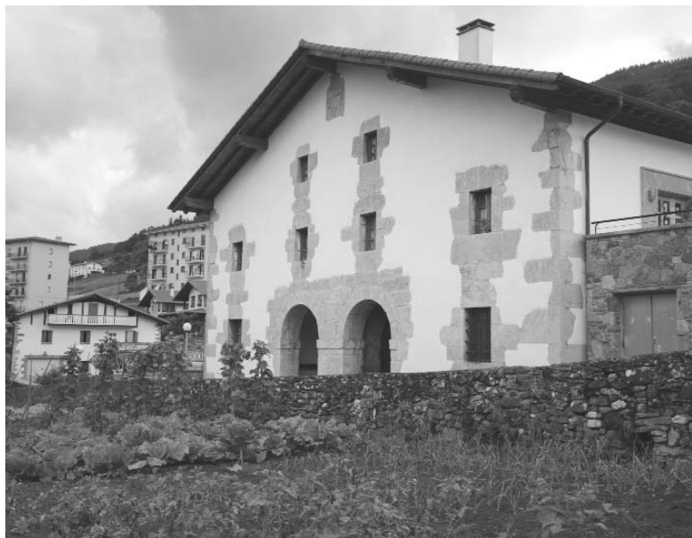
Gaztañondo etxea, berriztatuta. Jubilatuen Elkarte eta Egunekeo Zentroaren egoitza (Lobo Altuna, 2010)