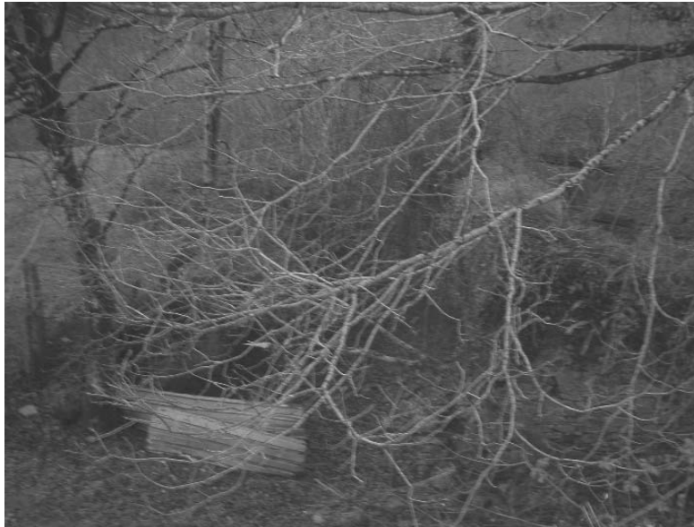
Ollokiegiko burdinolako anteparak sasiartearen (Iztueta, 2010)

onean aurkitzen da eta, nahiz ez bertan bizi, egunero izaten da norbait. Trenbidearen geltokia ere gordetzen da, nahiz egoera txarrean dagoen. Baita presa ere, Leitzaran ibaiaren gainean eraikia izan zena. Presak 40 metroko luzera du eta 4ko altuera, egun Olamia fabrikari paper-pasta egiteko eta, halaber, Ollokiegi zentralerako makinak mugiarazteko erabiltzen dena. Kanalak 300 metroko luzera du. Olamiako fabrika egitean, haren lehen zatia estalita geratu zen.