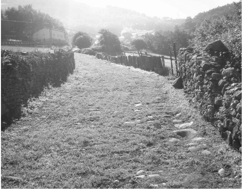
Pastagintxonea eta Bentaberri arteko errege-bidea, belarrez estalia (Iztueta, 2010)