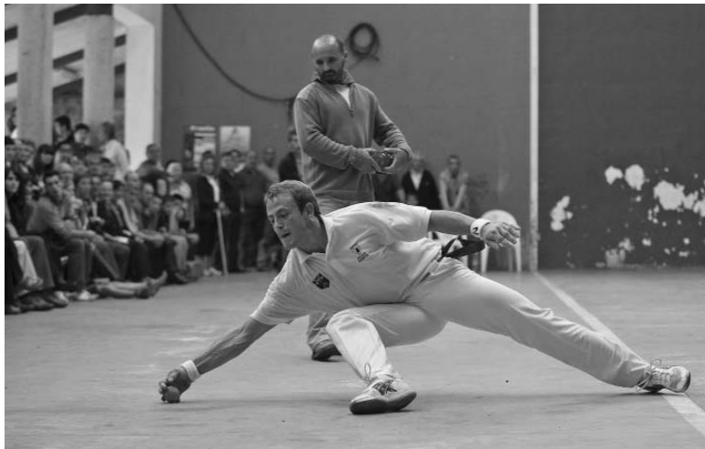
Pilota-partidu bat herriko festatan (Lobo Altuna)

Frontoia egin geroztik Berastegin indarrean datoz pilotari gazteak, afizionatu-mailan oso aurrera dabiltzanak.