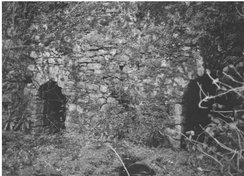
Plazaolako burdinolaren arkuak (Iztueta, 2010)

Izen bereko baserria burdinolaren etxebizitza izan zen, harrizkoa, hiru oinekoa. Horren aurretik pasatzen da zentralaren kanala. Eraberritua izan da 2004an.