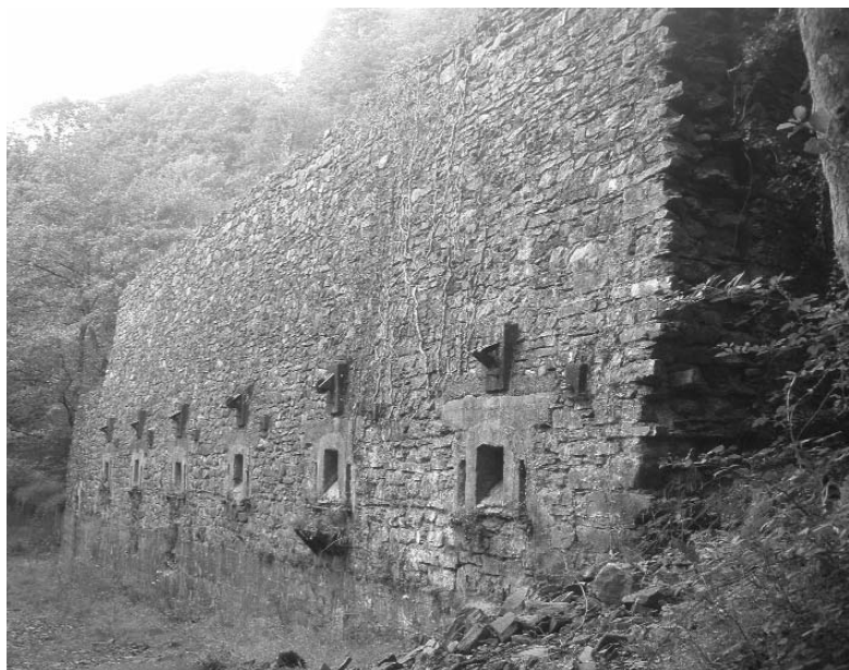
Kargatzeko tokiak Bizkotxen

inklinatu erabiltzen zituzten 1907an. Lehenak 3. mailako beheko meazulotik 2.a arteko ibilbidea egiten zuen; bigarrenak, 1a. artekoa. Hemendik eramaten zen karga labeetara.