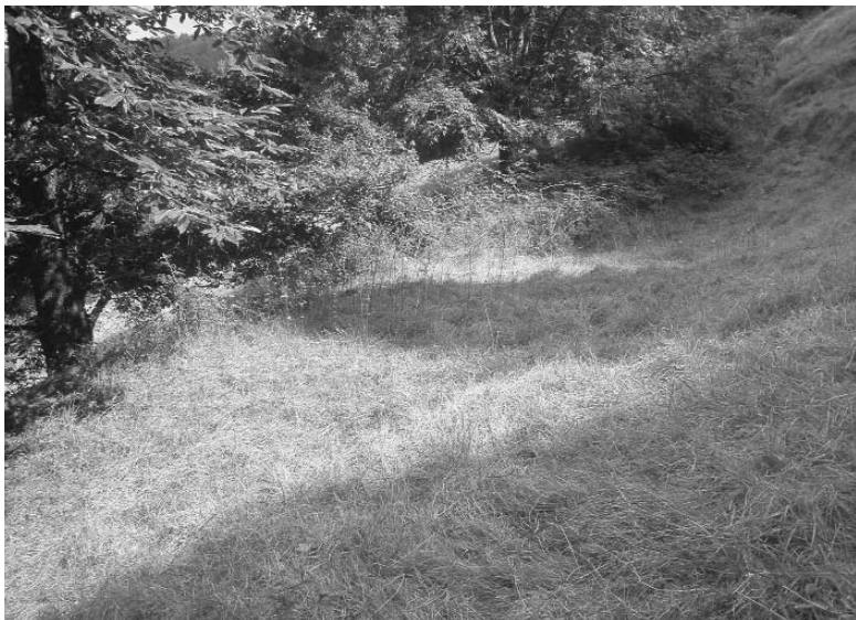
Domintxinborda kokatua egon zeneko zokogune laua, erdi-eguzkitan, Milleneko belazean, egun desitxuratua dagoen galtzada-ondoko zuhaitzen eskuinetara (Iztueta, 2010)

Egun desagertua den Domintxinborda non kokatua zegoen eta Estrataundi zeini deitzen zitzaien jakinda –hura Gorostizutik Iruinerako bidean ezkerretara hartu eta Milleneko belazean, bidearen gainaldean, eta hau Zaparitegitik Bordatxorako bidean gora–, zalantzarik ez da mandazainak Ulitik Berroara aterako zirela, seguru asko Milleneko bordan barna. Ulin bertan bada beste bigarren bide bat ere –hau zuzenagoa eta aldapatsuagoa aldi berean–, errekarri jarraiki Arratera eramaten duena. Uliko Azurmendi mendizainaren familiak bide hau erabiltzen zuen herriratzeko. Nolanahi ere, adar biek Izotzalden bat egiten dute.