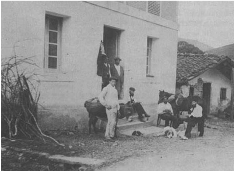
Urtoko mikelete-etxea, 1898an eraikitakoa. Honen ondoan dagoen beste txiki hori lehengo ariel-etxe zaharra da

Mikeleteen Gorputza 1839ko irailaren 24an sortu zuen Foru Diputazioak, beste helburuen artean, bakea eta segurtasun publikoak bermatzeko eta, 1856. urteaz geroztik, probintzi arielak bildu eta, bide batez, kontrabandoari aurre egiteko. Horretarako probintziarteko mugak zaindu behar zirenez, mugako pasabide estrategikoetan eraiki ziren mikeleteen etxeak, mendiko mandabideetan bezala erregebidetan. Mikelete-etxe hauek Probintzia osoan zehar banatuta zeuden, Donostia, Ordizia, Bergara eta Tolosako barrutietan. Non zehazki? Gipuzkoak Nafarroarekin mendiz muga egiten zuen lekuetan, Aritxulegi, Sarasamendi,