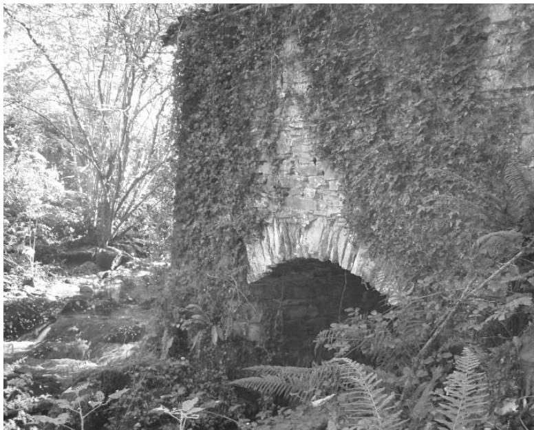
Arrosiko bigarren errota. Errota-etxearen horma bere arkuarekin (Iztueta, 2010)

Bigarren errota, aurrekotik 20 metrora-edo, aurkitzen da, errekan behera joanda, ezkerretara. Honek ere bazuen bere presa, eta lehenengo errotaren arkupeetik ateratako urak lurrazpitik bideratuz betetzen zen. Oraindik ere bistan dago bidea zeharkatzen zuen ubidearen hasierako zatia. Eraikina eta presa zutik daude, baina egoera oso txarrean, larrez eta sasiz erdi-estalita. Atzeko hormaren kontra, txakurtegia dago.