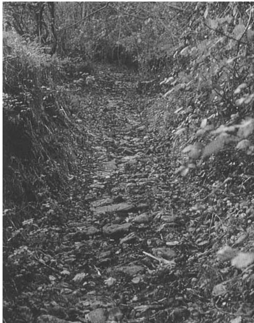
Domintxinbordako galtzada Ulirako bidean (Barrena Osoro, 1991, 80)

Hondarribiara eramaten zuen, eta beste adarrak, berriz, Berrobin barna, Tolosara, eta hemendik, Oria zeharkatu ondoren, Bidania eta Errezildik Iraurgira (egungo Azkoitiara), eta hemen berriro bitan banatuko da Bizkairako bidean, Azkaratetik Areitioko mendi-portura eta Elosuatik Elgetakora joateko. (Barrena Osoro, 1991, 98-110). Zalantzarik ez da Uliko mendatea, jadanik XI. mendetik hasita, leku estrategikoa izan dela Nafarroatik Gipuzkoarako bidean. Horren lekuko dira kareharri irregularrez egindako bi galtzada, “Domintxinbordako bidea” eta “Estrata aundiko bidea” bezala ezagutzen direnak (Barrena Osoro, 1991, 80).