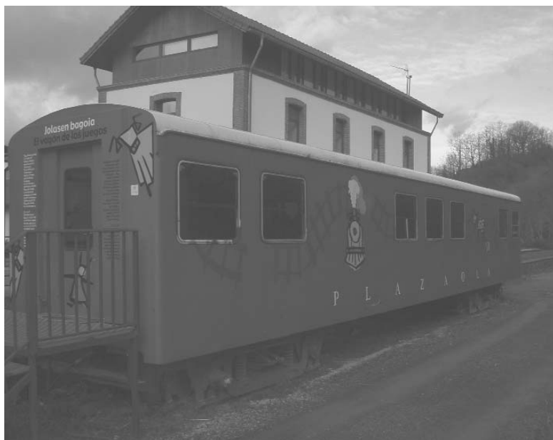
Plazaolako tren-bagoi bat Lekunberriko geltokian (Iztueta, 2010)

berriak egitekotan ere egon zirela, baina, batetik, 1940an Leitzarango burdingintzak porrot egin zuelako eta, bestetik, 1953ko urriaren 14 eta 15ean izandako uholdeek trenbidea erabat hondatuta utzi zutelako, batez ere Larraungo aldean, horrek guztiak krisia areagotu baino ez zuen egin. Leku jakin batzuetan, Olloki eta Andoainen artean, egur-garraio batzuk eginez segitu zuen sei urtez-edo, baina azkenean, 1958ko irailaren 5ean, errailak kendu eta trenbidea erabat ixteko baimena lortu zuen Konpainiak.