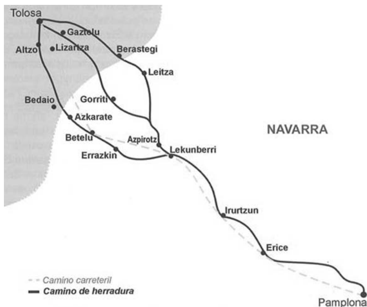
Nafarroa eta Gipuzkoa arteko garraiobidea Erdi Aroan, XVIII. mendera arte (Recondo, 2010, 280)

tuak 1414an sustatu zuena. Horixe izan zen, hain zuzen, Nafarroako erresumaren betiko ametsa, Gipuzkoa Gaztelako lurralde izatera pasa zenez geroztik. Beharrezkoa zuen merkantziak garraiatzeko bide hori. Ordurako, gainera, XIII. eta XIV. mendeetan muga-herrietan izandako liskarrek baretuak ziruditen (Martirena, 2010, 20-22). Asmoak, ordea, astiro joan ziren betetzen. Bide eta errepideen erai-kuntzan mandabidetik autobiarako ibilbidea dago tartean eta iraultza horrek mende luzeetako historia du.