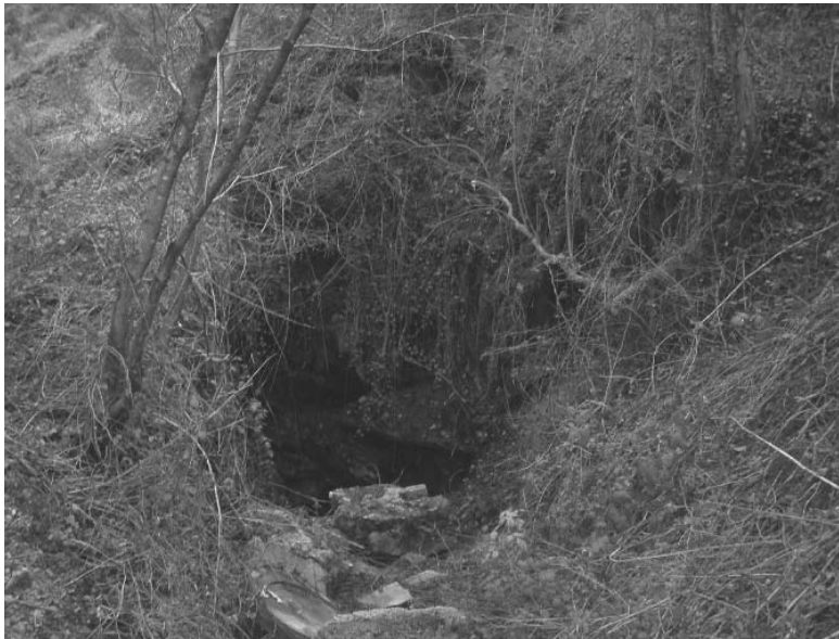
Plazaolako meazuloetako bat (Iztueta, 2010)

izan dela lehengo denbora zaharretan ere Altzegi erreka-aren inguruan. Nolanahi ere, hemengo meatokien emakidak XIX. eta XX. mendeko-hasierakoak dira. Olizar, Urdanbide eta Altzegiko meatokiak, batzuetan, “Lorditzeko” taldean sartzen dira eta beste batzuetan, berriz, “Berastegikoan”, hemengoan Bizkotzekoa ere barne dela. Guk ere hauek elkarren ondoan azalduko ditugu. Altzegi eta Urdanbideko meatokiak martxan jartzean egin zen Lorditzeko trenbide txikia, abereek tiratuta erabiltzekoa, baita bi labe ere.