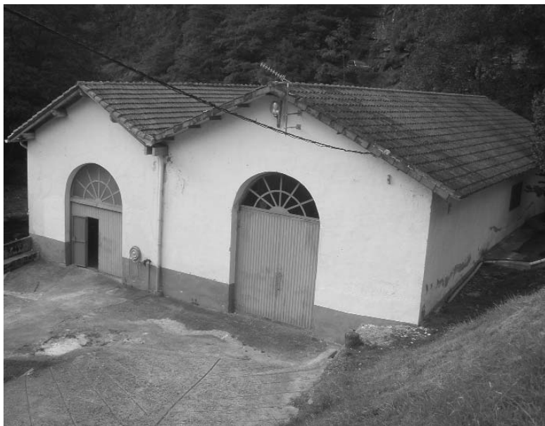
Ameraungo zentrala, Leitzaran ibaiaren ondoan eta aurrean eskuin, bide-ondoan, goiko presako urak dakartzan hodi beltza (Iztueta, 2010)