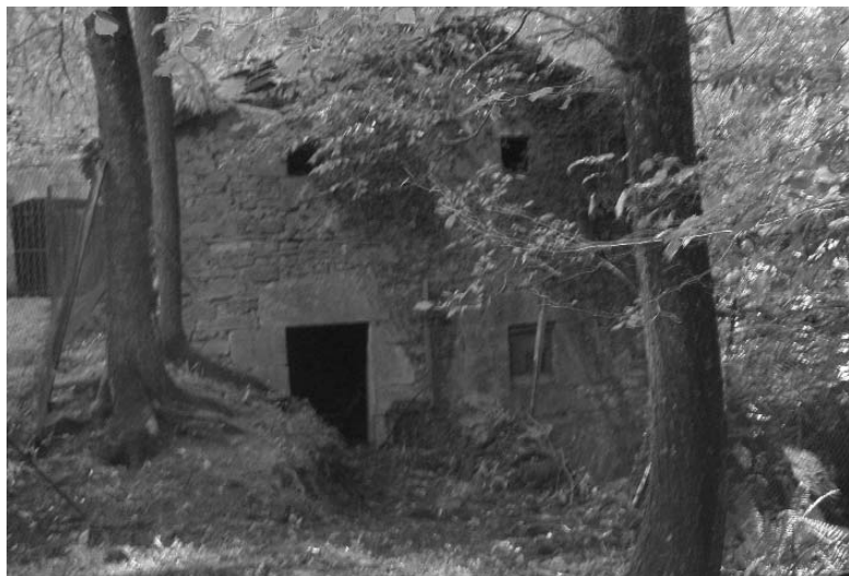
Ollokoko errota-etxea. Eskuinean, erreka ondoan, turtukiaren kokapena eta arkua (Iztueta, 2010)

dean kokatua zegoen beherako bidean, Urtoko gainera doan lehengo bide zaharretik joanda, plazatik 300 metrotararedo. Lauki-formako “Etxe-Berri” eraikin berriaren atarian hasten da hara garamatzen gurdi-bidea. Toki ezkutuan, eguzkiak sarbide gutxi duen Izotzaldeko zokogunerik laiotzenezan aurkitzen da sagastiz inguratua. Oilategi batez hesitua dago egun. Deseginak baldin badaude ere barruko elementu gehienak, garai batean errota izan zeneko lehengo aztarna batzuk geratzen dira, halere, nola ehoketa-lekuko goiko eraikinean hala honi erantsirik dagoen beheko turtukiarenean bere harrizko arkuarekin. Presa eta erreka-ingurua sasiak hartuta dauzka. Badirudi bi turtukirekin egiten zuela lan.