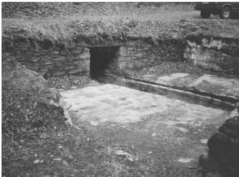
Ikaztegia, plaka birakaria kokaturik egon zeneko plataforma laukia bistan dela (Iztueta, 2010)

Era berean, bazen egitura txiki bat trenbidez ekarritako ikatza labeetara igotzeko ere, minerala kargatzeko lekutik hurbil zegoena, 43 metrora-edo. Ikaztegi hori zorua porlanean eta hormak harriz egindako gordailu karratu bat da. Alemaniarren garaian, ikatza handik kablez igotzen zuten gora motor-indarrez labeetara eramateko.