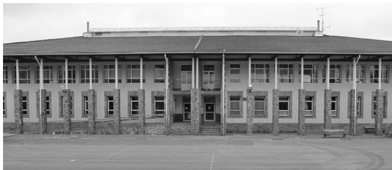
“J. A. Muñagorri” herri-ikastetxe berria