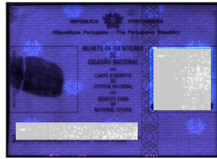
Figuras 5 y 6. La evidencia (figura 5) y un documento de identidad portugués auténtico (figura 6) observados bajo luz ultravioleta. Se ve como el soporte evidencia produce reacción blanquecina, y el del original no.