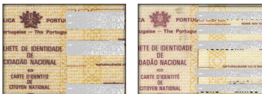
Figuras 3 y 4. Detalle de los fondos de la evidencia (figura 3) y de los del documento de identidad portugués auténtico (figura 4). No se aprecia nitidez en los fondos de la evidencia, al contrario que en el documento original.