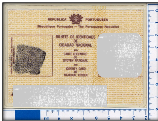
Figura 1. Anverso de la evidencia objeto de estudio del presente informe.

La evidencia presentada, objeto de análisis y de estudio de este informe pericial, es un Documento de Identidad de Portugal, encontrado en el interior de una cartera, en un establecimiento objeto de una inspección ocular técnico – policial por hurto. Se aprecia que se encuentra en buen estado, ya que no presenta roturas, manchas, ni marcas de ninguna clase.