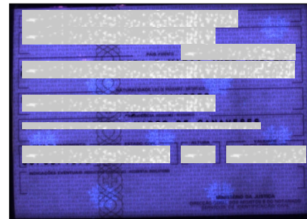
Figuras 7 y 8. La evidencia (figura 7) y un documento auténtico de identidad portugués (figura 8) vistos bajo luz ultravioleta. No se observan en la evidencia los escudos que aparecen en el documento auténtico.