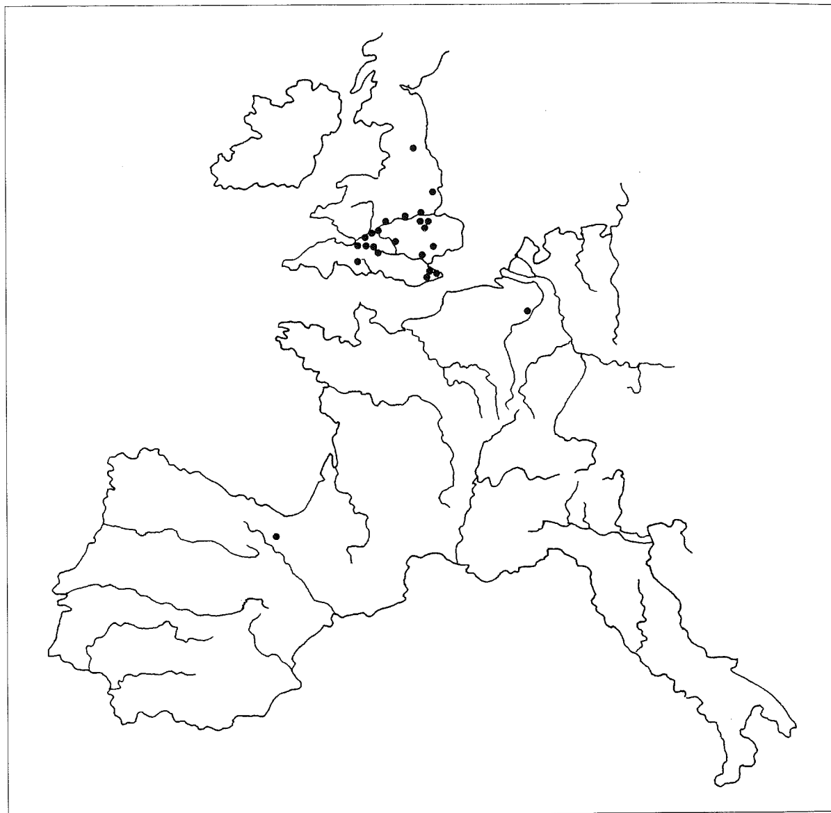
FIGURA 2. Mapa con la dispersión de las hebillas con cabezas de équidos, de origen británico.

broche de Westerwanna se interpreta como perteneciente a un mercenario sajón, que habría traído la pieza a su patria tras servir en el ejército romano (Böhme, 1986, 508). Entre los paralelos cercanos a nuestro ejemplar cabría citar las hebillas de Tripontium, Mucking, Wycomn (Böhme, 1986, fig. 27, 1, 7 y 16), Alwalton y Richborough (Chadwick, 1961, fig. 15, a y f).