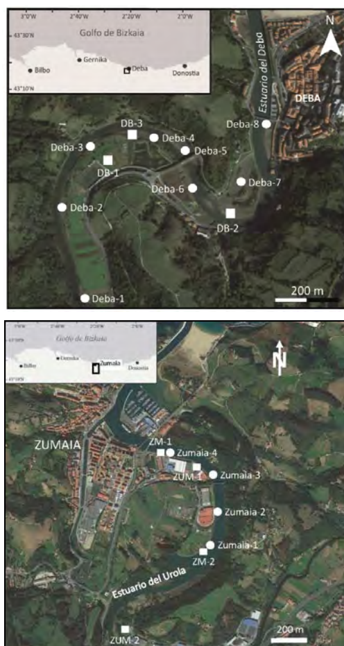
Fig. 1: Localización de los sondeos (cuadrados) y las muestras superficiales (círculos) analizados en los estuarios del Deba (arriba) y del Urola (abajo).

total de 300 caparazones, o en su defecto todos los caparazones presentes, que fueron clasificados taxonómicamente siguiendo la normativa de Loeblich y Tappan (1988) y actualizada en Worms (última entrada 5 mayo 2019).