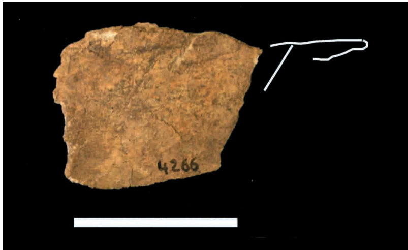
FIGURA 3. Fragmento óseo con decoración figurativa pintada (Nivel 18c). (Escala 3 cm.).