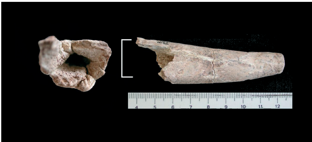
FIGURA 5. Candil de ciervo ( Cervus elaphus ) recortado y vaciado (Nivel 18b).

El otro objeto confeccionado en asta de Cervus elaphus se ha definido como un mango siguiendo la sistematización de H. Camps-Fabrer y D. Ramseyer (1993) (Fig. 1. 5). Se trata de un candil recortado y posteriormente vaciado en su tejido esponjoso para configurar una cavidad interna (Fig. 5). En la parte distal se ha procedido al recorte del extremo apuntado del candil previamente al vaciado del interior y a la regularización del contorno mediante un pulido que enmascara las huellas del seccionamiento de la punta.