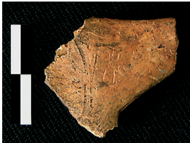
FIGURA 4. Fragmento de hueso hioides con figuración grabada y pintada (Nivel 18b).

El fragmento de hioides, por su parte, es de dimensiones similares al anterior (27×24×4 mm.) y acoge sobre su cara superior un motivo ejecutado mediante trazos grabados y pintado en su interior. La pieza se encuentra fracturada en la rama descendente del hioides así como en ambos extremos de la zona distal, afectando dichas fracturas al desarrollo de la figuración (Cabrera, V. et al 2001, Tejero, J. M. et al. 2005).