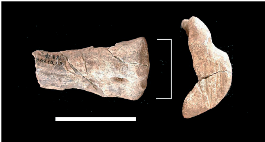
FIGURA 2. Fragmento de metacarpo de cérvido ( Cervus elaphus ) con incisiones en la zona epifisaria (Nivel 18b). (Escala 5 cm.).

Las representaciones interpretadas como figuraciones animales se disponen sobre un pequeño fragmento óseo aplanado —tal vez fragmento craneal— y sobre un fragmento proximal de hueso hioides posiblemente de Cervus elaphus . El primero de ellos, de 29×32×2 mm., muestra una serie de trazos pintados en su cara superior que configuran lo que ha sido interpretado como una cabeza animal orientada hacia uno de los bordes del hueso (Fig. 3). En el interior del trazo se han recogido muestras de pigmentos de origen natural. Los resultados de los análisis de estos pigmentos serán expuestos en futuras publicaciones.