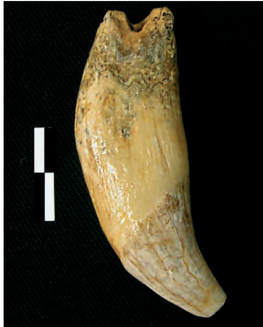
FIGURA 6. Canino de úrsido ( Ursus arctos ) con perforación en la zona de la raíz.