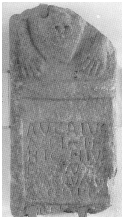
FIGURA 4. Inscripción de Coria, Cáceres. ILCoria nº 13