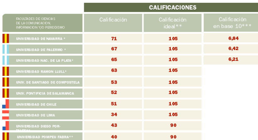
Cuadro 3. Calificación general de la observación de los 10 mejores productos, según los parámetros del modelo.