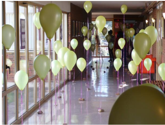
1 . Irudia * Puxikak- Instalazio artistikoa