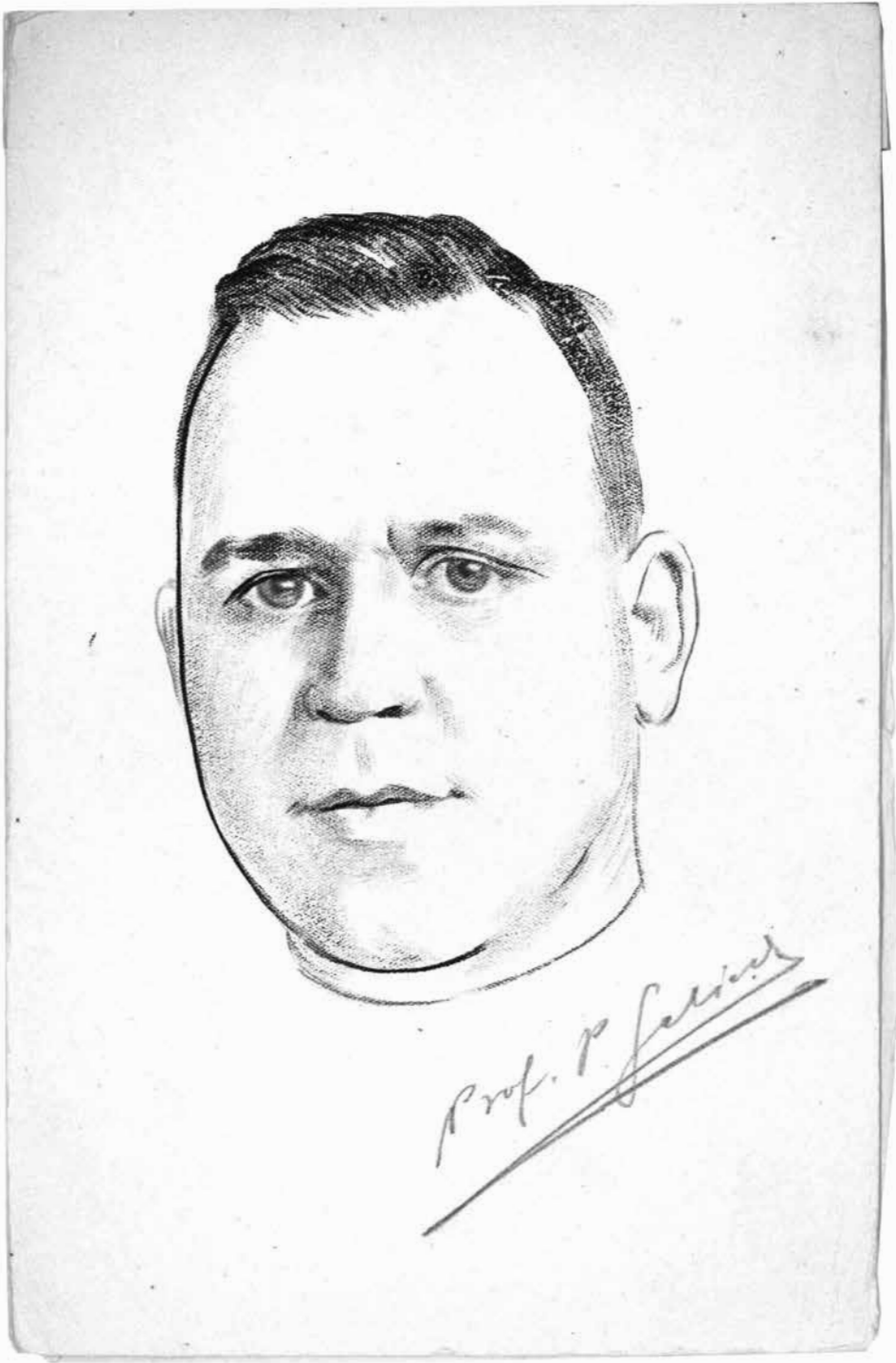
Fig. 3. Pascual Galindo, dibujo de Augusto Orlandi.