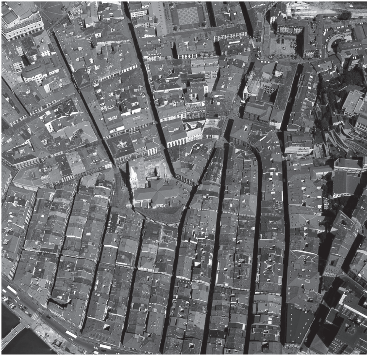
Ciudad compacta. Bilbao.

de los postulados ilustrados, modernos, son negados constantemente por la realidad.