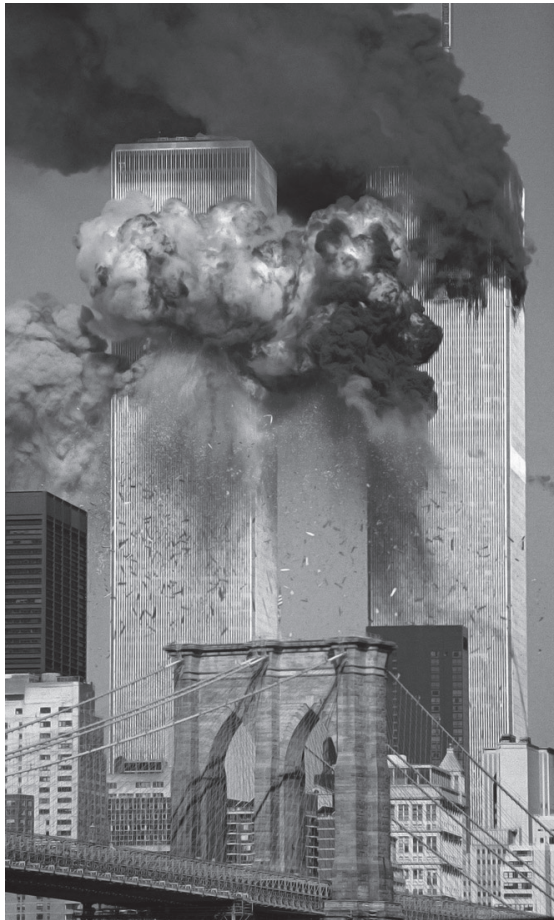
Torres gemelas. 11 de septiembre de 2001.

La emisión de gases de efecto invernadero, el calentamiento global, el deshielo de los casquetes polares, la desaparición sistemática de miles de especies cada día, la creciente desertización y la consiguiente escasez de agua, etc.