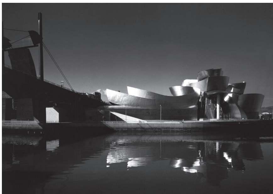
Museo Guggenheim Bilbao.

El cambio de siglo por todo ello aparece con todas estas circunstancias: Un delirio económico que ha permitido la realización de sorprendentes