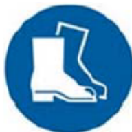
12. Figura. Símbolo de uso obligatorio de calzado de seguridad.