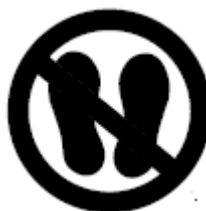
7. Figura. Símbolo de No pisar.