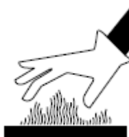
4. Figura. Símbolo de superficies calientes.