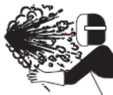
2. Figura. Símbolo de peligro por material fundido.