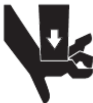
1. Figura. Símbolo de riesgo de aplastamiento.