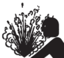
3. Figura. Símbolo de riesgo por presión elevada.