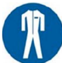
13. Figura. Símbolo de uso obligatorio de pantalones y camisa de manga larga de fibra natural no fundible.