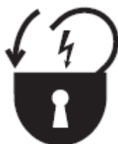
5. Figura. Símbolo de señalización de un bloqueo.