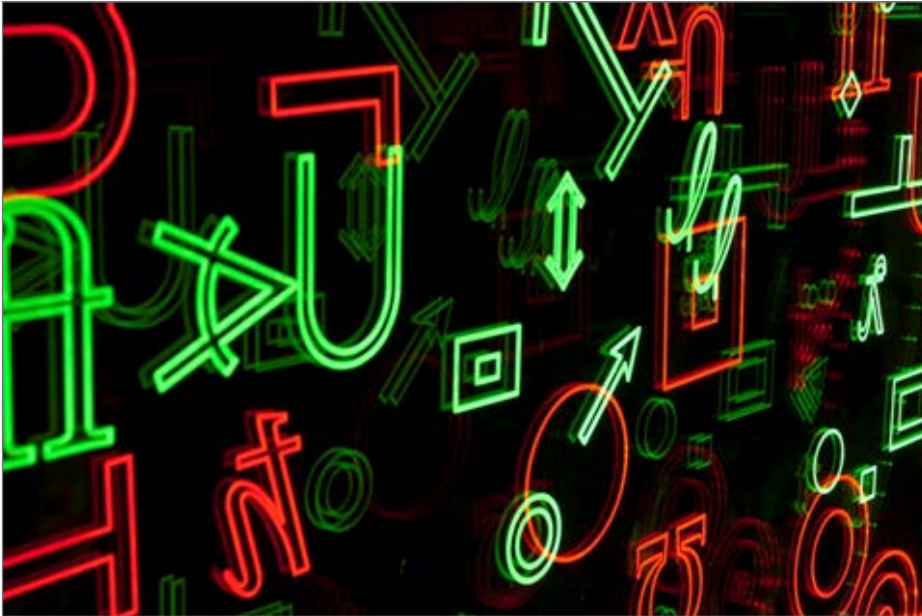
Fig. 2: Detalle de Your colour memory (2013), Eugènia Agustí y Antònia Vilà.