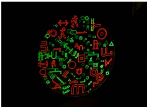
Fig. 1: Your colour memory (2013), Eugènia Agustí y Antònia Vilà. Dispositivo circular lumínico de metacrilato perfilado en hierro. Dimensiones: 137 cm de diámetro.

Your colour memory presenta un círculo transparente ideal que invade el espacio con caracteres gráficos. Estos signos de compresión y formalización geométrica traslucen la intersección discursiva de los agentes implicados en la investigación, y se hacen visibles gracias a la luz. La luz convierte en color una tinción invisible por la reactividad de un anticuerpo que reconoce una proteína. El color hace perceptible la enfermedad del tejido celular y a su vez, se sintetiza en la ilusión del círculo cromático, como las teorías que describen los colores refieren desde siglos.