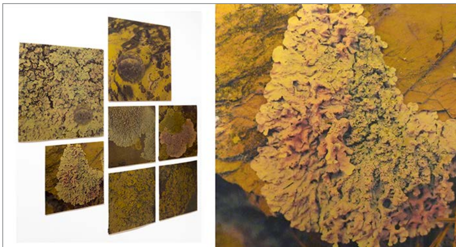
Fig. 4: Detalles de La pell de la pell (2014), Cristina Pastó. Planchas de fotopolímero de dimensiones variables.

Centro Cultural Aeronáutico del Prat del Llobregat, estructura viva que permite el crecimiento de ciertas familias de microalgas, hongos, líquenes y musgos.