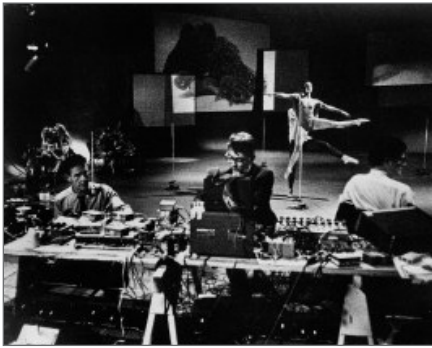
1966. John Cage y Merce Cunningham. Variations.

deslindada de los instrumentos musicales, abogando a su vez por la utilización del ruido en la composición musical. Esto significó que los futuristas estaban acercándose a cierto tipo de inventos que generaban diferentes sonidos, a los que se sumaron los experimentos del movimiento dadaísta en los que se utilizaba la palabra hablada acentuando su morfología fonética.