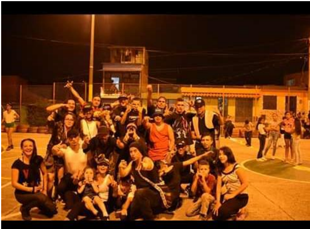
IMAGEN 5: Foto de raperos y asistentes al evento del rap organizado en el barrio el Refugio por Soundarte REC.