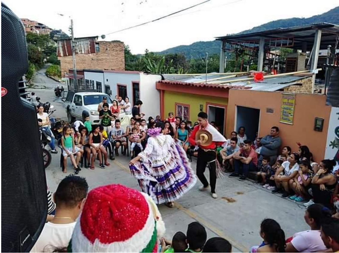
IMAGEN 6: Foto de jóvenes realizando bailes folclóricos en el evento Navirap.