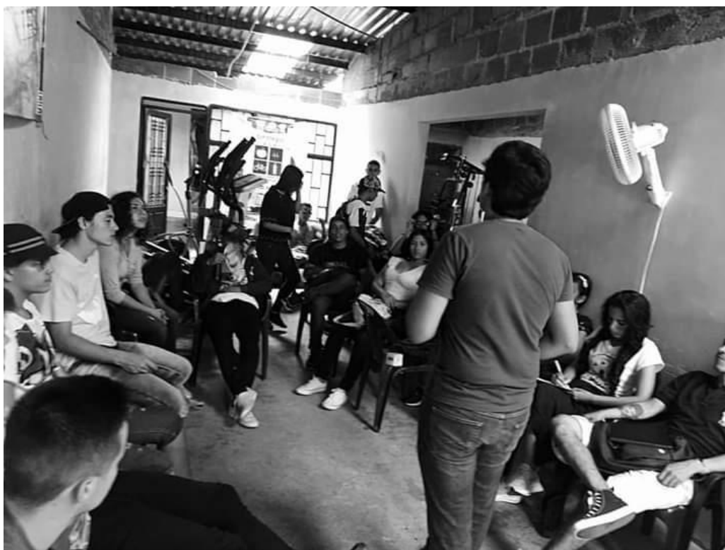
IMAGEN 2: Foto del taller de objetores de conciencia “No más jóvenes para la guerra”.