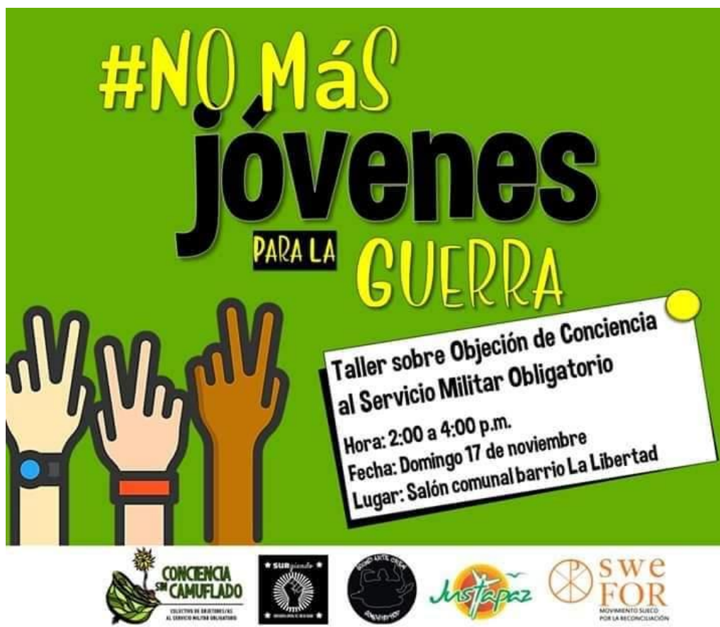
IMAGEN 1: Poster del evento de objetores de conciencia “No más jóvenes para la guerra”.