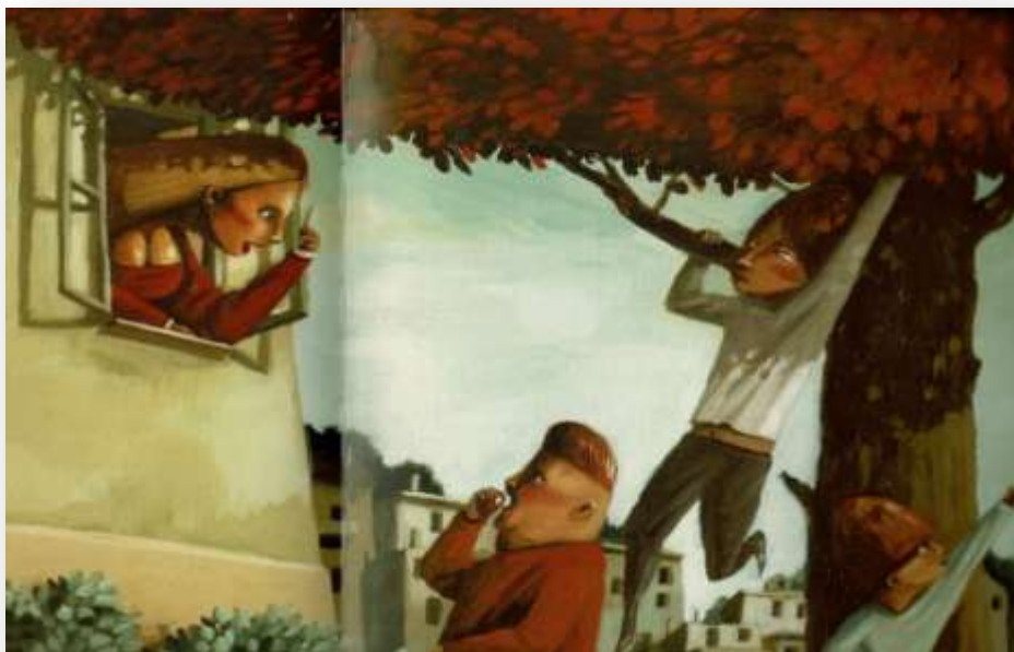
5. Irudia . Emakumea etxean. Sorgina Kirris Karras liburutik hartuta

Ondorioen atal hau amaitzeko, hirugarren eta azken hipotesia aztertu behar da. Bertan etxeko lanen eta zaintza familiarren presentzia berdintsuagoak izango zirela aipatzen da, hau da, lanak parekideagoak izango zirela. Atal honetako adierazlerik nabarmenenek adierazten dute hipotesi hori ez dela batere betetzen; etxeko lanak eta zaintza familiarra emakumeen gainean erortzen da guztiz (lehenengoa, irakurritako liburuetan %72tan emakumeak agertzen dira eta bigarren adierazlean, %67tan azaltzen da).