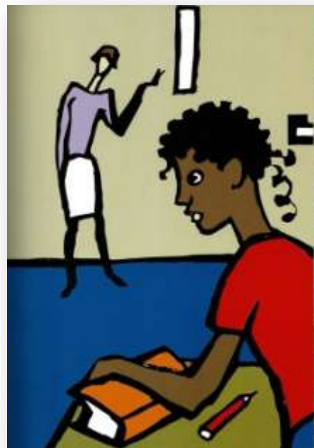
4. Irudia. Irakaslea. Usoa, hegan etorritako neskatosa liburutik hartuta