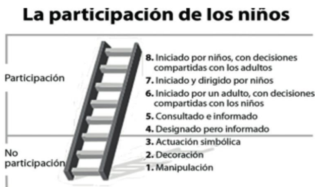
2. Irudia: Haurren parte-hartze mailaren eskailera. (Hart, 1992).

Azken urteetan, parte-hartzea indartze aldera ahalegin ugari egin dira. Hala ere, Hart-ek uste du, helduok haurren parte-hartzearen manipulazioan erortzen garela eta diseinatzen ditugun prozesuetan haurren parte-hartzea ez dela benetan sustatzen. Nolabaiteko iruzurra eman daitekela esaten du eta horretarako, “Parte-hartzearen eskailera” aurkezten digu. Eskaileran gora egiten dugun heinean (lehenengo hiru mailetan “parte-hartze ezaz” ari da), parte hartzea errealagoa da: