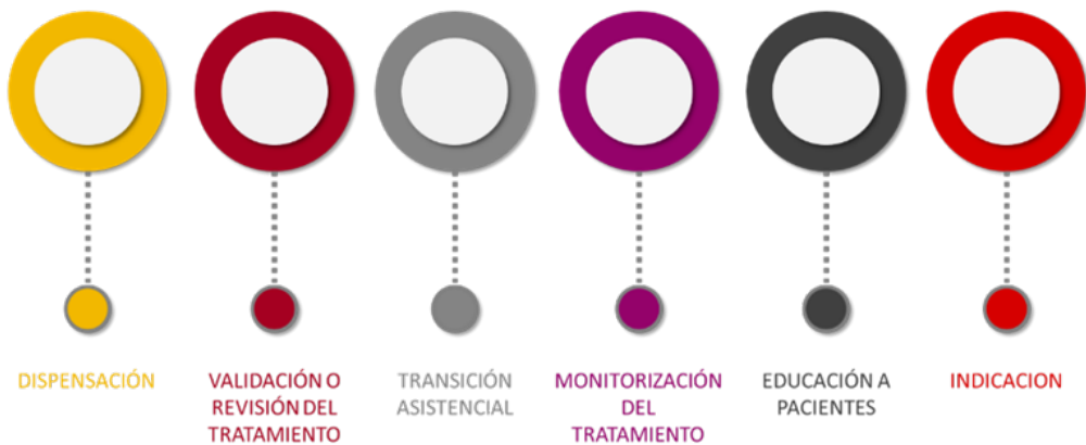
Figura 3. Clasificación de los puntos críticos de la cadena terapéutica en la farmacia comunitaria.

Con los resultados de la revisión, la clasificación propuesta por Ruiz Jarabo-2000 adaptada a la farmacia comunitaria contendría 6 puntos críticos en la cadena terapéutica (Figura 3).