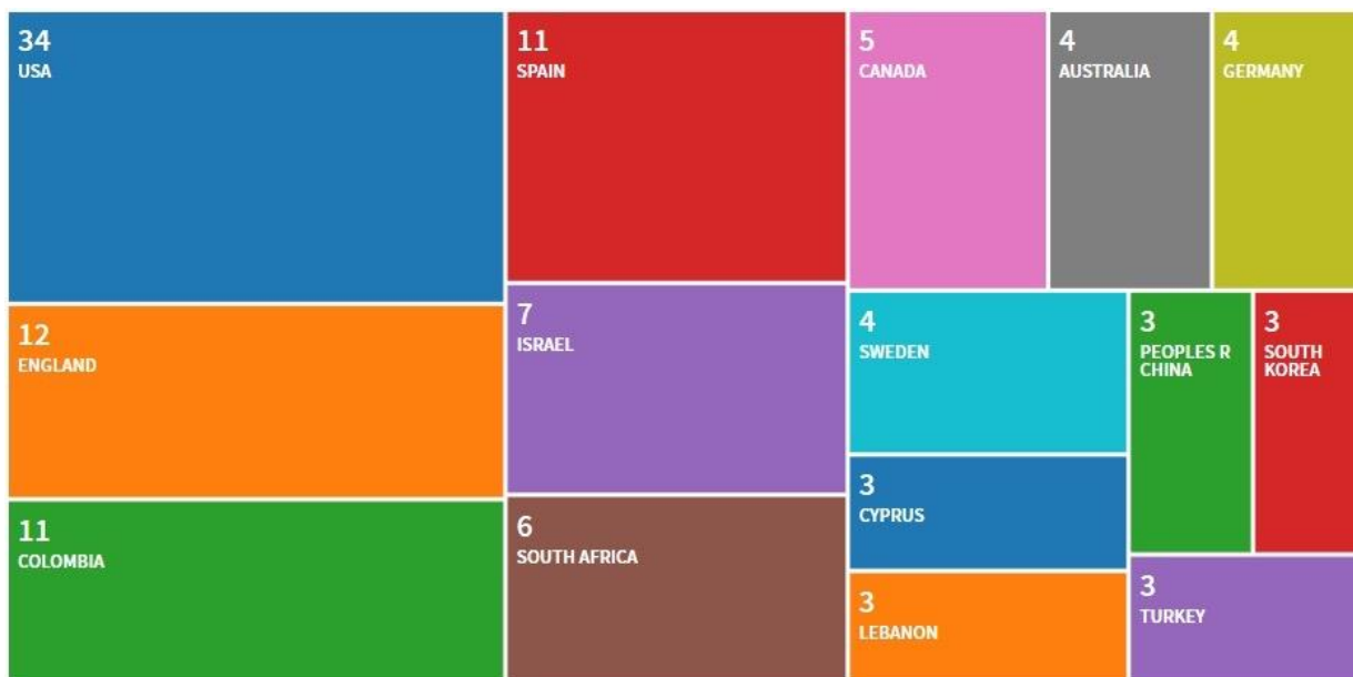
Figura 1. Principales frecuencias de publicación según los países a los que se adscriben los/las autores/as.

Estos datos se relacionan con la procedencia de los/las autores/as. Como se puede ver en el Figura 1, el mayor número de publicaciones se ha realizado por personal adscrito a instituciones de Estados Unidos; seguido de Inglaterra; Colombia y España; y en menor medida, Israel; Sudáfrica; Canadá; Australia, Alemania y Suecia; Chipre, Líbano, China, Corea del Sur y Turquía. Otros países que presentan autoría son Chile, Indonesia, Irlanda, Kosovo, Irlanda, Noruega y Nueva Zelanda, que cuentan con 2 publicaciones; y otra serie de lugares mínimamente representados como Argentina, Bélgica, Bosnia-Herzegovina, Brasil, Costa Rica, Dinamarca, Estonia, Finlandia, Francia, Irán, Irak, Japón, Kenia, México, Irlanda del Norte, Perú, Portugal, Escocia, Suiza, Taiwán o Tanzania.