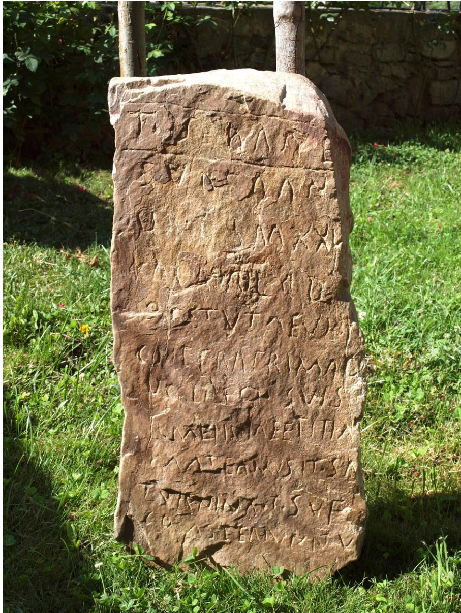
FIGURA 3. Santa Cecilia 1.

rrando parcialmente el texto. Sus dimensiones actuales son (73) \times (35) \times 10 cm. El texto se reparte en 11 líneas, burdamente incisas sin ayuda de interlineado, lo que resulta en renglones torcidos, interlineado irregular y letras capitales incisas de modo descuidado y cuyo tamaño disminuye a medida que avanza el epitafio, de tal modo que el primer renglón, resaltado por dos líneas incisas horizontales, mide 4 cm y las del último, 2,2 cm. Nótese que algunas letras presentan formas cursivas con otras regulares; eso sucede con la R, cuyo trazo cursivo puede confundirse fácilmente con la A, que se representa sin brazo; la S combina formas con las adecuadas curvas con otras más aplanadas.