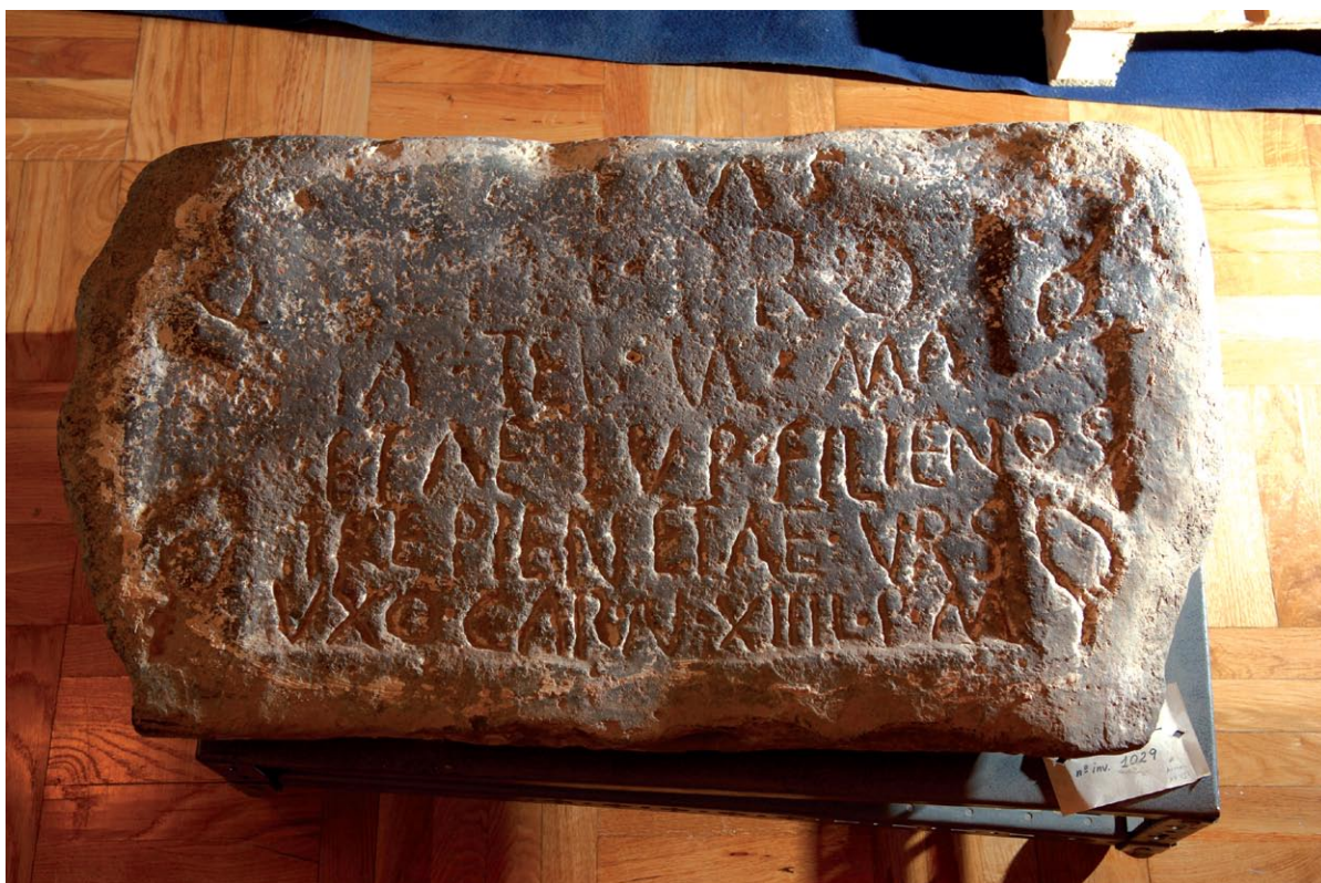
FIGURA 4. Santa Cecilia 2 .

Bloque rectangular de arenisca oscura de 52 × 91 × 11 cm. A diferencia de la pieza anterior esta tiene pulida la cara inscrita, su estado de conservación es medianamente bueno, salvo por el gran desgaste que afecta al borde superior y que hace sospechar que se usó de umbral o peldaño. Ocupando toda la cara grabada se aprecia el contorno de una tabula ansata levemente hundida y que ha perdido el lado superior por la erosión citada. Esa cartela, cuyas asas están flanqueadas por sendas parejas de hojas lanceoladas, mide 45 × 60 cm y contiene seis líneas de texto inciso, escrito con letras capitales de factura rústica y de altura variable; en el primer renglón miden 5,2 cm, en el segundo 12,5 y las de los restantes van disminuyendo su altura hasta los 4,5 cm del renglón final. Nótese el excesivo uso de abreviaturas, algunas de las cuales no son transparentes, y el irregular empleo de la interpunción para separar sílabas. Mientras que estos rasgos se encuentran en otras inscripciones de la comarca, las proporciones del soporte y su labra hacen de esta lápida un unicum , porque el gusto prevalente se inclinaba más por los monumentos verticales y los característicos bustos y las escenas de animales como motivos decorativos.