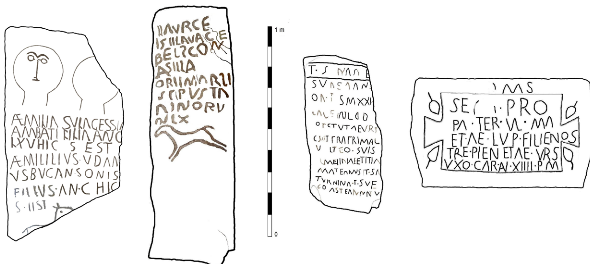
FIGURA 5. Villartoso 1 y 2, Santa Cecilia 1 y 2.

telas altoimperiales en las que nos vamos a centrar. Se trata de un conjunto muy uniforme en cuanto a tipología del monumento, decoraciones y fórmulas al que hemos calificado como taller (el taller de Tierras Altas), en el que aparece una particular onomástica con buenos ejemplos en las otras dos piezas que hemos presentado (Villartoso 1 y 2): Belscon , (-)aurce, Bugansonis (gen.), Sulagessia , Udanus .