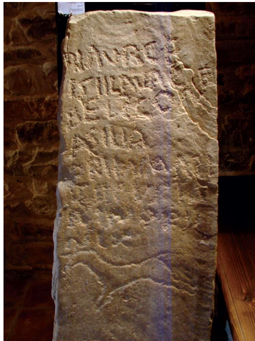
FIGURA 2. Villartoso 2 .

Estela funeraria sobre losa de arenisca, burdamente labrada y en la que no se corrigieron los defectos superficiales de la cara inscrita. Aun faltando el busto característico de estos epígrafes, parece que se conserva íntegro por arriba. También conserva su anchura original, aunque ambos costados tienen sus aristas desgastadas y en ocasiones melladas, sin que ello afecte al letrero; dimensiones actuales 122 × 44 × 10 cm. La estela consta de un doble registro, siendo el inferior la representación de un cuadrúpedo en carrera. El letrero se grabó sin guías adaptándose a las deficiencias de la piedra, como sucede en las ll. 2 y 3, donde las dos últimas letras se grabaron en la amplia exfoliación de la esquina superior derecha. Se usó el repicado para grabar las letras, que son capitales de factura y tamaño irregular (7-4 cm), y que en algunos casos mezclan aleatoriamente formas cursivas con las ordinarias (E) o invierten su trazo (S).