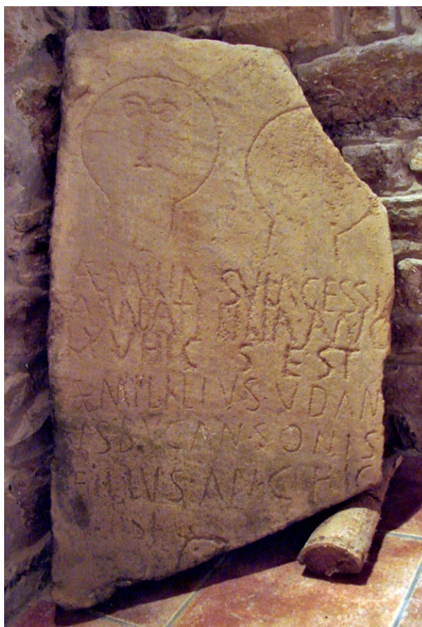
FIGURA 1. Villartoso 1.

Ambos compartieron el gentilicio, que es uno de los más corrientes en la comarca y cuya expresión plenis verbis no obvia el compendio de las dos primeras letras. Pero el gentilicio y el patronímico de la mujer es lo único vulgar que tiene la onomástica de ambos individuos; los restantes nombres son excepcionales y carecen de paralelos conocidos, tanto en la zona del hallazgo como en el resto de Hispania y en las demás provincias del Imperio. Udanus puede ser una variante sorda de un poco corriente nomen gentile Utanius , que usaron unos pocos individuos de Roma y sus alrededores. Los sufijos finales de Sulagessia y Bugansonis , ajenos al ámbito indoeuropeo, están atestados en Tierras Altas, en otros pocos lugares del valle del Ebro y de forma más corriente en Aquitania, y se asocian corrientemente con sustratos ibéricos o protovascónicos 2 .