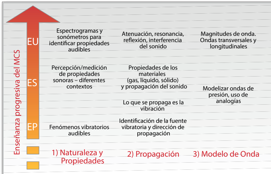
Fig. 2. Esquema de dificultades de aprendizaje y progresión en el MCS por etapa educativa.