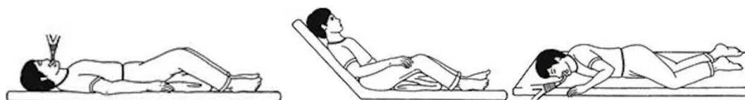
Imagen 1: Posición supina, semisentada (30-45°) y rotación lateral, respectivamente. 33

La fisiopatología y el tratamiento de esta enfermedad severa han sido campos ampliamente estudiados por los investigadores y parece claro que es necesario tomar medidas para evitar su aparición. Sin embargo, no existe una estrategia clara de prevención. 8,12 Siguiendo por este camino, algunos estudios 2,8,10,11 dedicados a la prevención de la NAVM se han enfocado fundamentalmente en los mecanismos de infección de los microorganismos. Las últimas guías y ensayos internacionales recomiendan la posición semisentada para disminuir el riesgo de NAVM debido a una menor aspiración de contenido gástrico. 1,15,16 Por el contrario, algunas investigaciones, evidencian la entrada de los patógenos en el tracto respiratorio inferior ayudándose de la gravedad. Por ello, teóricamente una posición lateral ayudaría a evitar la aspiración de patógenos y con ello la NAVM. 1 Sin embargo, no se tiene la evidencia suficiente sobre la eficacia de estas técnicas para recomendar su utilización en la práctica clínica. Varios estudios coinciden en que la posición supina aumenta el riesgo de desarrollar una NAVM. 7,16,17 Hay que destacar que la implementación de medidas de prevención se asocia a una disminución significativa de la incidencia de la NAVM. 8,10,18