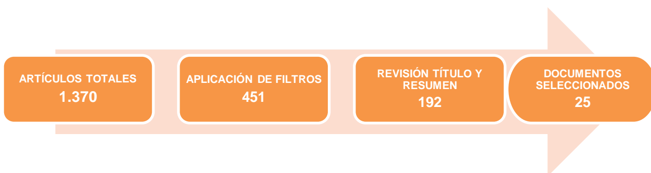
Figura 1: diagrama de selección de artículos. Elaboración propia

Tras realizar la primera búsqueda el resultado fue de 1.370 artículos en total. Tras la aplicación de los filtros señalados anteriormente, dicho número quedó reducido a 451. Posteriormente se procedió a eliminar duplicados y tras efectuar una revisión de título y resumen el número de artículos de quedó reducida a 192. En función de la relevancia de los artículos y para dar respuesta a los objetivos propuestos se seleccionaron un total de 25 documentos ( Tabla 4 y figura 1 ).