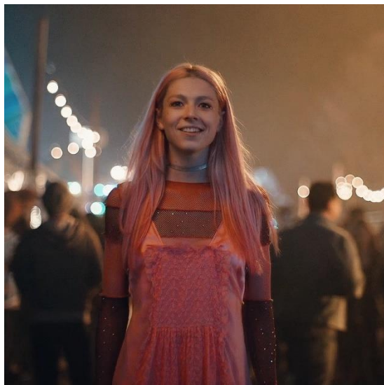
Imagen 2: Jules (Temporada 1)

la lleva a cometer actos que ponen en peligro al personaje. Jules tiene numerosos encuentros sexuales con hombres adultos que conoce a través de aplicaciones de citas ya que considera que, si es capaz de conquistar a los chicos, es capaz de conquistar la feminidad. Cuando está con ellos, la protagonista se muestra dulce, inocente e ingenua. En cuanto a su apariencia física, cabe mencionar que, en la primera temporada, la forma de vestir de Jules se caracteriza por el uso de prendas como faldas y vestidos que potencian su figura. Además, su apariencia física se ve potenciada a través de maquillajes extravagantes (imagen 2). Sin embargo, la segunda temporada tiene lugar cuando Jules regresa de Nueva York, dónde ha tenido lugar una evolución personal. La protagonista presenta un estilo más calmado e incluye en su vestimenta prendas como pantalones y tops que muestran menos su cuerpo (imagen 3). Este cambio puede entenderse como un punto de inflexión en el que Jules empieza a comprender que a pesar de ser una mujer trans, no necesita seguir una estética estrictamente femenina para reafirmar su identidad. En definitiva, el personaje parece darse cuenta de que la búsqueda de la feminidad estaba tornando en la hipersexualización de su propio cuerpo, y trata de remediarlo.