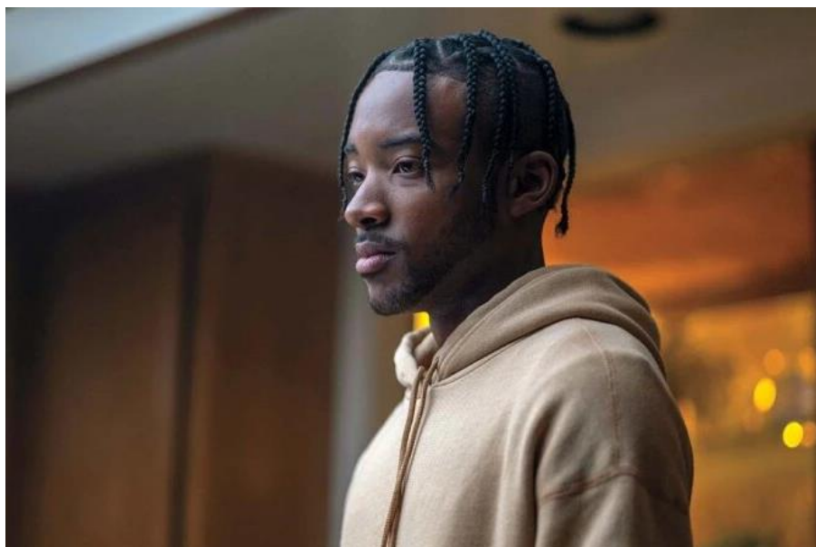
Imagen 16: Chris McKay