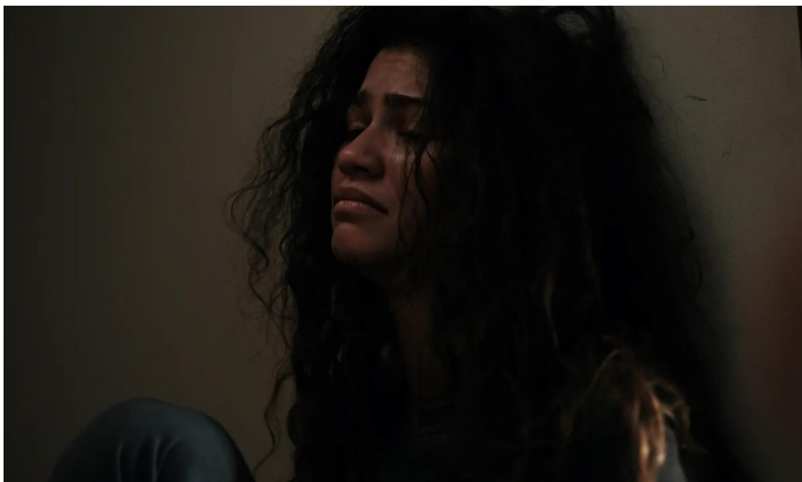
Imagen 10: Rue

narración, hasta la pérdida de amistades, el empeoramiento de su salud tanto física como mental, la pérdida de libido, las pérdidas de control y la entrada en el narcotráfico. En el caso de Elliot, no se presentan las consecuencias de una forma tan clara. Sin embargo, el consumo de sustancias nocivas nunca es representado como un acto que genere bienestar al personaje.