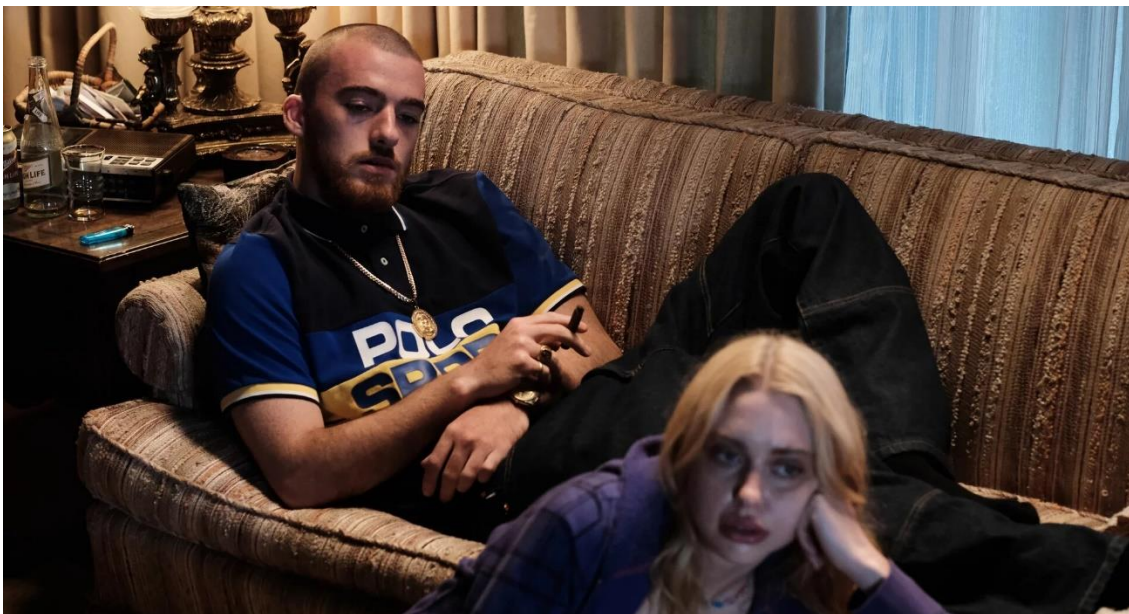
Imagen 1: Fezco y Faye

personajes que rompen con lo establecido y dan paso a nuevas formas de entender la feminidad y la masculinidad. Mientras Rue rompe con la feminidad hegemónica presentando una estética despreocupada y un carácter fuerte, decidido y ocasionalmente agresivo, personajes como Fez y Elliot rompen con la masculinidad hegemónica adoptando rasgos de personalidad que distan de la dominancia a la que suelen estar vinculados los personajes masculinos. Además, no muestran temor a abrirse emocionalmente y presentar vulnerabilidad. Asimismo, en el caso de Fezco, gran parte de la narración está basada en el cuidado de otras personas (imagen 1), una acción para la que es necesario contar con aptitudes generalmente ligadas a la feminidad como la implicación y la empatía.