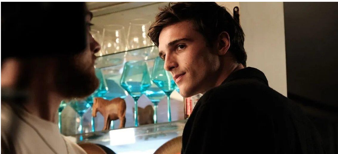
Imagen 6: Nate Jacobs

Capuzza y Spencer (2017) afirman que entre las personas LGBTQ+ hay ciertos segmentos que reciben más atención que otros, siendo el de los hombres cisgénero homosexuales el que más destaca. A pesar de que en Euphoria no haya un claro personaje que cumpla con dichas características, es preciso señalar el caso de Nate (imagen 6). Su orientación sexual es desconocida ya que de cara al público se define como un chico heterosexual, pero su forma de actuar cuando alguien cuestiona su sexualidad deja entrever que el personaje siente atracción hacia los hombres. Nate teme mostrarse abiertamente homosexual porque para él esto supondría la pérdida de masculinidad y una deshonra para su familia.