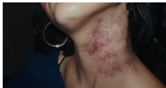
Imagen 8: Maddy