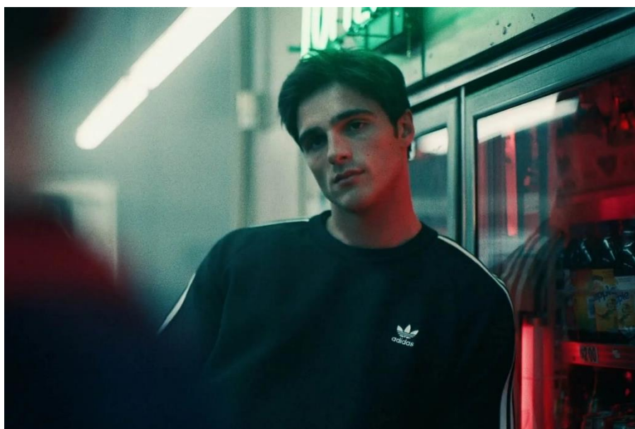
Imagen 17: Nate Jacobs

Nate es el hijo de Marsha y Cal Jacobs. El protagonista pertenece a una familia rica y conocida ya que su padre es propietario de gran parte de los apartamentos de la ciudad en la que transcurre la narración. Cuando Nate tiene 11 años, encuentra una colección de grabaciones en el despacho de su padre que contienen material explícito que él mismo ha grabado. En ellas se puede ver a Cal Jacobs mantener relaciones sexuales con hombres jóvenes y mujeres trans. El descubrimiento de estos vídeos afectará al desarrollo de Nate, quien, a los 12 años, mientras empieza un estricto programa de ejercicios para convertirse en el capitán del equipo de fútbol americano del East Highland High School y cumplir el sueño de su padre, desarrolla graves problemas de ira y una percepción distorsionada del sexo.