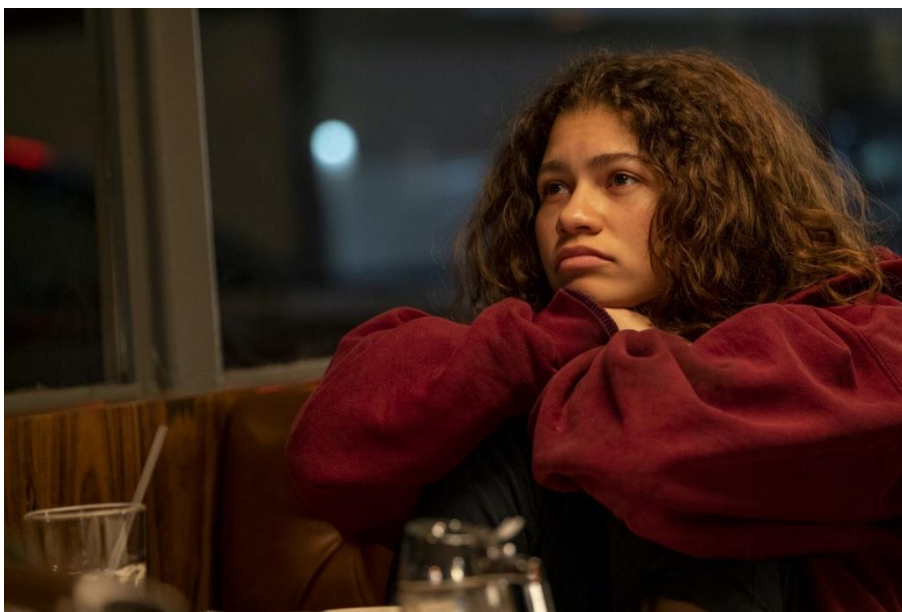
Imagen 11: Rue Bennett

En el primer capítulo de la serie, Rue cuenta que en su infancia fue diagnosticada con trastorno obsesivo-compulsivo, trastorno por déficit de atención e hiperactividad y trastorno de ansiedad generalizada. Lo que le conduciría a una incapacidad de concentración, ataques de ansiedad persistentes y episodios depresivos constantes. Cuando la protagonista tiene 11 años, su padre cae enfermo de cáncer y ella tiene que cuidar de él mientras su madre trabaja. A los 13 años, Rue prueba por primera vez uno de los medicamentos de su padre (el oxycontin) y experimenta una inhibición que le permite olvidar por momentos los síntomas de su mala salud mental. Esta práctica comienza a hacerse cada vez más habitual, pero no es hasta el momento de la muerte de su padre a los 13 años, cuando la protagonista se aferra por completo a las drogas como mecanismo de supervivencia. Los eventos que se narran en Euphoria transcurren dos meses después de que Rue sufriera una sobredosis.