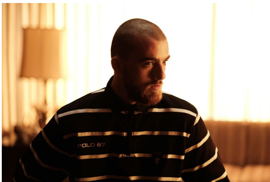
Imagen 14: Fezco

Hay dos hitos en su infancia que resultan especialmente relevantes ya que ayudan a conformar la personalidad de este personaje: la llegada de Ashtray (un niño que es abandonado por una clienta en casa de Marie) y el deterioro físico de su abuela (que provocará que Fez herede el negocio). Ambas situaciones sensibilizarán a Fez en un entorno marcado por la violencia y harán que adopte un papel de cuidador.