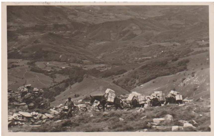
2.irudia: Kontrabandistak Bortzirietan XX. mendean.

Laburbilduz, XX. mendeko lehen erdialdeko kontrabandoa batez ere gerrek eta Francoren diktadurak sortutako eskaerari erantzuteko erabilia izan zen, batez ere janaria eta fundamentalak ziren bestelako produktuak eskuratzeko.