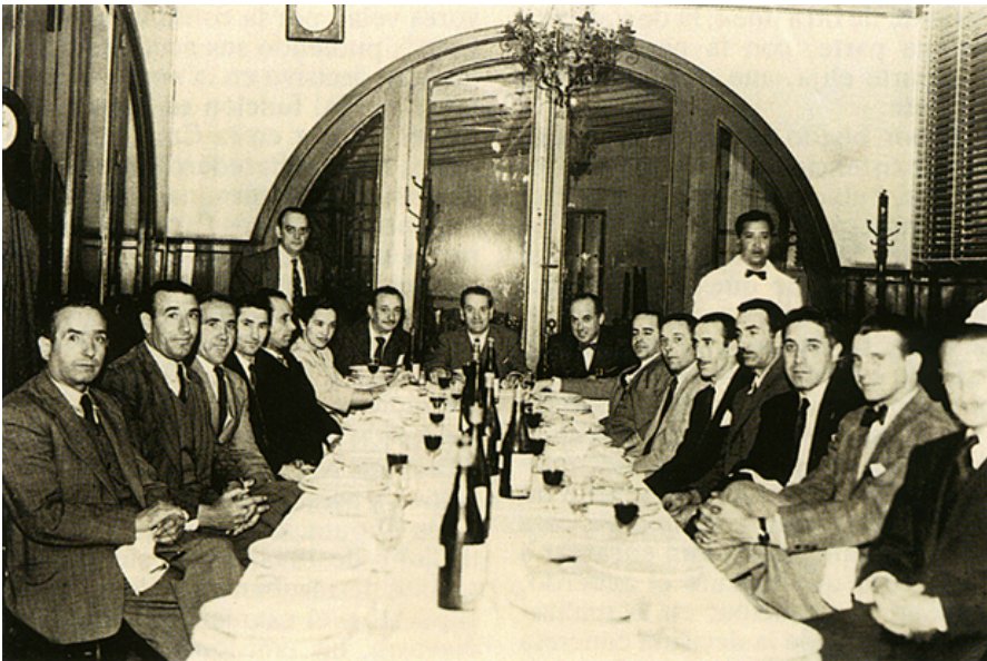
3. irudia: Nafarroako Kontseilua, 1945. Iturra: Gran Enciclopedia de Navarra.

Jakin gabe, baliteke Ospitalek aipatzen duen informazio sarea Nafarroako Kontseiluarena izatea. Talde hau 1945 urtean sortu zen Mexikon, Gerra Zibilean exiliatutako 7 nafar errepublikanoren inpulsuz. Talde honen Nafarroa Euskadin inkorporatzea zuen xede. Horretarako, bere egoitza Baionan finkatu zuen, 7tatik 3 bertara bizitzera joan zirenean. Baionatik Iruñeara eramaten zituzten informazioak, Nafarroako muga kontrabandisten laguntza erabiliz. Dena dela, 1953an desegin zen taldea, eraginkortasun eskasez (GRAN ENCICLOPEDIA DE NAVARRA: 2022).