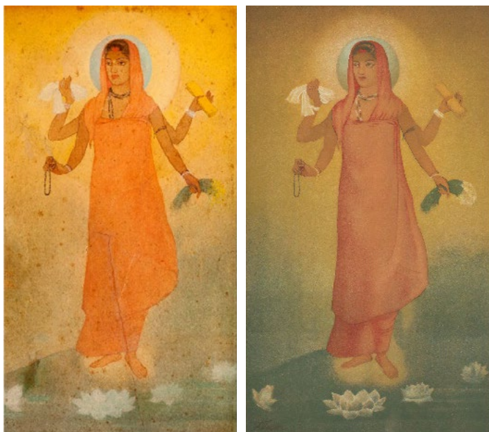
Figura 1. Abanindranath Tagore, Bhārat Mātā , Acuarela (1905), Rabindra Bharati Society / cromolitografía (ca. 1910), col. part.

El arte de India, tal como había empezado a ser estudiado sistemáticamente en la segunda mitad del siglo XIX por la historiografía británica, destacaba por sus referentes arquitectónicos y escultóricos, y escasamente por los ejemplos pictóricos.