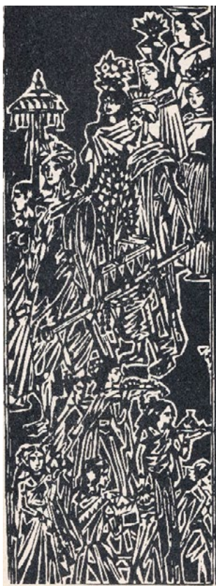
Figura 4. Nandalal Bose, Tree Planting ceremony , xilografía, 1928, National Gallery of Modern Art, New Delhi