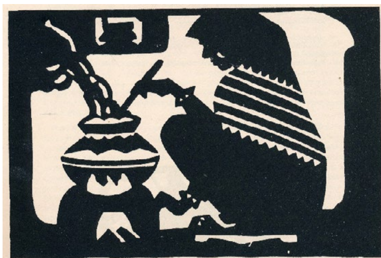
Figura 5. Nandalal Bose. Ilustración para el libro Sahajpath . Linograbado, 1930

Otra de las razones del vínculo plástico de las xilografías de Śāntiniketan con referentes coetáneos europeos deriva de la presencia de la artista francesa Andrée Karpelès, especialista en estampación en relieve, y que ayudó a impulsar el departamento de artes gráficas y los enfoques más artesanales en la escuela (Das 1983, 81-82; Román Aliste 2021a, 176-78). El ejemplo de Karpelès fue importante para la utilización de la estampación en relieve como medio de ilustración de libros en el contexto de Śāntiniketan (Figs. 5-6). No obstante, recientemente se ha sugerido que algunas de estas obras xilográficas podrían concordar con ejemplos ukiyo-e monocromáticos contemplados por Nandalal Bose en Japón en el año 1924 (Kini-Singh 2022, 355).