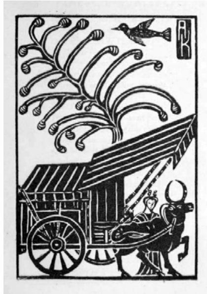
Figura 6. Andrée Karpelès. Ilustración xilográfica para el libro “Fables Chinoises du IIIe au VII-le siècle de notre ère (d’origine hindoue), 1921.