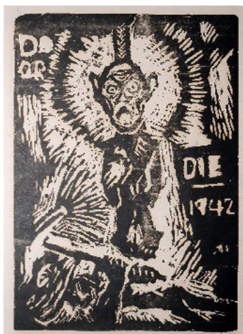
Figura 2. Ramkinkar Baij. Do or Die , xilografía, 1942, Delhi Art Gallery