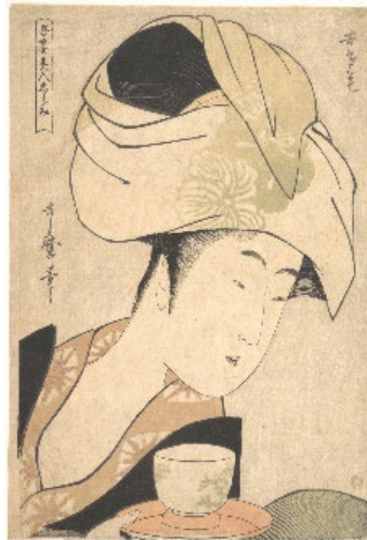
Figura 7. Kitagawa Utamaro, Sirvienta de la casa de té , ca. 1795, ukiyo-e, The Metropolitan Museum of Art, New York (public domain).

Sin embargo, si abordamos la perspectiva de la enseñanza del dibujo en la escuela de Sântiniketan, emerge una relación evidente y hasta el momento no clarificada con la estampa xilográfica japonesa, y es la que se observa en un conjunto de repertorios de formas faciales y gestuales,