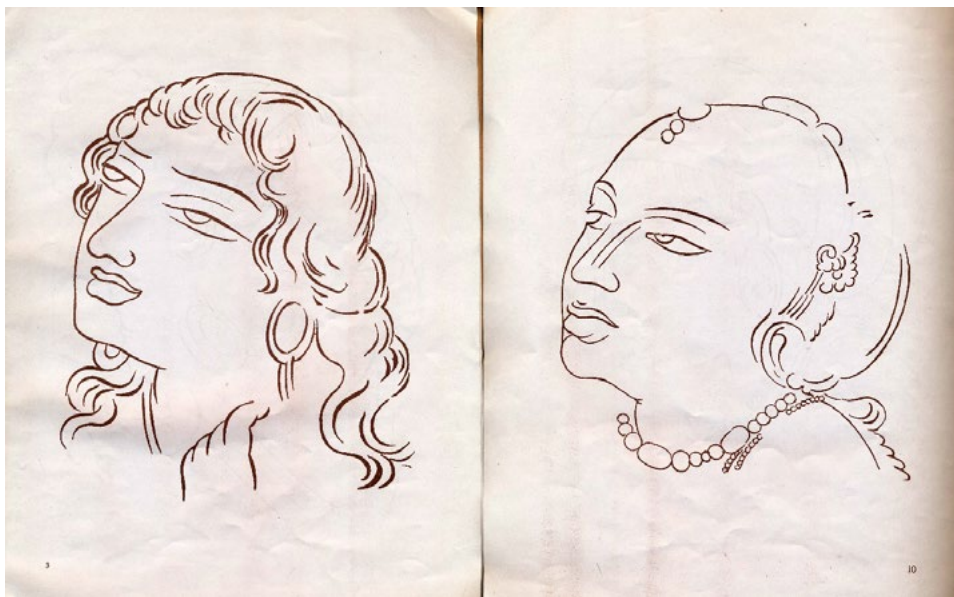
Figura 8. Nandalal Bose. Dos páginas del Rupavali (ed. 1953, Santiniketan, Visva-Bharati Publishing Department)

elaborados por Nandalal Bose para un propósito explícitamente pedagógico, y que deriva del protagonismo de la línea nítida, rítmica y aligerada de la técnica ukiyo-e (Fig. 7).