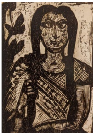
Figura 3. Benodebehari Mukherjee, Portrait of a Girl , xilografía, ca. 1944, National Gallery of Modern Art, New Delhi