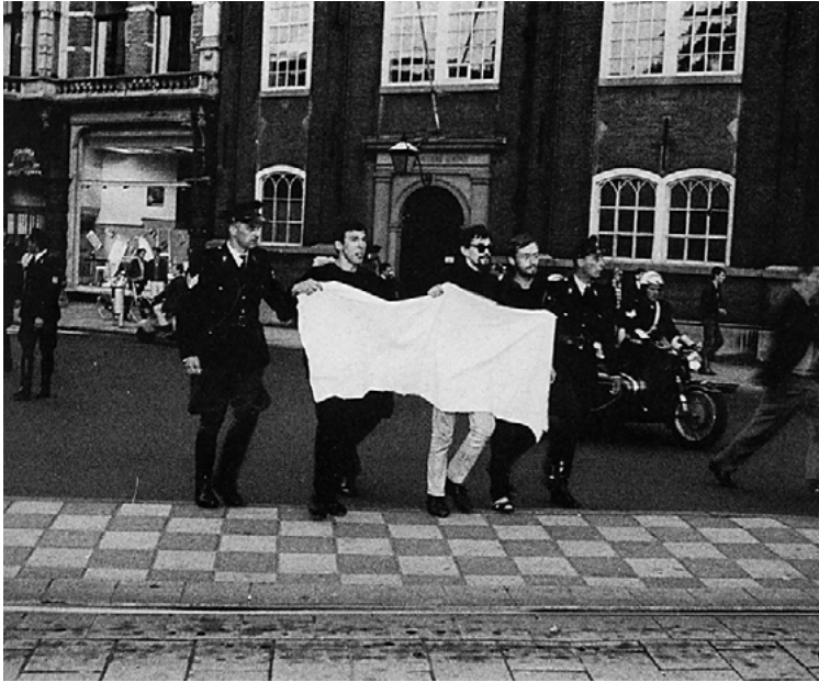
Fig. 5. Miembros de Provo portando una pancarta blanca, 1966.