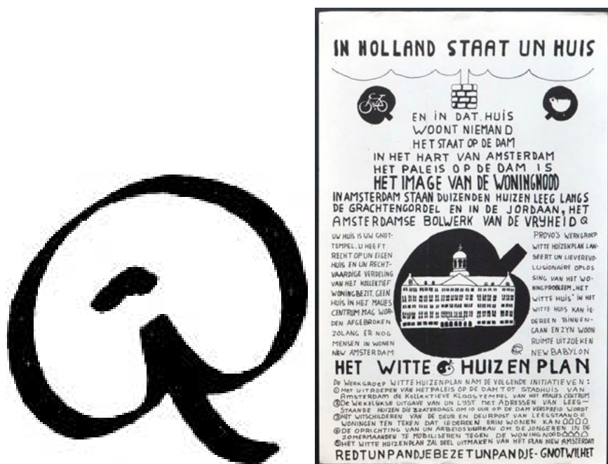
Fig. 2. La manzana dibujada por Robert Jasper Grootveld.

simboliza los canales, el tallo corto simboliza el río Amstel y el punto simboliza el Spui (la plaza donde tenían lugar los happenings). Desde 1965, el símbolo se convirtió en el logotipo no oficial del movimiento Provo, apareciendo con frecuencia en la imprenta y en las paredes. En cierto sentido, es el símbolo perfecto de Provo: un pequeño mapa psicogeográfico que asienta firmemente el movimiento Provo en el entorno material de Ámsterdam 2 .