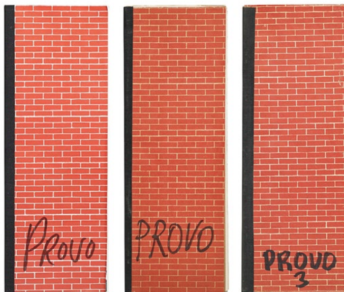
Fig. 1. Números del 1 al 3 de la revista Provo .

gráfico, ciertos elementos visuales quedarían indisolublemente ligados a Provo en el imaginario colectivo de Ámsterdam. Me refiero, por ejemplo, al uso recurrente de algunos colores, como el naranja y el blanco, pero también a la consolidación de ciertos símbolos, como la manzana; que se convirtieron en un sinónimo visual de la revuelta provotaria.