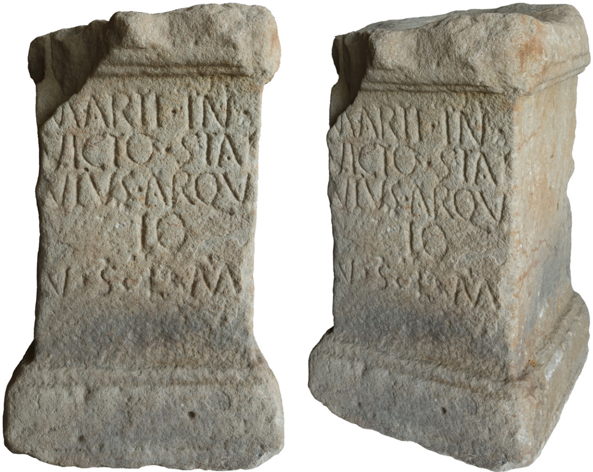
FIGURAS 2-3. Inscripción de Monteagudo.

No hay constancia de las circunstancias y el lugar exacto en el que fue descubierta la inscripción de Monteagudo. Se conoce desde mediados del siglo XIX, cuando fue donada a la recién creada Diputación Provincial de Navarra por el Marqués de San Adrián, lo que motivó su traslado a Pamplona, según recuerda E. Hübner ( apud CIL II 2990). Posteriormente formó parte de los fondos del Museo de Navarra, en cuyas salas estuvo expuesta hasta los años 80 del siglo pasado, momento a partir del cual se trasladó a los almacenes del Servicio de Patrimonio Histórico del Gobierno de Navarra, donde actualmente se conserva.