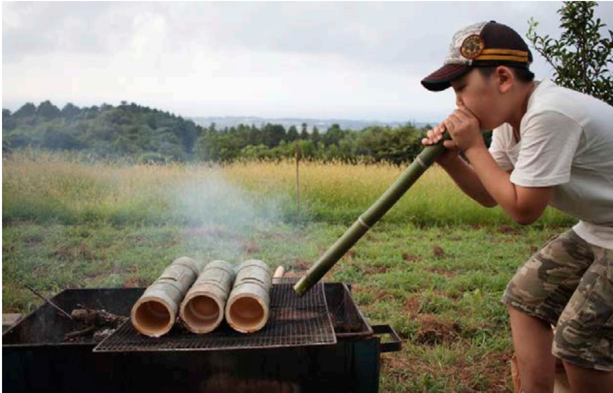
Actividades de GaGaGaGakkō

Hasta aquí, podríamos estar hablando de un centro cívico, que desde luego podría resultar fundamental como lugar de activación social de este entorno, pero no tenemos por qué comprenderlo como museo. Para empezar, podríamos preguntarnos cuál es su patrimonio y su colección. Y podríamos respondernos que lo primero que se ha mantenido y que se preserva gracias a Mabuya es un bello ejemplo de arquitectura tradicional histórica, que corría el riesgo de desaparecer. Pero no solo el edificio estaba en riesgo de desaparición; también lo estaba el conocimiento sobre el tratamiento de los materiales y las técnicas de construcción tradicionales, que gracias a este proyecto se han actualizado y transmitido, con cariño y respeto, a nuevas generaciones.