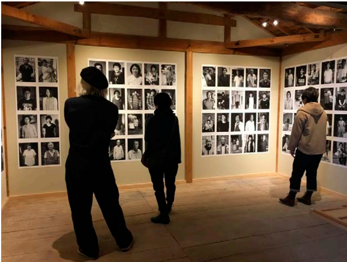
Exposiciones y conciertos en el Itonami Daisen Festival en Nagata, 2018