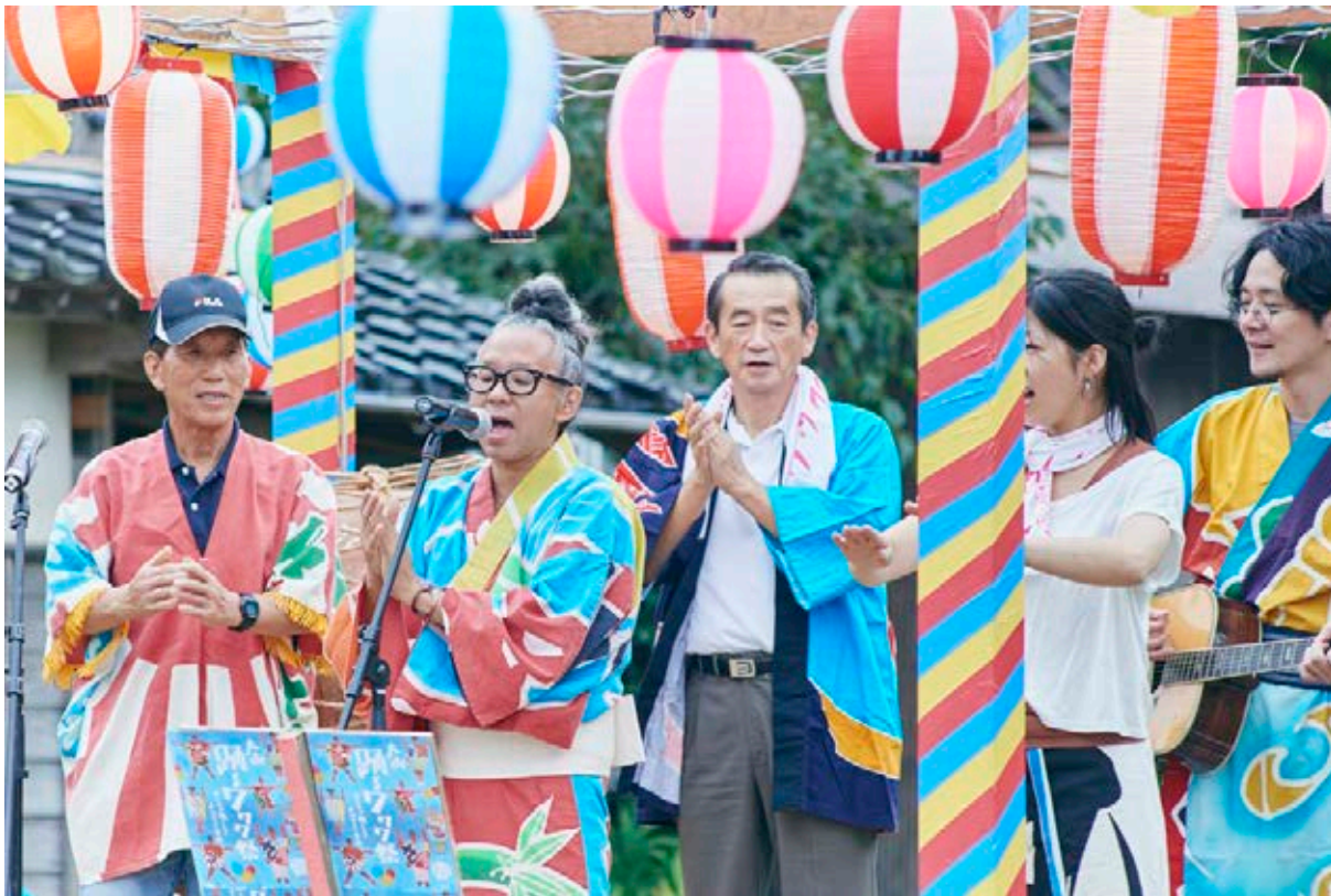
Daisen Ondō en el festival Wawawa

Nos encontramos, por lo tanto, ante un planteamiento muy unido al ecosistema, la historia y las tradiciones del valle, y con una importante vertiente creativa. Ofrece una actualización de conocimientos antiguos y no reglados, los hace convivir con otro tipo de saberes más sistematizados. A través de estas experiencias, se ponen en valor los diferentes saberes del lugar y se refuerza la idea de que constituyen un bien común y compartido, que no debe perderse, sino que debe cuidarse para poder transmitirlo a las próximas generaciones, y que incluso puede actualizarse. Junto con esta transmisión crítica, se refuerza el sentido de empoderamiento de varias personas mayores a las que, mediante la impartición de cursos, se hace sentir que sus conocimientos son válidos y necesarios, y que con ellos contribuyen a una vida mejor para toda la comunidad.