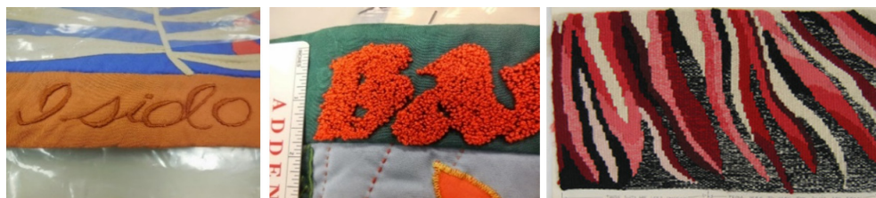
Figura 4. Detalles de diferentes técnicas aplicadas utilizadas en la obra The Dinner Party de Judy Chicago. Fig 4A y Fig 4B (Imágenes izda. y centro). Detalles de bordado y decoración con punch needle o punto ruso. Loomis, K (5 de enero 2015). International Honor Quilt project. [Mensaje en Blog Ragged Cloth Cafe, serving Art and Textiles ]. Imágenes recuperadas de https://raggedclothcafe.com/2015/01/ . Fig 4C (Imagen dcha.) Detalle de una muestra de tejido © Judy Chicago 1979. The Brooklyn Museum. Imagen recuperada de: https://bit.ly/30ck1H9

Entre los ejemplos más visuales de lo mencionado arriba, cabría citar la paradigmática obra de la artista feminista Judy Chicago, The Dinner Party . Aunque la autora no se considere artista textil, emplea aquí este medio “como un lenguaje con el que poder llevar a término la pieza” (De La Colina Tejada & Chinchón Espino, 2012, p.191). Producida desde 1974 hasta 1979, supone un despliegue de técnicas y materiales orgánicos e inorgánicos (Figura 4) que, en palabras del departamento de conservación del Brooklyn Museum (Brooklyn Museum, 2018) donde se conserva e investiga la obra en la actualidad, representa un gran reto para su conservación y exhibición permanente.