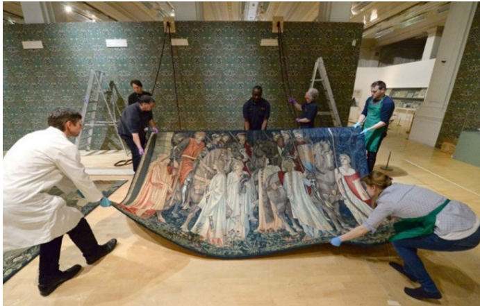
Figura 1. Montaje de un tapiz de Morris & Co (c.1907) para su exhibición en el Museo y Galería de Arte de Birmingham.

conocidos museos como el Victoria & Albert Museum de Londres o el Metropolitan Museum of Art de Nueva York, entre otros (Figura 1).