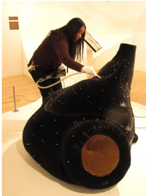
Figura 6. El terciopelo es especialmente proclive a acumular suciedad superficial por lo que requiere limpieza constante. Personal de conservación del Dallas Museum of Art microaspirando la obra de Dorothea Tanning “Pincushion to Serve as Fetish,” 1979. Terciopelo negro, madera metal, pintura y cobre. Collection of Deedie and Rusty Rose and the Dallas Museum of Art. Imagen recuperada de: Hanson, L. (2 de abril 2010). Pincushion. [Mensaje en Blog The Dallas Art Museum Family Blog ] Imagen recuperada de https://bit.ly/2XGvuRP

Se ha podido ver, asimismo, que las inusuales y variadas formas y tamaños con los que nos encontramos en esta disciplina, suponen un reto a la hora de exponer y almacenar este tipo de obras. Recuperamos, a este respecto, el término “ Imaginative Preventive Conservation ” acuñado por la conservadora textil Anne French (2010, p.289), ya que entendemos que estos aspectos de la conservación han de afrontarse de forma rigurosa pero también creativa, encontrando soluciones que beneficien su preservación, pero respeten la intencionalidad de las obras.