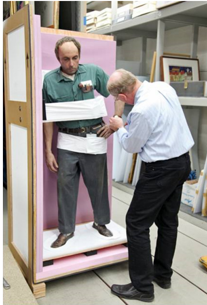
Figura 5. El conservador del Museo de Arte de Milwaukee embalando la obra “ El conserje ” de Duane Hanson para su transporte. (Buchanan, 2012).

de cada uno de los elementos y prendas del conjunto. Se evidencia que cada una de estas obras, a pesar de pertenecer a una misma tipología deben estudiarse y evaluarse individualmente 8 .