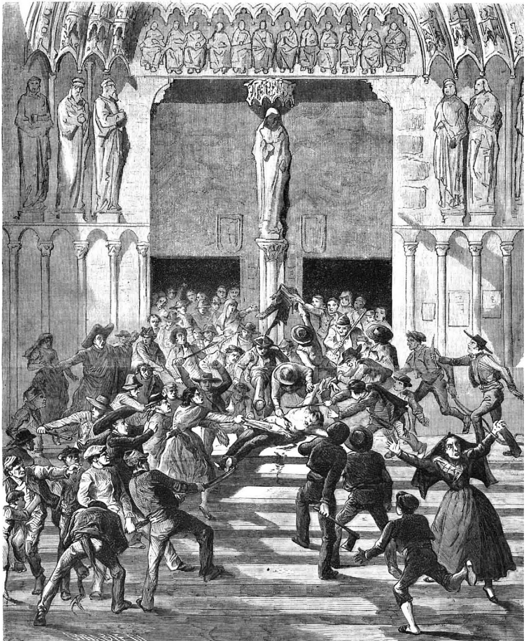
ESCEÑA DEL DRÁMA DE LA CATEDRAL DE BURGOS.

EL ASESINATO DEL GOBERNADOR GUTIERREZ DE CASTRO EN LA CATEDRAL DE BURGOS, 25 DE ENERO 1869. Fuente: URRABIETA, Vicente: «Escena del drama en la catedral de Burgos», El Museo universal , 25/02/1869, p. 4