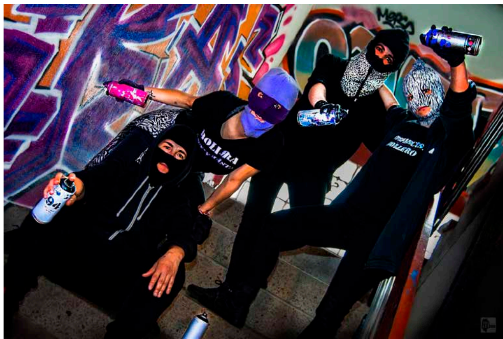
Figura 17. Bolloguerrilla St. en el EKO. Toxic Lesbian, 2022

Así, la comunidad bollera disidente madrileña es el caldo de cultivo para Bolloguerrilla St., que surge para ocupar la calle y la noche con sus gritos pintados en las paredes. Toxic Lesbian produce con ellos una sesión fotográfica (fig. 17) en el centro social okupado y autogestionado Eko, en el barrio de Carabanchel.