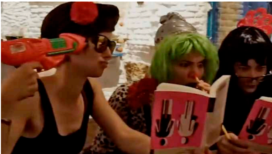
Figura 16. Frame de la acción colectiva organizada en un conocido bar madrileño por las Postpotorras para la grabación de un videoclip activista, 2018

En esta fase del proceso aparece por primera vez Bolloguerrilla St., con quienes en 2022 se va a realizar una creación como un solo. Su acción activista se inserta en el sentimiento de pertenencia al movimiento barrial y al apoyo a las mujeres y disidencias que lo habitan.