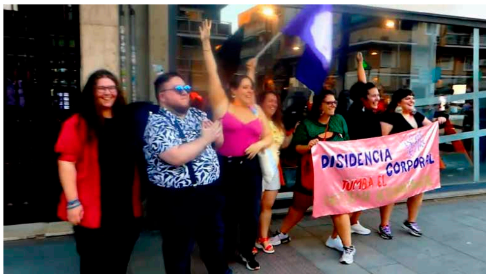
Figura 18. Participación del Bloque Gordeer en el Orgullo Crítico. Toxic Lesbian, 2022

En la sesión de construcción simbólica en el estudio, las activistas gordes viran desde el sometimiento hacia el humor y posan equiparadas a animales enormes (fig. 9) con plena dignidad; o igualmente en el exigente medio del 'estar en forma' (fig. 19). Fruto de estas metáforas, Toxic Lesbian crea varias series de imágenes de las que aquí se ofrecen algunas muestras.