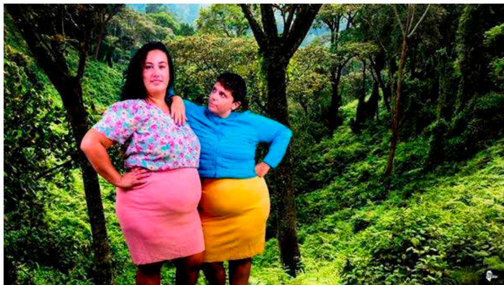
Figura 7. Las dos componentes de Nadie hablará de nosotras , podcast antigordofóbico. Toxic Lesbian, 2022-23

Este proyecto cristaliza en la medida en la que, como artista, Toxic Lesbian convive con estas comunidades. Foster (1996) enumera los requerimientos del artista como etnógrafo y describe que éste elige el 'sitio' donde desarrollarlo y es parte de su cultura para llevarlo a cabo. El focalizar la creación en la propia realidad, como indica Ardenne, es una característica de este arte contextual que prefiere un «arte anti-idealista, en el corazón mismo de lo concreto» ([2002] 2006, 14).