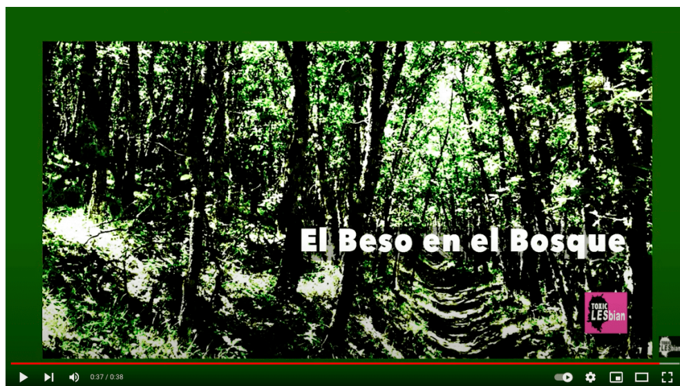
Figura 1. Presentación de la videoocreación El beso en el bosque con la que se inicia el proceso de creación comunitaria. Toxic Lesbian, 2019 https://www.youtube.com/watch?v=VhW-BL1Ac3U4&ab_channel=TOXICLESBIAN

Mostraremos cómo, precisamente y al tratarse de una producción artística desde las disidencias y a través de ellas, la ruptura con las metodologías tradicionales de creación, llevada a cabo históricamente hace ya varias décadas, camina por el territorio que aquí se expone. Esta es una obra de la autora de este artículo, con el doble papel de investigadora y artista visual, y empleando la denominación colectiva Toxic Lesbian desde 2005 con el objeto de anonimizar la autoría desde una perspectiva feminista (García-Oliveros 2016).