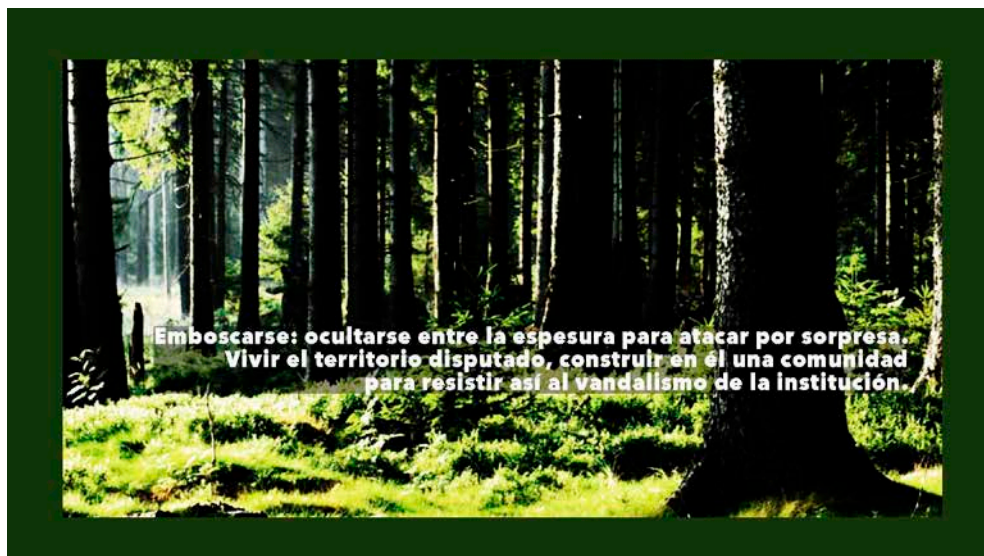
Figura 8. Una de las carátulas de presentación de las piezas audiovisuales de El beso en el bosque . Toxic Lesbian, 2019

Para exponer la complejidad sugerida en El beso en el bosque (fig. 8) es necesario una síntesis de la cotidianidad de esta realidad social, oculta habitualmente, lo que dificulta la comprensión de estas disidencias sociales. Se suscribe así la necesidad que apunta Rockwell (1985) acerca de documentar lo indocumentado. Los hitos de esta creación artística comunitaria son retratos de este tiempo y espacio: la proximidad artista-comunidad permite la sincronización con las ocasiones en las que estos activismos deciden intervenir en el espacio público y guardar registro visual, así como abrir el diálogo necesario para producir, con todo ello y como material de creación, una obra final fruto del proceso comunitario.