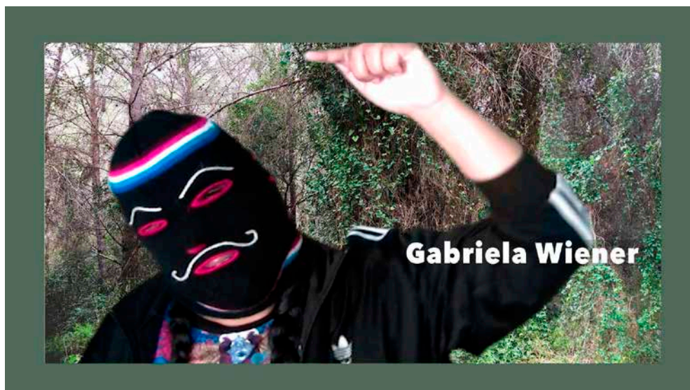
Figura 2. Retrato de una de las participantes en El beso en el bosque . Toxic Lesbian, 2019