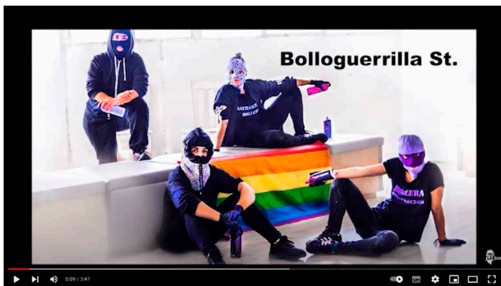
Figura 20. Videocreación producida para Bologuerrilla St., https://www.youtube.com/watch?v=dTOldDkRR6E&t=6s&ab_channel=TOXICLESBIAN . Toxic Lesbian, 2022

Sin embargo, y como hemos visto en las actitudes de resistencia de nuestros protagonistas, lejos de borrarlos, se hacen fuertes entre ellos, leyendo las diferencias de unos y otros y aceptando cada divergencia como parte de un manifiesto político y social común.