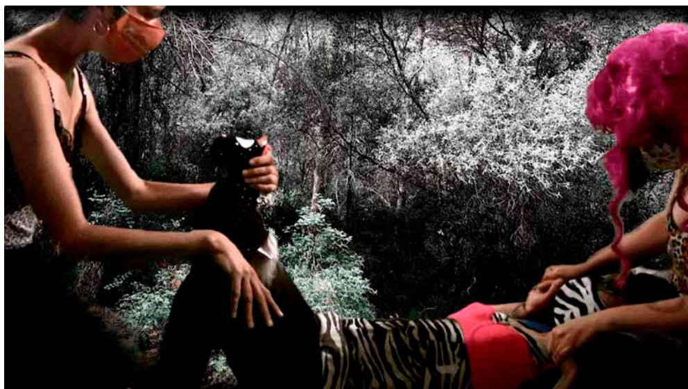
Figura 10. Escena de la performance de las Postpotorras en plató en la que dan a luz un unicornio como símbolo queer. Toxic Lesbian, 2021

Por otra parte, y referido a los contenidos de El beso en el bosque que profundizan en la identidad relacional de cada grupo participante, cabe señalar que para Almudena Hernando (2018, 28) el ser humano no puede prescindir de ésta para su desarrollo equilibrado. Es la identidad relacional la formulada, en la constitución de la estructura de la persona, a partir de la suma de sus características corporales (fig. 9), de lo que aporta la propia cultura material en la que está inserta referida al uso de objetos (fig. 10), de las acciones compartidas dentro de esa comunidad (fig. 11), y también de la adscripción a uno o varios espacios (fig. 12) así como de los vínculos establecidos dentro de la comunidad constituida (fig. 13). En las piezas creadas vemos así reflejados uno a uno estos aspectos para construir los retratos de les performers, de quienes vamos configurando su identidad en las imágenes a través de los factores antes mencionados.