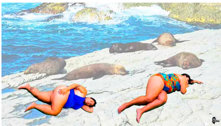
Figura 9. Las protagonistas del podcast antigordofóbico Nadie hablará de nosotras retratadas rodeadas de focas. Toxic Lesbian, 2022-2023

Y es este giro etnográfico clave para comprender la propuesta artística de Toxic Lesbian, puesto que, y como prosigue Foster, artistas que se transforman bajo estas coordenadas, recibirán un impulso al externalizarse la institución del arte más allá de las paredes del museo o de la galería, alentada por la presión que ejercerán los movimientos sociales disidentes, entre los que cita al racializado, homosexual o los feminismos, quienes apoyarán la derogación de las definiciones restrictivas de arte y artista (1996, 189). Precisamente, la producción de Toxic Lesbian es posible porque se desencadena en conexión con otras subjetividades en lugares más allá de los convencionales del llamado arte elevado. Ardenne explica cómo el museo o la galería «se ha convertido para muchos creadores en demasiado estrecho, demasiado circunscrito» ([2002] 2006,15) y deviene un obstáculo que empuja a ciertos artistas a abolir estas barreras.