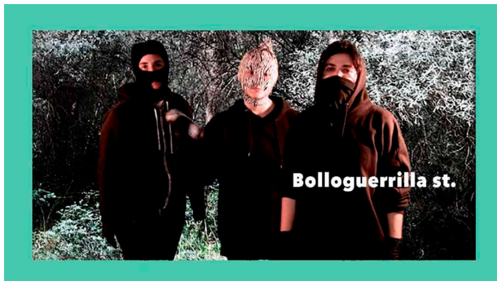
Figura 4. Activismo bollero transfeminista formando parte de las comunidades de El beso en el bosque . Toxic Lesbian, 2019

aportaciones son de especial valor documental y analítico para engrosar los estudios queer en el marco del arte, y dentro de éste, singularmente en tanto que se trata de prácticas sociales, menos sistematizadas desde los estudios académicos por ubicarse en otros paradigmas del sistema-arte convencional.