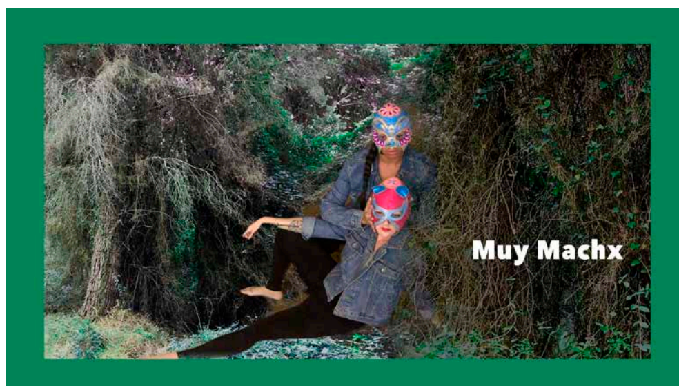
Figura 5. Les integrantes de Muy Machx. Toxic Lesbian, 2019

El grupo de performers que intervienen en este proyecto de Toxic Lesbian son destacadas activistas antirracistas (figs. 2 y 5), artistas urbanas bolleras (fig. 4), colectivos queer transfeministas (fig. 6) o de igual modo militantes antigordofobia (fig. 7). Confluyen en el paisaje disidente sexo-género-corporalidades-antirracista habitando espacios autogestionados y del entorno libertario.