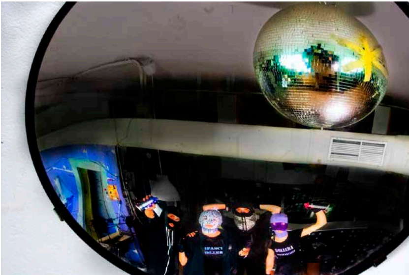
Figura 12. Sesión de fotografía con Bolloguerrilla St. en el centro social okupado EKO de Carabanchel, Madrid. Toxic Lesbian, 2022