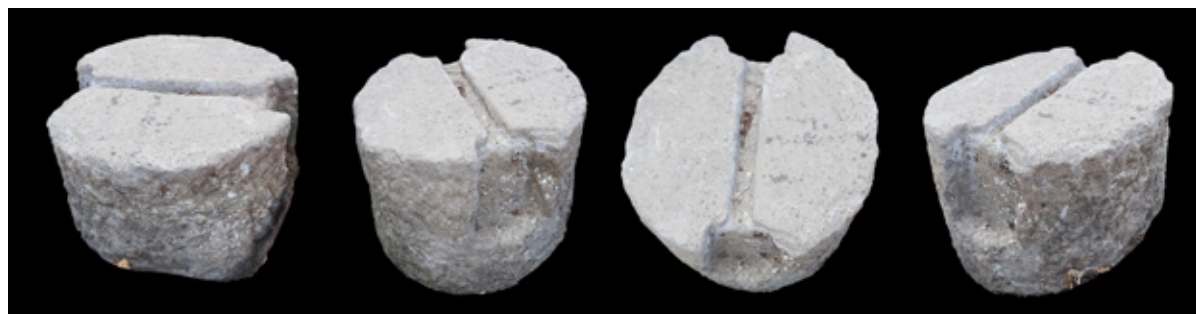
FIGURA 3. Contrapeso de prensa de tornillo para torcularium hallado en Eslava (Paula Faus & Javier Andreu).

Todas estas evidencias nos hablan, sin duda, de la importante producción oleícola y vitivinícola en la región en época romana explicable, sin duda, por las condiciones climáticas del espacio y, también, por las potencialidades que —en la zona— la encrucijada entre las vías Caesar Augusta-Beneharnum , Caesar Augusta-Summum Pyrenaeum y Iacca-Vareia 19 ofrecía para la distribución de los excedentes comercializables de dicha producción. Que el yacimiento de La Venta se ubique, de hecho, no lejos del hipotético, pero verosímil, trazado de esa última vía por tierras de la navarra Val