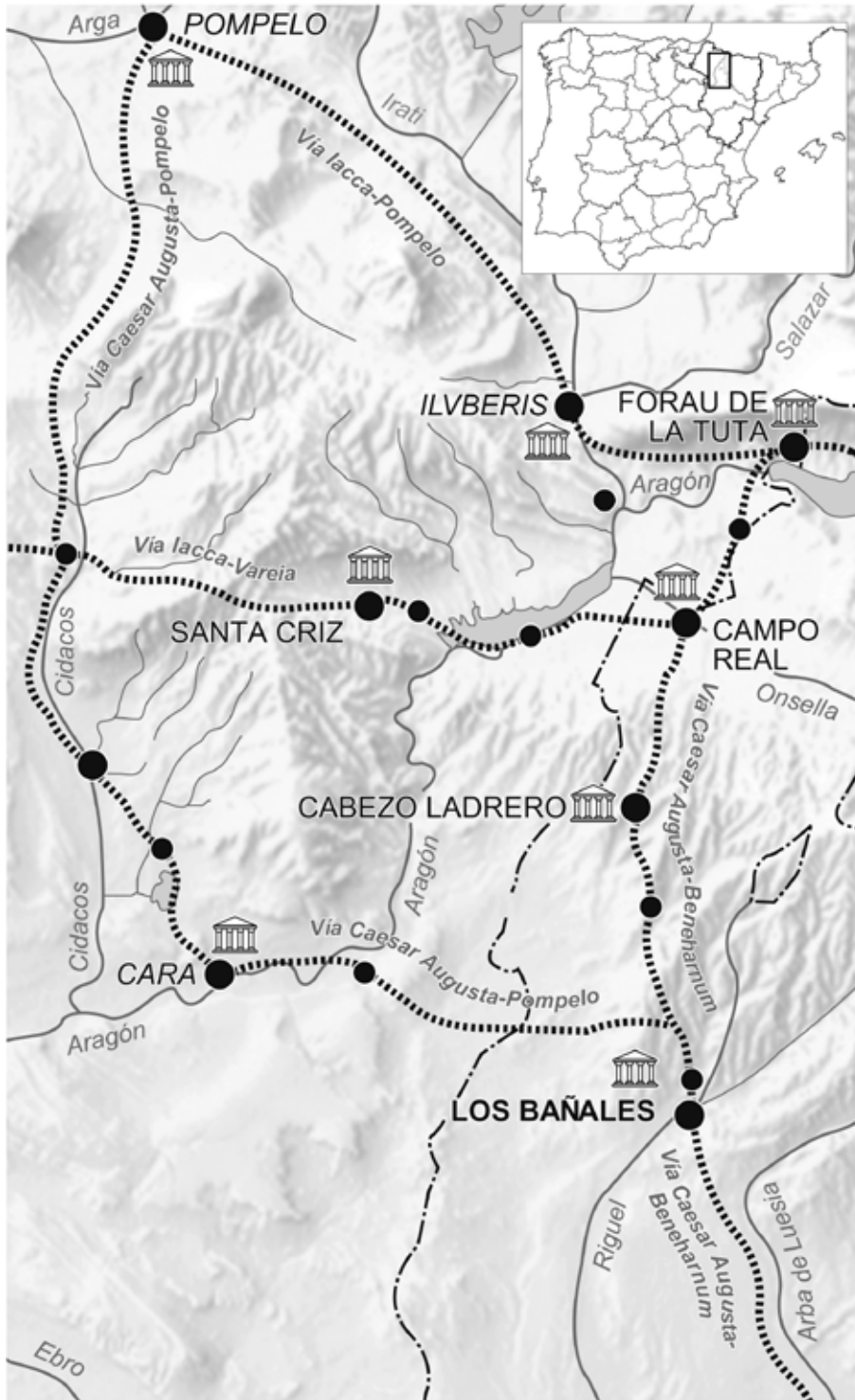
MAPA 1. Ciudades romanas del ámbito oriental del solar de los vascones (Óscar Ribote & Javier Andreu).