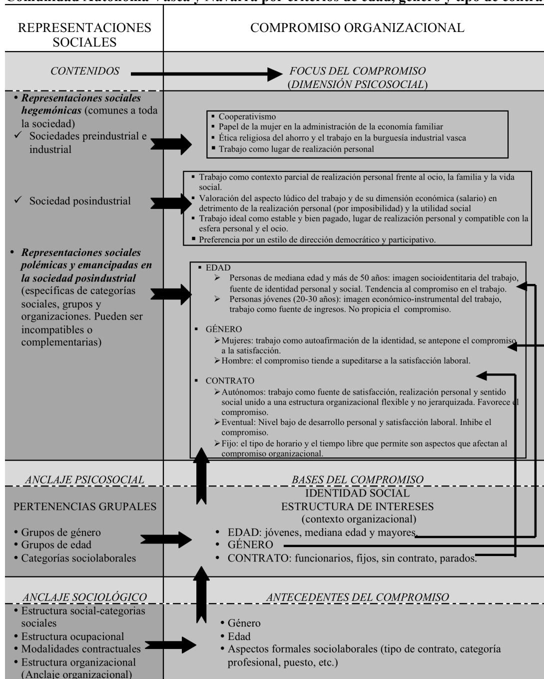
Figura 3.- Representaciones sociales del trabajo y compromiso organizacional en la Comunidad Autónoma Vasca y Navarra por criterios de edad, género y tipo de contrato.