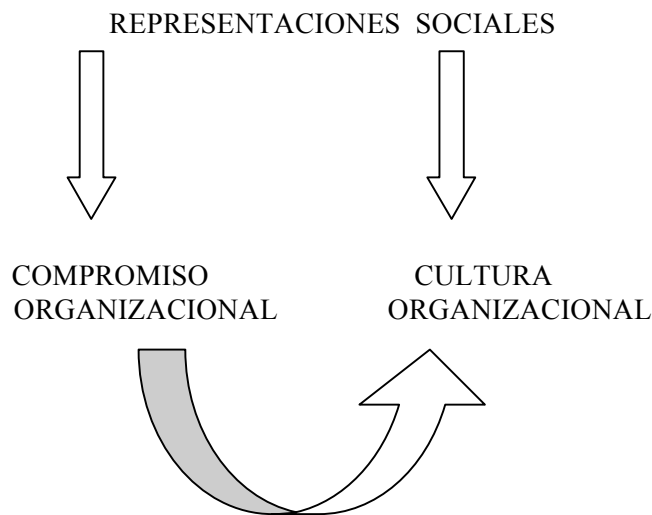
Figura 1. Las representaciones sociales como determinantes del compromiso y de la cultura organizacional.

La Teoría de las Representaciones Sociales constituye a este respecto una herramienta conceptual y metodológica para comprender y potenciar adecuadamente el compromiso organizacional mediante el conocimiento de su sustrato sociocultural y de las dinámicas sociales, grupales y organizacionales a que está sujeto desde un punto de vista psicosocial. Tal y como señala Virtanen, el compromiso es constitutivo de la cultura organizacional, pero del mismo modo el compromiso está, en parte, determinado en sus aspectos psicosociales por las representaciones sociales (Figura 1).