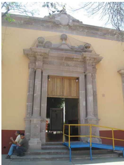
Entrada a la Escuela Francisco de Rivero y Gutiérrez de principios de siglo XX (antiguo Hospital de San Juan de Dios)

que habitamos en este lugar. En ese sentido, la fábrica de todo el conjunto escolar construido en la calle del Relox (Juárez) contaba con el salón principal, la casita contigua a dicha escuela, la vivienda del maestro, gradas y capotera, la entrada o pórtico a la escuela, una enramada en el frente de la finca 11 , así como la casa donde vivió el ilustre benefactor de la niñez y juventud de Aguascalientes, allá por la antigua calle del Apostolado (Rivero y Gutiérrez) y Tacuba (5 de mayo).