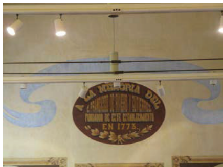
Medallón pintado en la en la pared frontal del salón de clases

niños financiada por una obra pía 14 . Posterior a la consumación de la independencia de México, los habitantes y autoridades de la ciudad agradecen al obispo de Guadalajara, don Juan Cruz Cabañas y Crespo, por apoyar en el pago que se hizo de un maestro de primeras letras en 1821 15 .