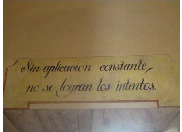
Palabras pintadas en la puerta lateral del salón de clases: “Sin aplicación constante no se logran los intentos”