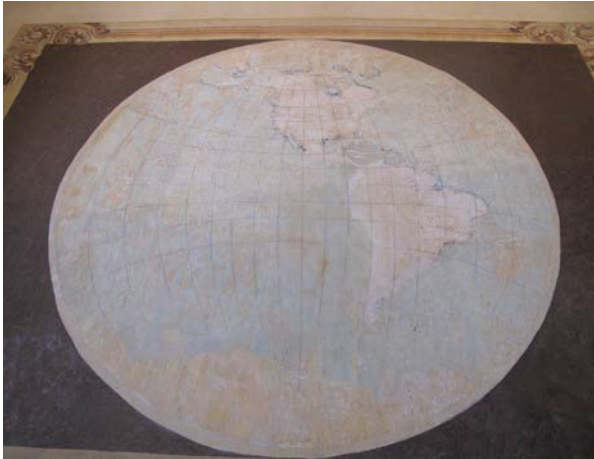
Planisferio pintado en la pared frontal del salón de clases

Una vez lograda la expropiación del inmueble, inmediatamente se comenzó la correspondiente restauración integral de ese relevante legado histórico y arquitectónico por parte del Gobierno del Estado, la cual consistió en restitución de la pintura mural, la adecuación de nuevos espacios y planta arquitectónica, todo ello para que se convirtiese en un lugar de puertas abiertas a la cultura y las artes, teniendo así un reencuentro histórico con la Obra Pía, la historia, la educación y la sociedad de Aguascalientes.