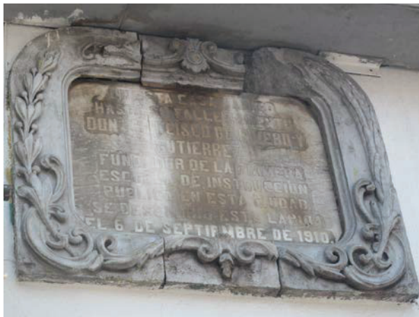
Placa conmemorativa dedicada en el lugar donde vivió nuestro benefactor de la educación, la cual se encuentra entre la esquina de 5 de Mayo y Francisco de Rivero y Gutiérrez.