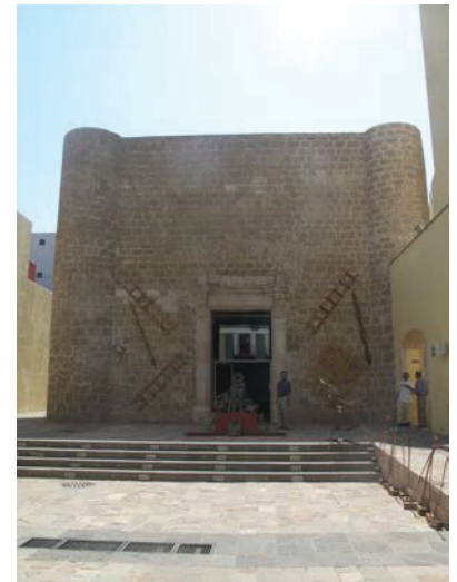
Entrada principal de la Escuela Pía, construida de cantera tipo matacán

La crónica de la fundación de la insigne Escuela Pía parte del proyecto visionario que tuvo su fundador al enviar una carta, el 12 de diciembre de 1773, de solicitud al obispo de Guadalajara, Antonio Alcalde y Barriga.