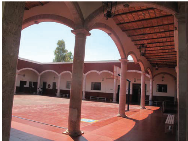
Patio e interior de la Escuela Francisco de Rivero y Gutiérrez de principios de siglo XX (antiguo Hospital de San Juan de Dios)

mexicana 21 , en el bicentenario luctuoso de su muerte en 1976, entre otro muchos, todos ellos en reconocimiento social.