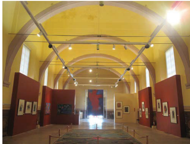
Interior o salón de clases de la Escuela Pía

El réquiem para el ilustre benefactor de la educación tuvo lugar el 27 de agosto de 1776. En su Acta de defunción y en su testamento se plasman la voluntad de don Francisco de Rivero y Gutiérrez de apoyar de manera incondicional no solo la fundación de la insigne Escuela Pía, sino el que contara con instalaciones dignas, para que asistieran el mayor número de niños y jóvenes, con el presupuesto y financiamiento por muchos años para el pago y casa del maestro y, sobre todo, permaneciera laborando como una institución gratuita.