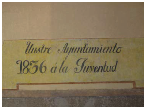
Palabras que dedicó el H. Ayuntamiento de 1836

que importar el modelo Lancasteriano como nuevo método de enseñanza. En ese sentido, la Enseñanza mutua se implantó en Aguascalientes durante el siglo XIX, prueba de ello es la existencia de la Sociedad Lancasteriana de 1875 17 . En el último tercio del siglo XIX se le cambió de nombre, al pasar de Escuela Pía a Escuela Principal (1863 a 1866) 18 .