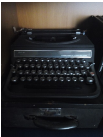
Figura 12. El Conservador-restaurador y el Patrimonio científico y técnico.

Este módulo presenta el cruce bajo el concepto de bien cultural, entre el Arte, la Ciencia y las Tecnologías. Se presentarían bienes culturales de interés científico y técnico en relación a las Bellas Artes, la Medicina, Farmacia, Mineralogía, Zoología, Veterinaria, Medicina, Física, Química, etc. Sería un sector muy importante. Interesa resaltar la importancia de este módulo, quizás con alguna exposición temporal. Las universidades en general conservan unos elementos o bienes muy interesantes especialmente en esta categoría. La herencia de los bienes culturales técnico-científico es lógico que quede ligada a la evolución de las propias disciplinas, aunque no todas musealizan los instrumentos, los objetos técnicos y científicos, considerando muchas veces, que al quedar anticuados no sirven para nada. Recordemos que la Universidad de Sevilla conserva un legado técnico científico ligado a disciplinas como Farmacia, Medicina entre otros, y le correspondería al Museo de la Conservación y Restauración ampliar