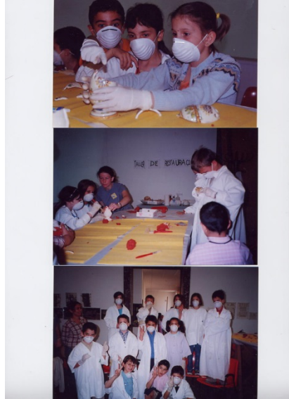
Figura 18. Proyectos educativo.s