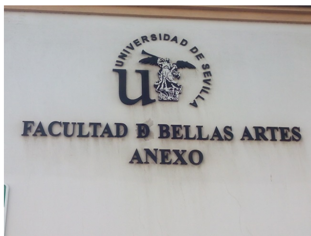
Figura 2 y figura 3. Fotografía del edificio de Gonzalo Bilbao, actual sede del Grado de Conservación y Restauración de Bienes Culturales.