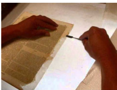
Figura 14. El Conservador-restaurador y el Patrimonio bibliográfico.

El Museo de la Historia de la Conservación y Restauración de bienes Culturales no puede olvidar este sector o módulo. Debe materializar a través de la museografía la historia del libro y la historia de la escritura, para pasar a mostrar el patrimonio bibliográfico y documental, como objeto de atención y tutela por el conservador.