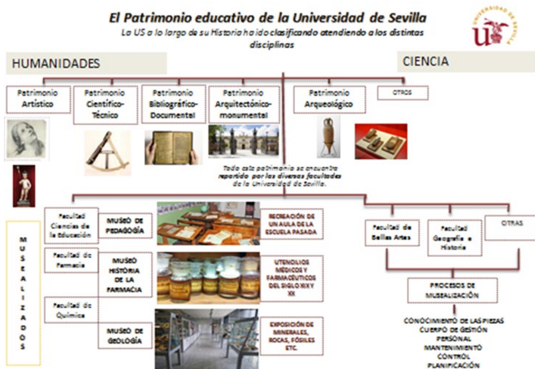
Figura 1. Cuadro sobre los museos y colecciones de la Universidad de Sevilla. (Autora: María Luisa Cueva)

En este caso, el proyecto de museo se pone en marcha paralelamente a una profesión que se consolida, el conservador-restaurador de bienes culturales y unos estudios que han tomado una forma coherente y estructurada, en el marco de la Reforma o Plan Bolonia (Ruiz de Lacanal, 2018).