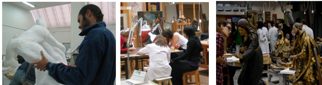
Figura 6. El artista-escultor. Facultad de Bellas Artes, Escultura

Un objetivo claro de este museo universitario sería mostrar la evolución del artista-restaurador al trabajo profesional del conservador-restaurador de bienes culturales en las instituciones públicas.