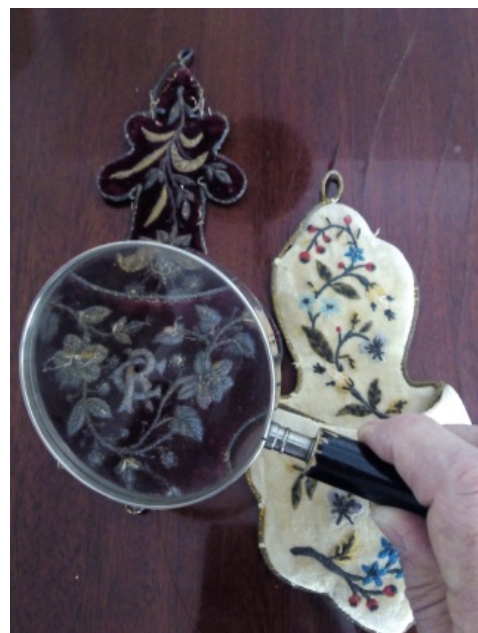
Figura 11. El Conservador-Restaurador y las obras de arte.