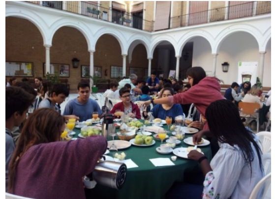
Figuras 19 y 20. Café con Ciencia. Un proyecto de difusión de la Conservación y Restauración de BB.CC. en el ámbito de la Universidad de Sevilla, realizado en el año 2017.