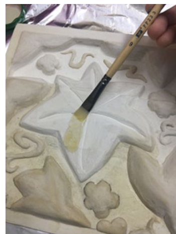
Figura 9. El conservador-restaurador de bienes culturales y el Patrimonio inmueble.