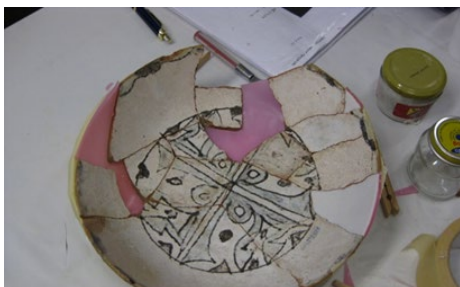
Figura 13. El conservador-restaurador y el Patrimonio etnográfico.

El patrimonio etnográfico aporta un sector muy importante al concepto de bien cultural. En general, no es fácil, ilustrar este módulo. Sin embargo, se convierte en un reto para la museología universitaria sevillana, introducir bienes y actividades que albergan o constituyen formas relevantes de expresión de la cultura y modos de vida propios del pueblo andaluz. La declaración de prácticas, saberes, y otras expresiones culturales como de interés etnológico, le conferirá