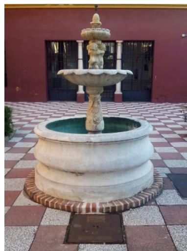
Figuras 4 y 5. Imagen general y detalle del Jardín del antiguo estudio del pintor Gonzalo Bilbao, actual sede del Anexo de la Facultad de Bellas Artes, de la Universidad de Sevilla