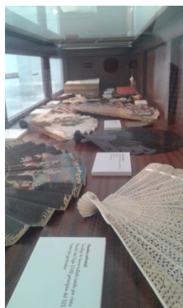
Figuras 15 y 16. Figuras. Vitrina y montaje expositivo. Exposición temporal realizada en 2018 con colaboración de becarios del grado de Conservación y Restauración de Bienes Culturales.