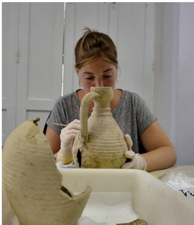
Figura 17. Restauración, alumna de Conservación y Restauración de Bienes Culturales.

Enfocar correctamente los términos conservación y restauración es uno de los grandes objetivos del proyecto. Mientras que la restauración puede ser presentada mediante imágenes, objetos o textos que expliquen las operaciones destinadas a devolver la inteligibilidad y unidad formal al bien cultural; la conservación, presentarían no solo las operaciones destinadas a mantener o modificar las condiciones el medio ambiente para hacerlas favorable a la conservación, sino además plantearía los planes de sostenibilidad de una colección, un conjunto histórico o incluso el patrimonio natural.