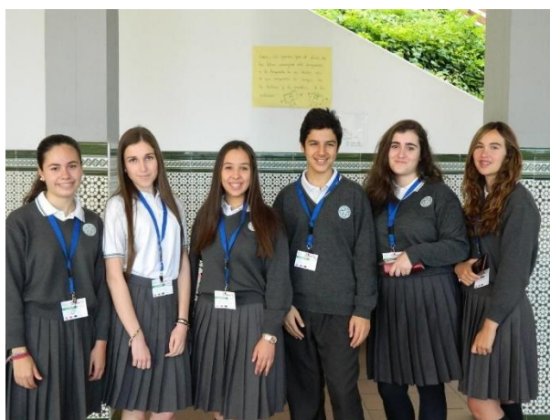
Figura 2. Alumnos participantes en las Olimpiadas de Religión, 2016.