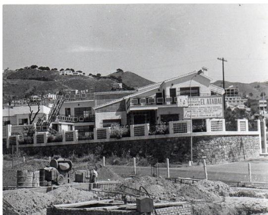
Figura 3. Vista exterior del Colegio construida ya la primera fase, hacia 1969.