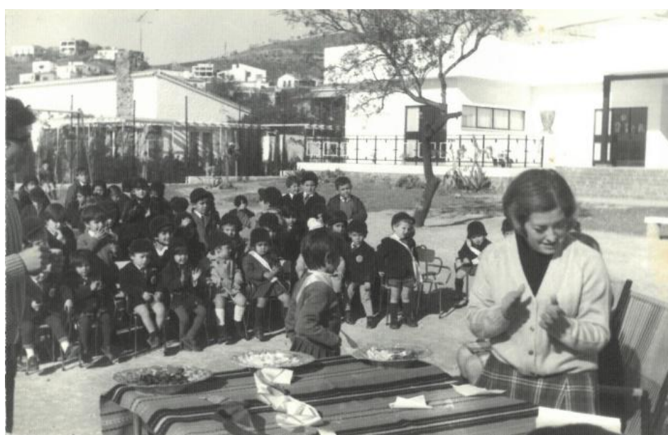
Figura 1. Celebración fin de curso, hacia 1969-1970.

Repartidas todas las tareas a desarrollar los alumnos trabajaron desde el comienzo del curso una hora a la semana en el aula y otra en casa, precisando en ocasiones realizar diversas tareas fuera del horario establecido. Si bien las nuevas tecnologías (redes sociales y correos) permitían al alumno conocer en todo momento el desarrollo del trabajo, dos veces al trimestre eran las dos clases citadas de forma conjunta para así exponer los avances y las dificultades que se iban encontrando.