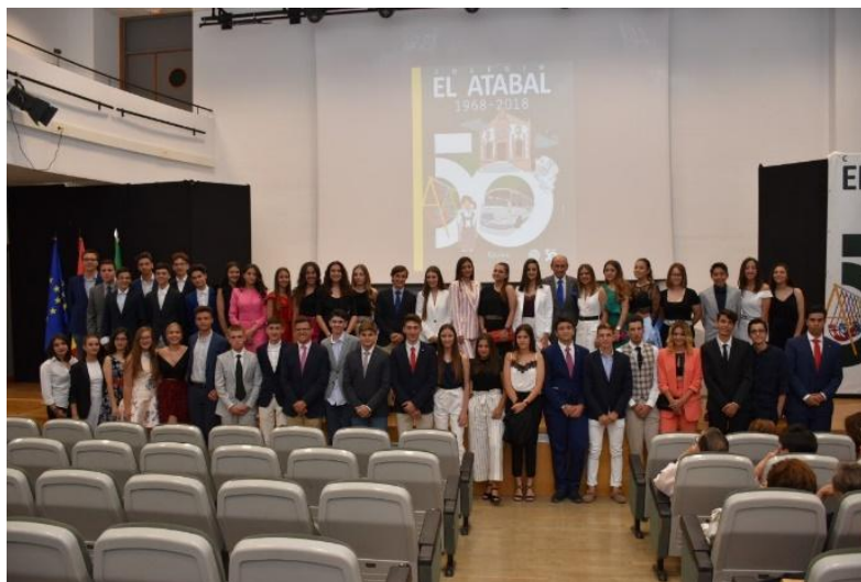
Figura 5. Alumnos de 4º de ESO del Colegio El Atabal en el salón de actos de la Facultad de Ciencias de la Educación de la Universidad de Málaga.