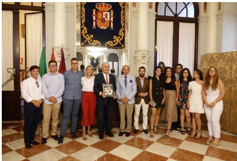
Figura 6. El alcalde de Málaga, con el libro en mano, y los protagonistas de la investigación en el Salón de los Espejos del Ayuntamiento.

Es indudable que el alumnado que desarrolló la iniciativa ha mostró una enorme satisfacción por escribir la historia fundacional de su Colegio en un marco cercano, primario y directo. El haber contribuido en primera persona a conocer la información, a buscar recuerdos, realizar entrevistas, analizar y trabajar con los materiales, y estudiar las fotografías entre otras muchas cosas, ha permitido a los alumnos contribuir con la producción de un trabajo serio y riguroso como es la realización de la Historia de su Colegio. En el trabajo han encontrado una forma de hacer y estudiar historia totalmente novedosa y renovadora para su aprendizaje. En lugar de ser sujetos pasivos, han sido elementos activos de un proceso de investigación en el que se han visto comprometidos e ilusionados. Son alumnos que con 15 y 16 años han recabado testimonios pedagógicos de los más diversos ámbitos que se generan en la escuela y que han llevado al papel para que las generaciones venideras conozcan la historia de un Colegio que desarrollaron los propios alumnos del Colegio.