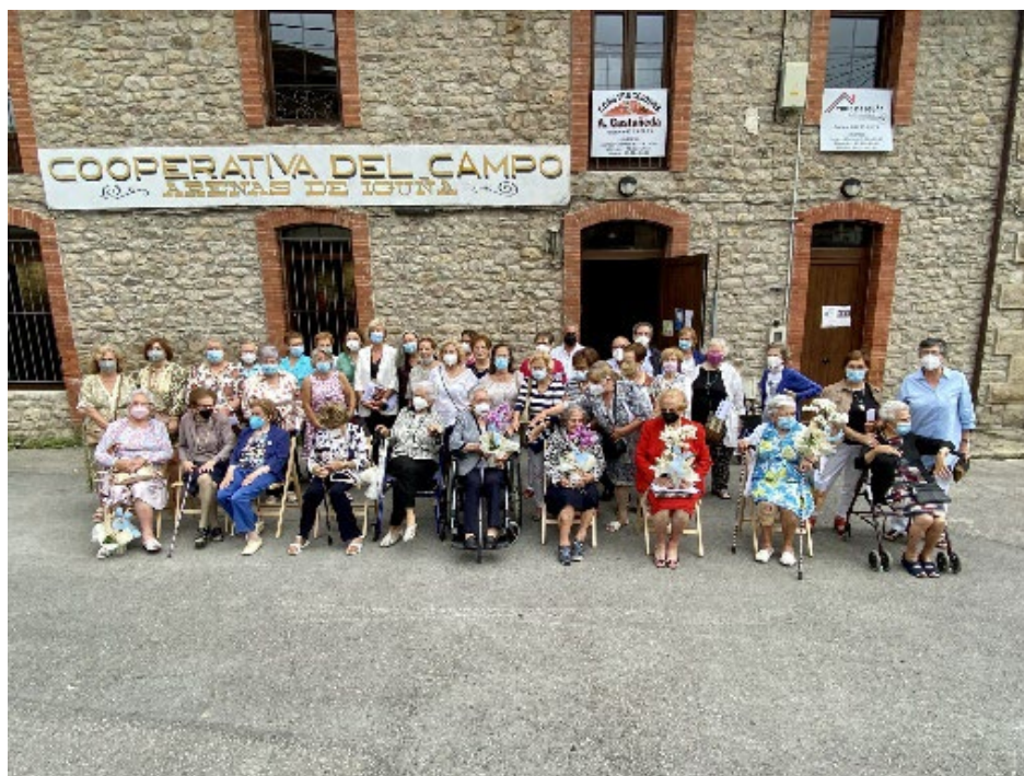
Las participantes en el acto del 14 de agosto de 2021

Se realizó también la primera difusión de una parte de esta investigación: se presentó el monográfico “ Maestras y alumnas de la escuela de niñas de la Asociación de Labradores La Providencia ”, un cuaderno que llamamos de Memoria, en el que recogemos la historia del local de la escuela y la de sus maestras. El cuaderno está abierto a las nuevas aportaciones de sus exalumnas. Posteriormente, este monográfico se ofreció además a los vecinos del municipio interesados en conocer la historia que cuenta; y actualmente se puede leer en la web de nuestro ayuntamiento. El acto se cerró con un homenaje a la maestra y las exalumnas mayores de 80 años. Además de nuestro alcalde, nos acompañó la consejera de Educación y Formación Profesional, doña Marina Lombó, que con su presencia honró la memoria de nuestras maestras y de las exalumnas presentes y mostró así la importancia de preservar la historia de la escuela de nuestro pueblo.