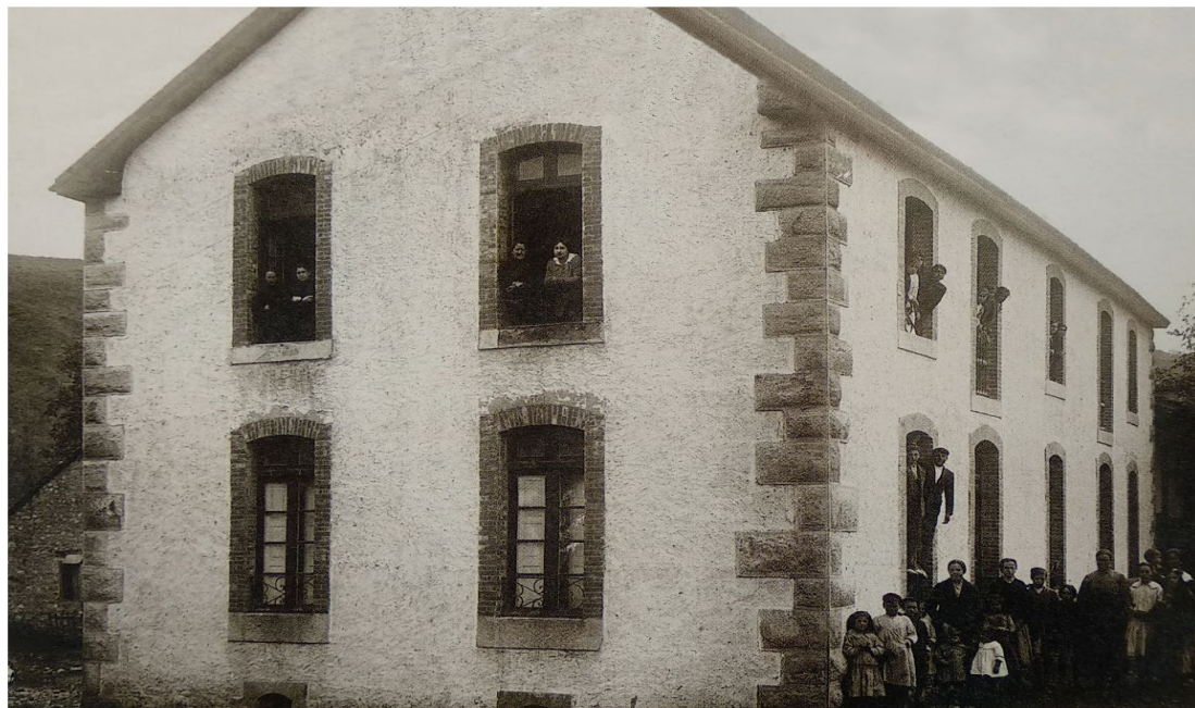
Fotografía de 1918 realizada por el inspector de primera Enseñanza Daniel Luis Ortiz Díaz

Asociación Movimiento Cultural Iguña (Cantabria, España)