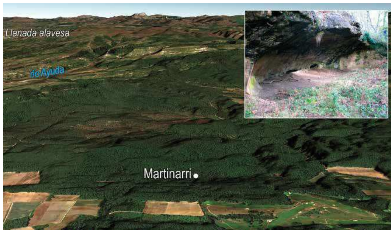
Fig. 5 – Vista oblicua del bosque de Izki con la ubicación de Martinarri. En el recuadro, abrigo de Martinarri (fondo: Google Earth). Fig. 5 – Oblique view of the Izki forest with the location of Martinarri. In the box, the site of Martinarri (background: Google Earth).

El conjunto industrial documentado en nuestros yacimientos se ve afectado por un factor determinante: la industria ósea, tan característica del Magdaleniense cántabro-aquitano, ha llegado hasta nuestros días en estado muy precario, privándonos de una importante base com-