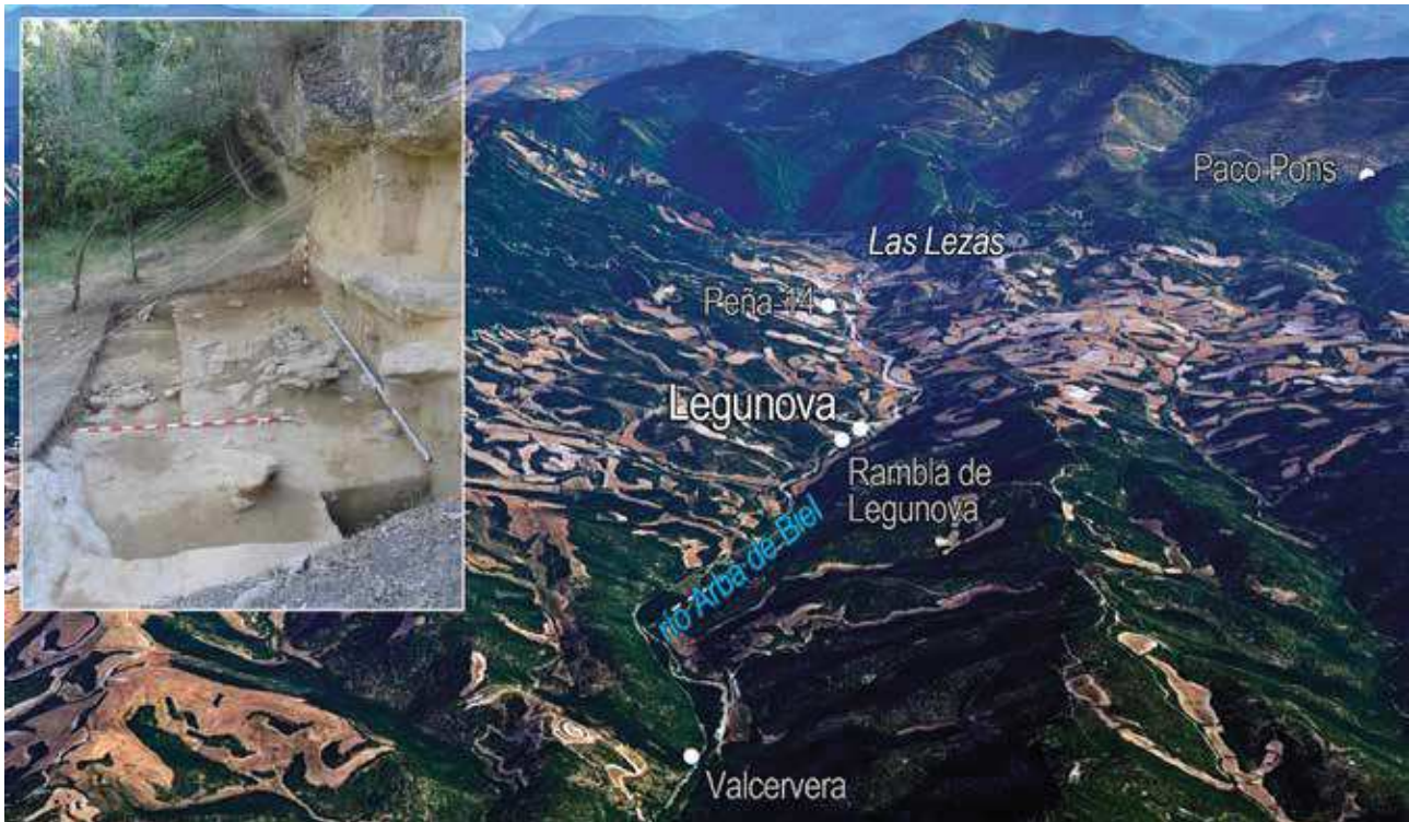
Fig. 6 – Vista oblicua del alto Arba de Biel con la ubicación de Legunova, Peña-14, Valcervera, Rambla de Legunova y Paco-Pons. Se indica también el afloramiento de sílex de Las Lezas. En el recuadro, abrigo de Legunova (fondo: Google Earth).

Fig. 6 – Oblique view of the upper Arba de Biel with the location of Legunova, Peña-14, Valcervera, Rambla de Legunova and Paco-Pons, as well as the flint outcrop of Las Lezas (background: Google Earth). In the box, the rock-shelter of Legunova.