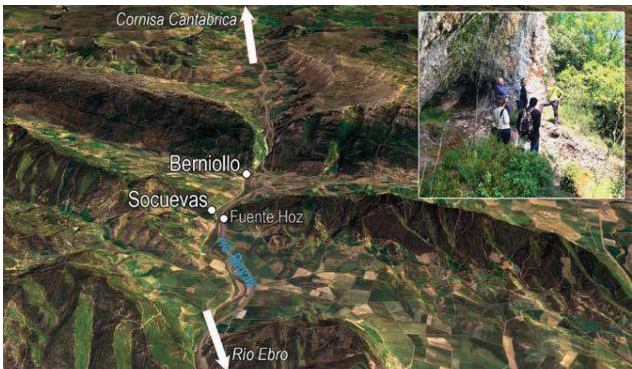
Fig. 4 – Vista oblicua del Portillo de Techa con la ubicación de Socuevas, Berniollo y Fuente Hoz. En el recuadro, abrigo de Socuevas.

Fig. 3 – Oblique view of the port of Azazeta with the location of Atxoste, Kanpanoste and Kanpanoste Goikoa. In the box, the site of Atxoste.