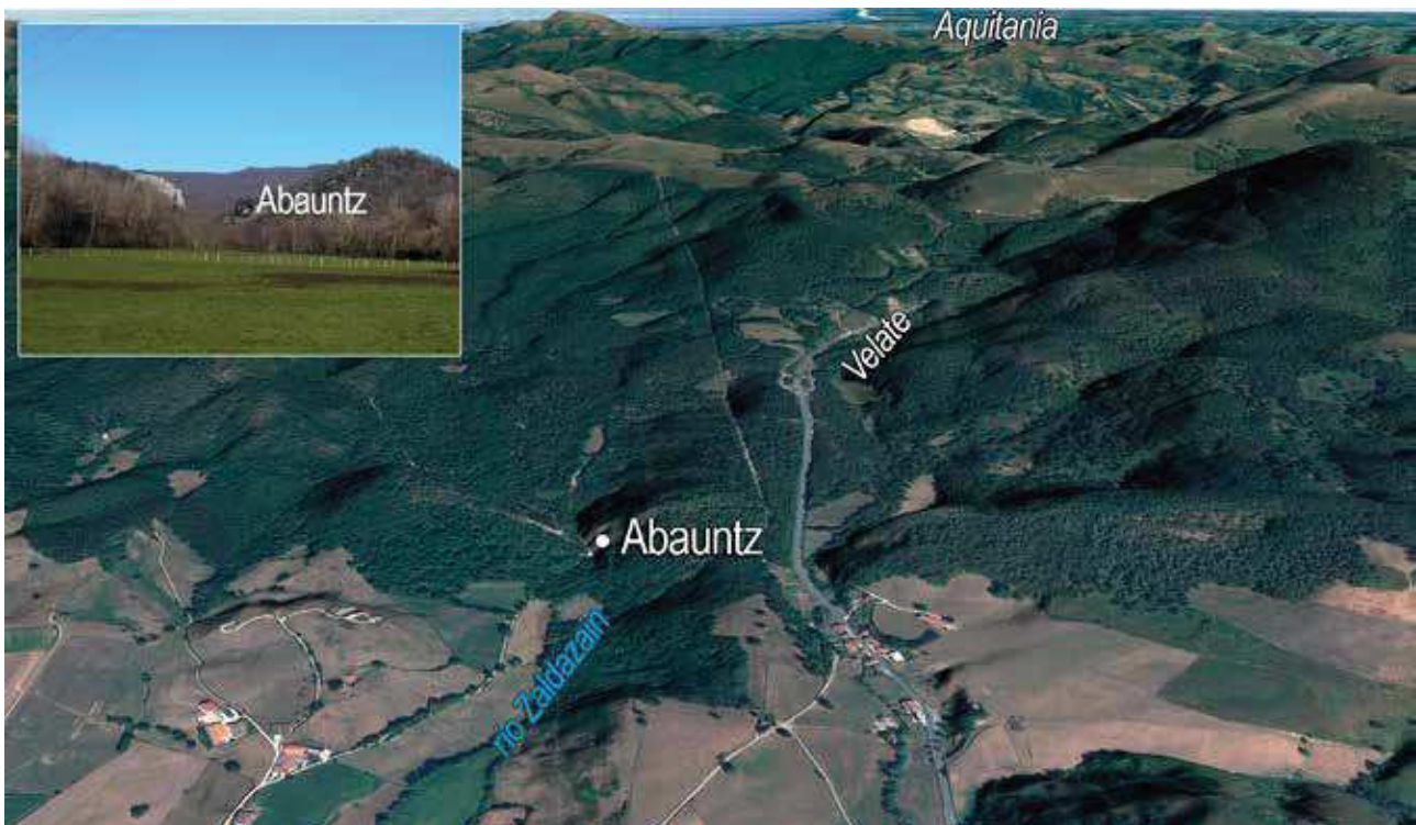
Fig. 7 – Vista oblicua del puerto de Velate con la ubicación de Abauntz. En el recuadro, desfiladero del Zaldazain entre Abauntz (derecha) y San Gregorio (izquierda).

Fig. 6 – Oblique view of the upper Arba de Biel with the location of Legunova, Peña-14, Valcervera, Rambla de Legunova and Paco-Pons, as well as the flint outcrop of Las Lezas. In the box, the rock-shelter of Legunova.