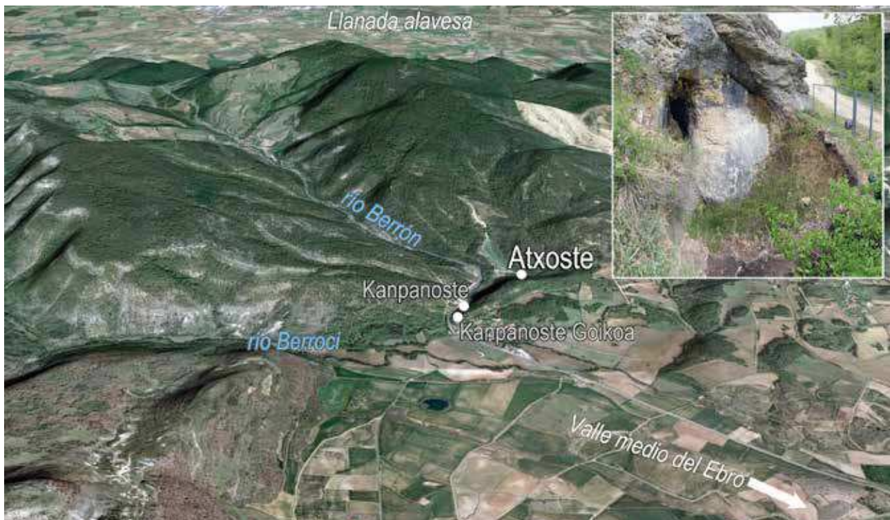
Fig. 3 – Vista oblicua del puerto de Azáqueta con la ubicación de Atxoste, Kanpanoste y Kanpanoste Goikoa. En el recuadro, abrigo de Atxoste (fondo: Google Earth).

Fig. 3 – Oblique view of the port of Azazeta with the location of Atxoste, Kanpanoste and Kanpanoste Goikoa. In the box, the site of Atxoste (background: Google Earth).