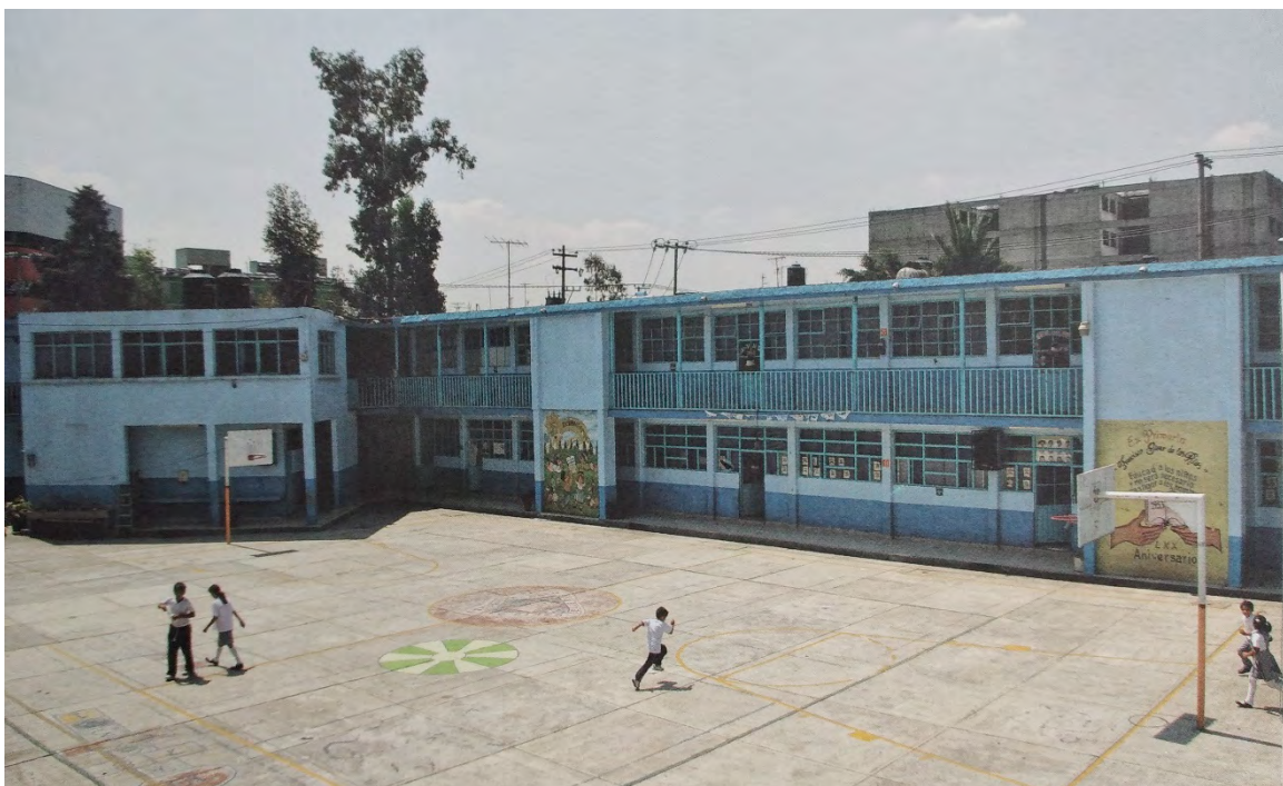
Imagen 6. Fachada interior de escuela primaria Francisco Giner de los Ríos