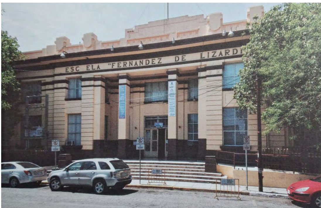
Imagen 5. Fachada de escuela Fernández de Lizardi