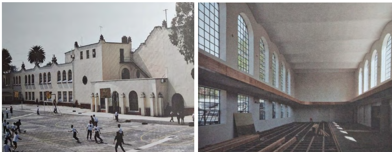
Imagen 3 y 4. Vistas interiores y exteriores de escuela primaria Benito Juárez