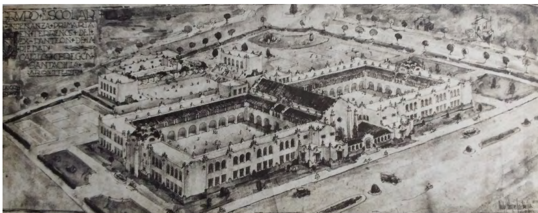
Imagen 2. Dibujo en perspectiva de escuela primaria Benito Juárez