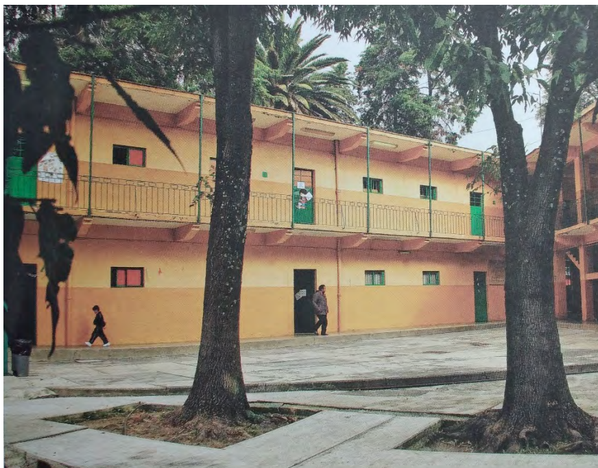
Imagen 8. Fachada exterior de escuela primaria Melchor Ocampo