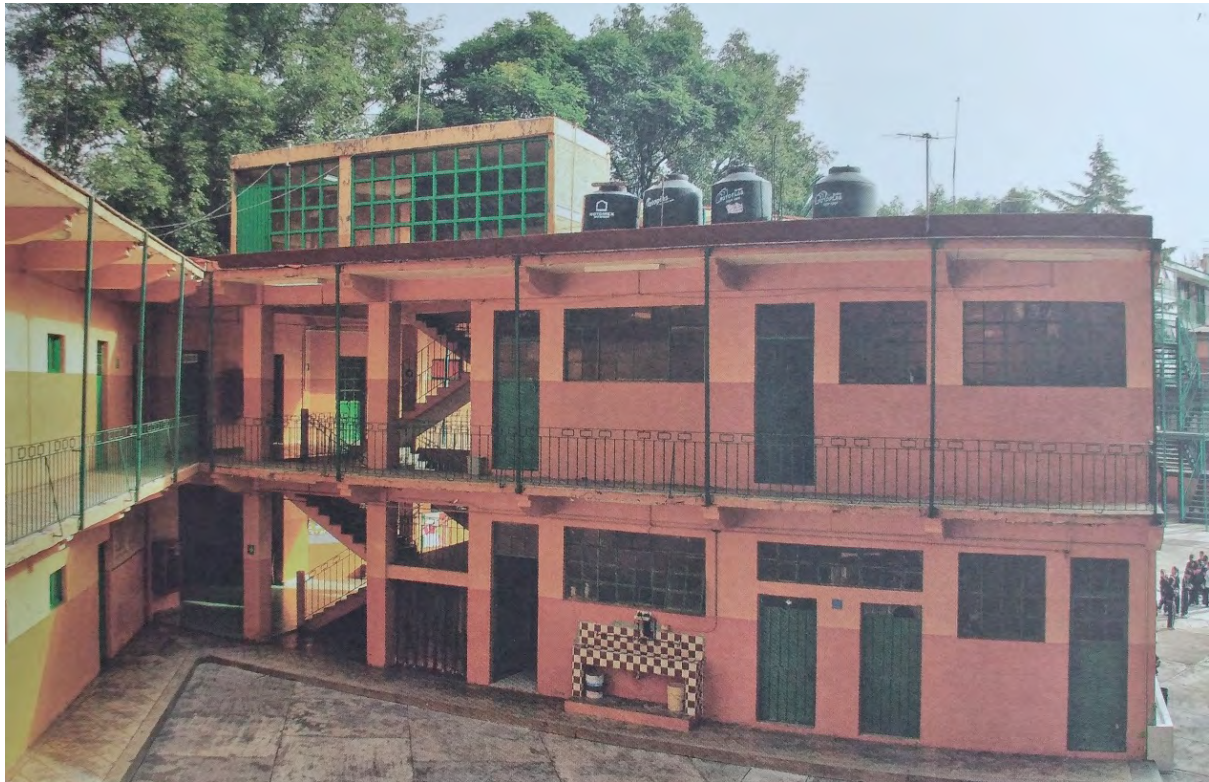
Imagen 7. Fachada interior de escuela primaria Melchor Ocampo